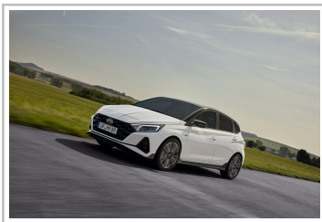
Hyundai i20 N.