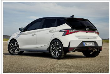
Hyundai i20 N.