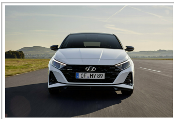
Hyundai i20 N.