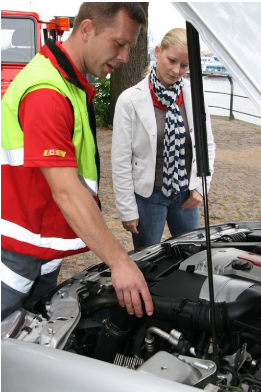
ACE-Pannenhelfer im Einsatz.