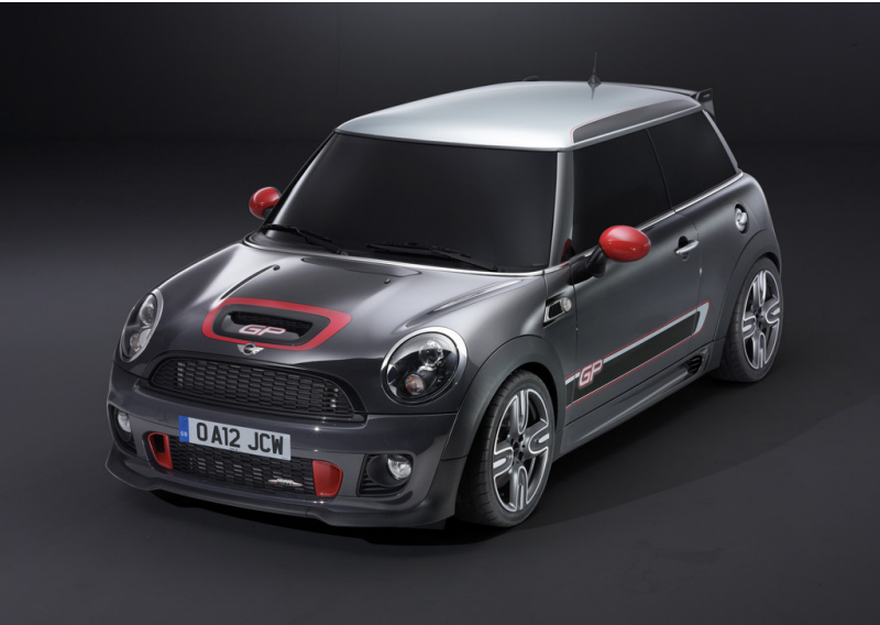
Mini John Cooper Works GP.