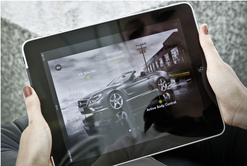
Mercedes-Benz steigert App-Präsenz.