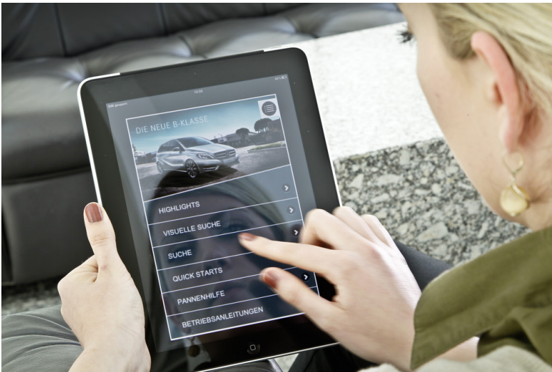
Mercedes-Benz steigert App-Präsenz.