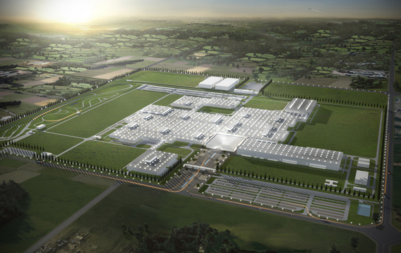
Eröffnung des BMW-Produktionswerks Tiexi.