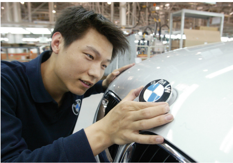
Eröffnung des BMW-Produktionswerks Tiexi.