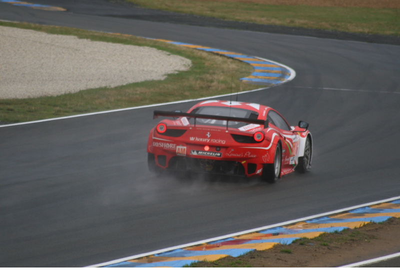
Le Mans 2012: Warm-up. Le Mans 2012: Warm-up.