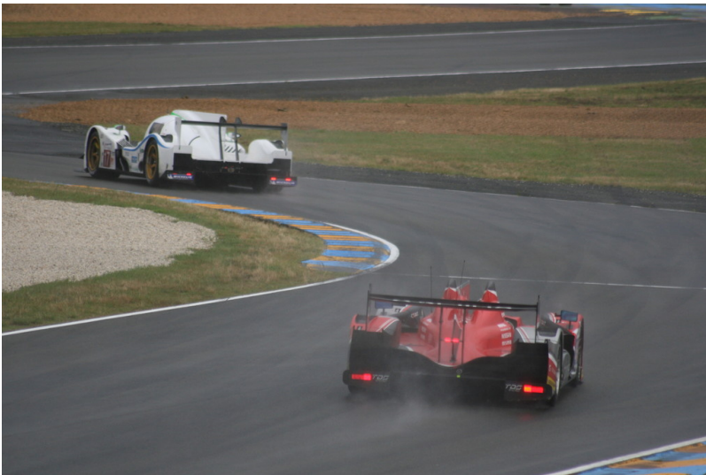
Le Mans 2012: Warm-up.