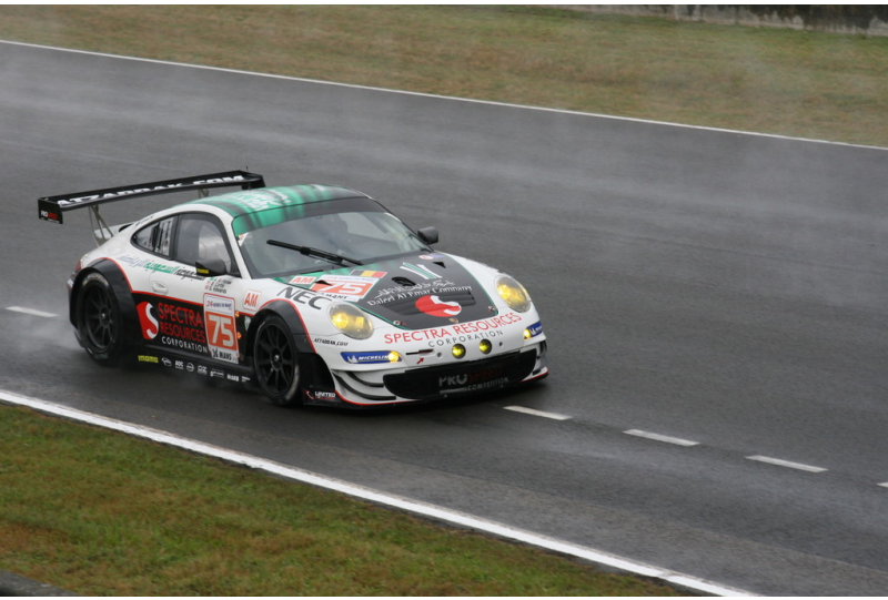
Le Mans 2012: Warm-up.