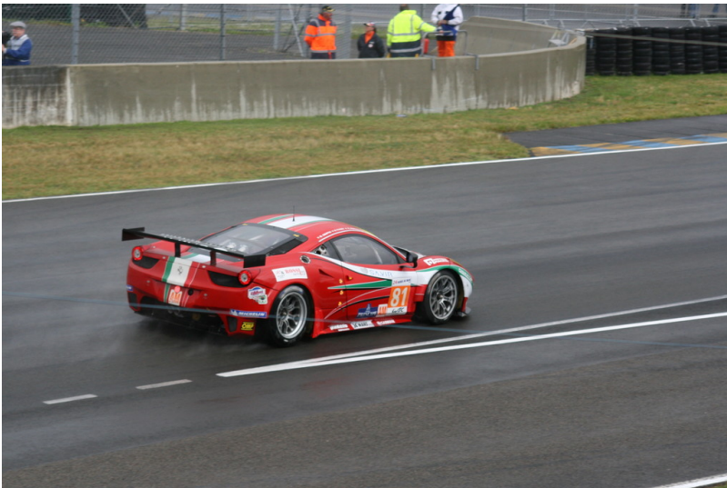
Le Mans 2012: Warm-up. Le Mans 2012: Warm-up.