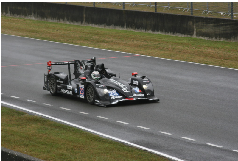
Le Mans 2012: Warm-up.