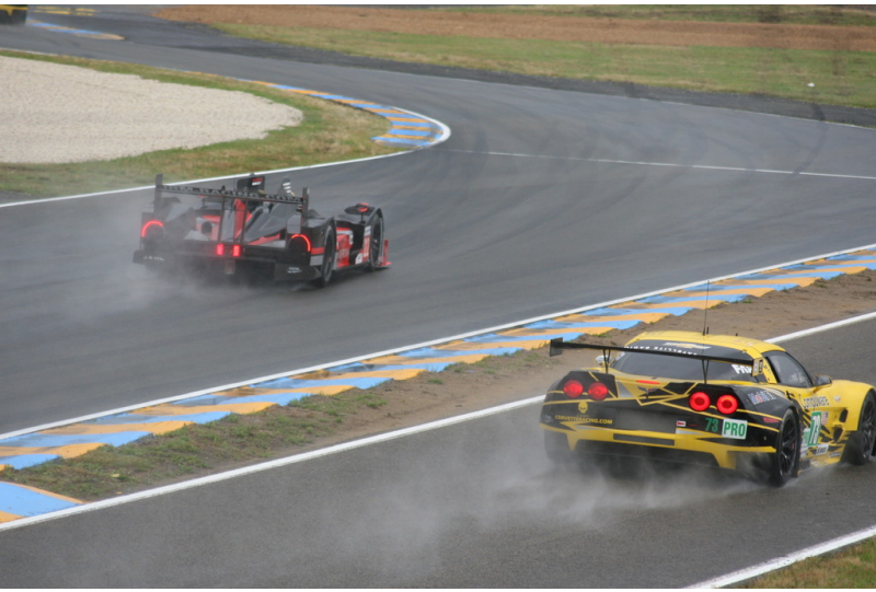
Le Mans 2012: Warm-up.