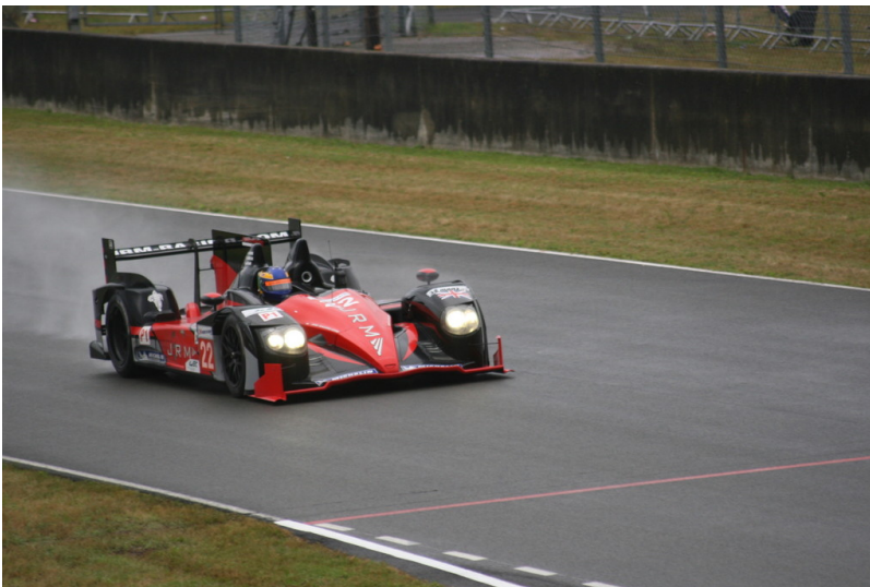
Le Mans 2012: Warm-up.