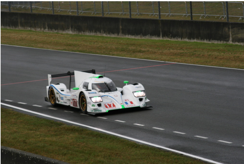
Le Mans 2012: Warm-up.