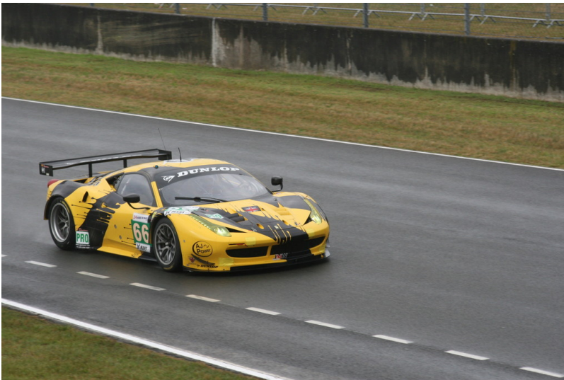
Le Mans 2012: Warm-up.