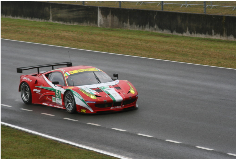
Le Mans 2012: Warm-up.