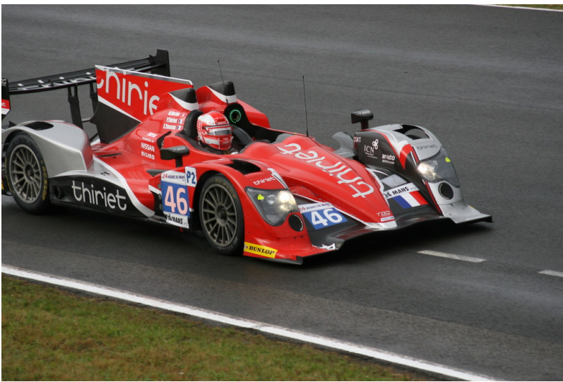
Le Mans 2012: Warm-up.