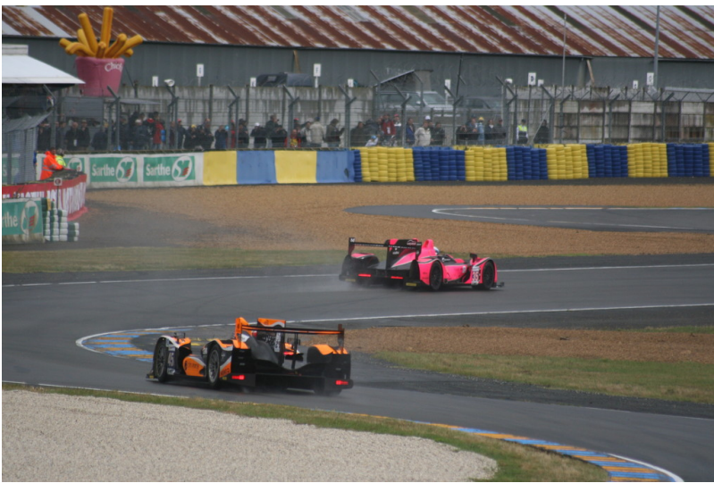
Le Mans 2012: Warm-up.