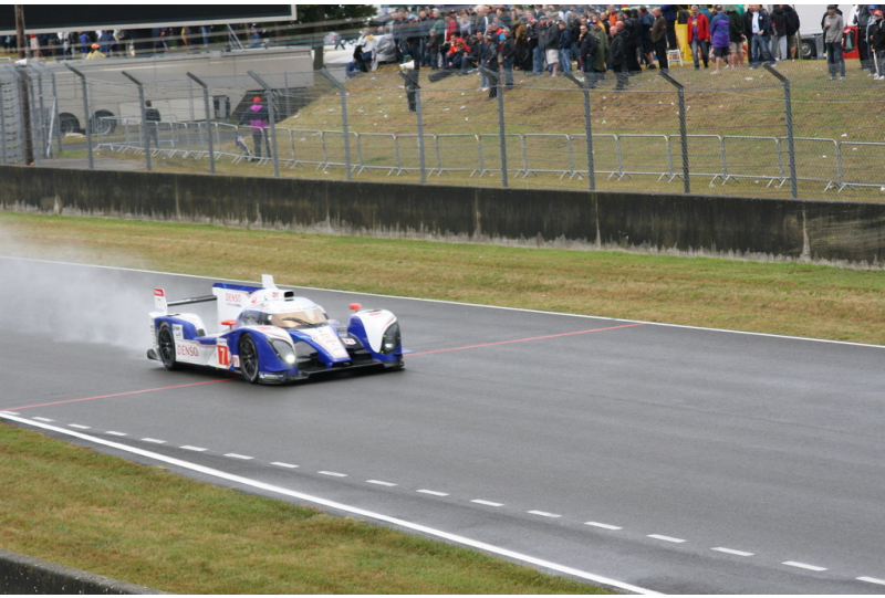
Le Mans 2012: Warm-up.