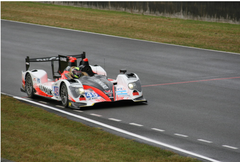
Le Mans 2012: Warm-up.