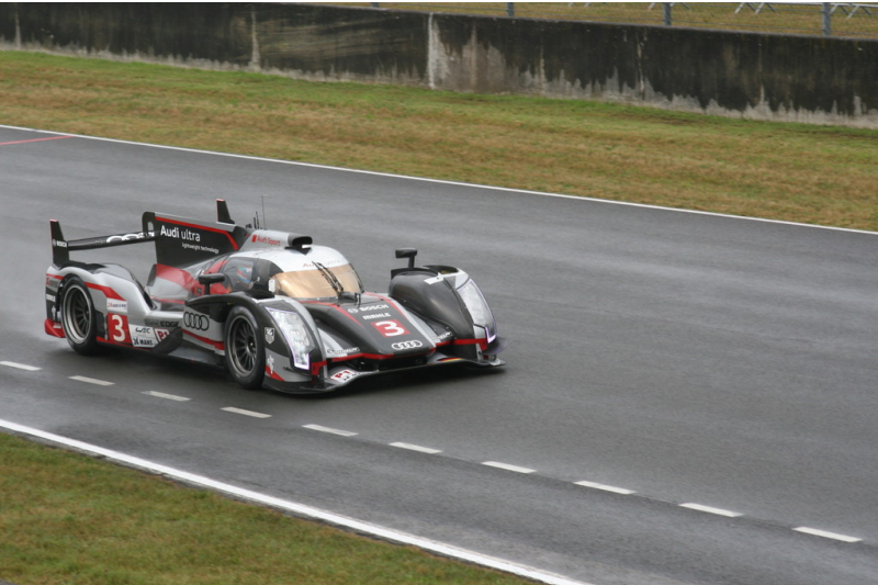
Le Mans 2012: Warm-up.