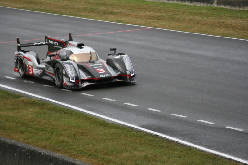
Le Mans 2012: Warm-up.