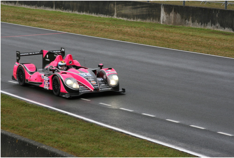
Le Mans 2012: Warm-up.