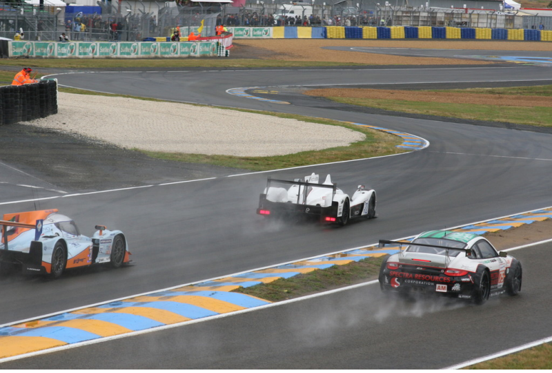
Le Mans 2012: Warm-up. Le Mans 2012: Warm-up.