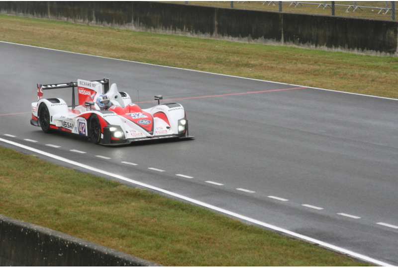
Le Mans 2012: Warm-up.