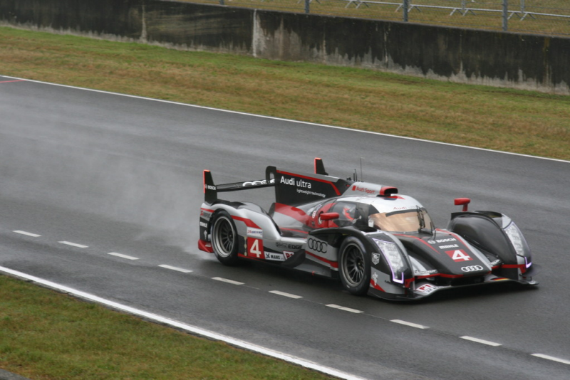
Le Mans 2012: Warm-up.