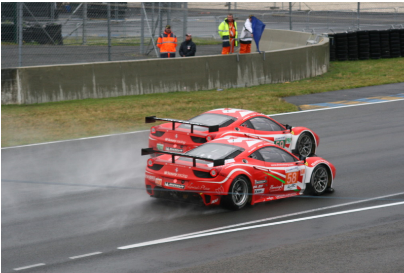
Le Mans 2012: Warm-up.