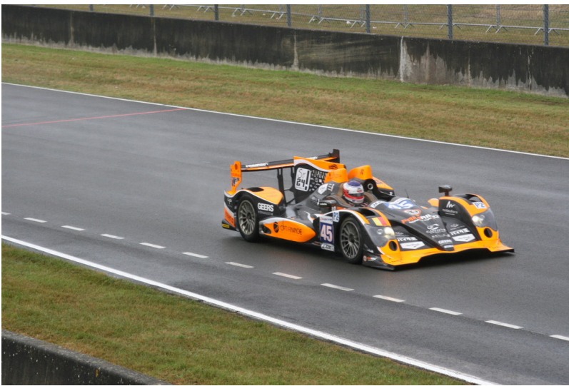
Le Mans 2012: Warm-up.