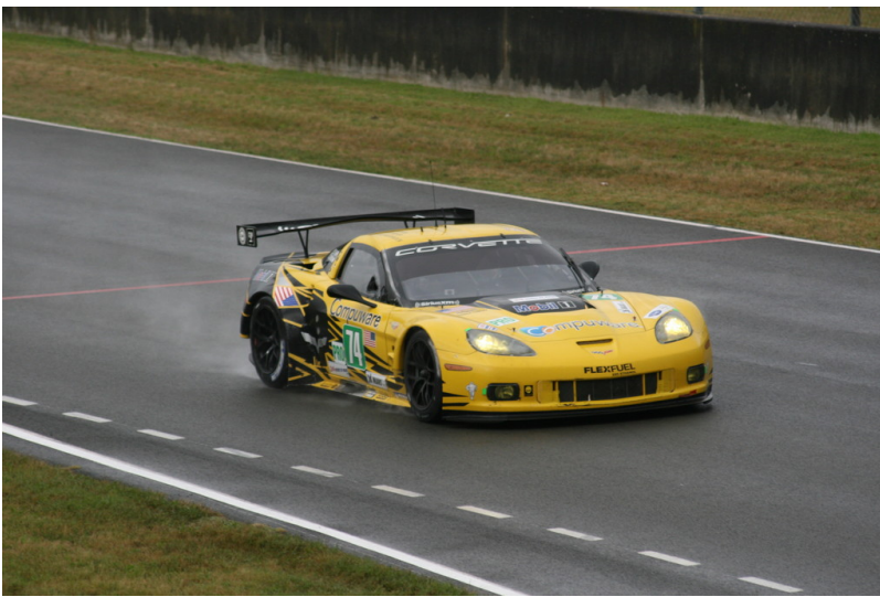
Le Mans 2012: Warm-up.