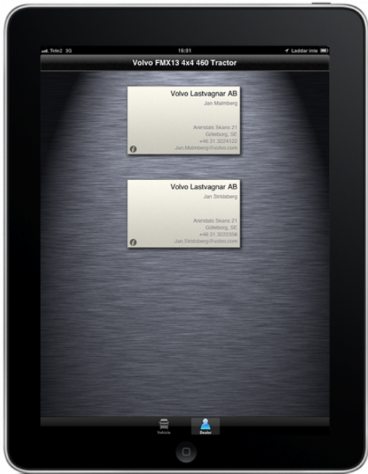
Truck Finder App von Volvo Trucks.