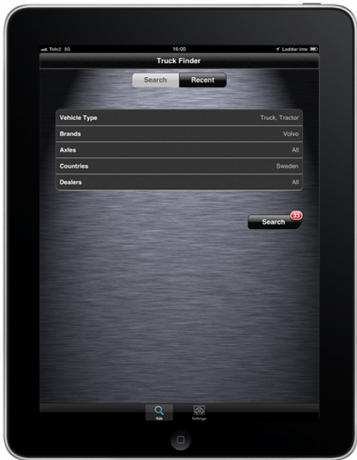
Truck Finder App von Volvo Trucks. Truck Finder App von Volvo Trucks.