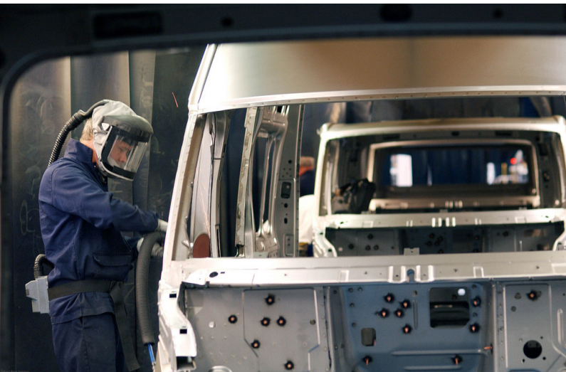
Produktion im Ford-Werk Southampton.