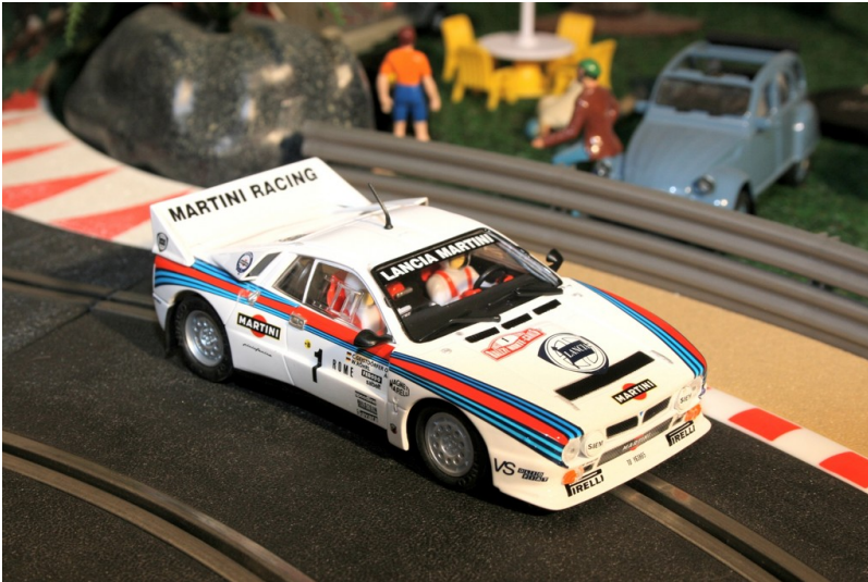
Lancia 037 von Ninco.