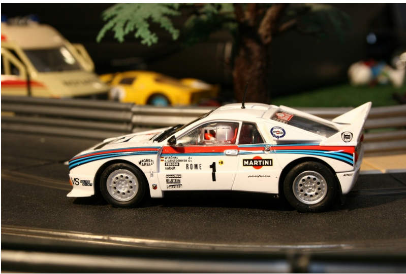
Lancia 037 von Ninco.