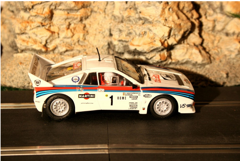
Lancia 037 von Ninco.