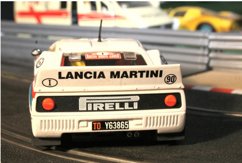
Lancia 037 von Ninco.