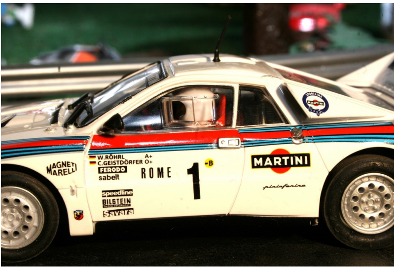
Lancia 037 von Ninco.