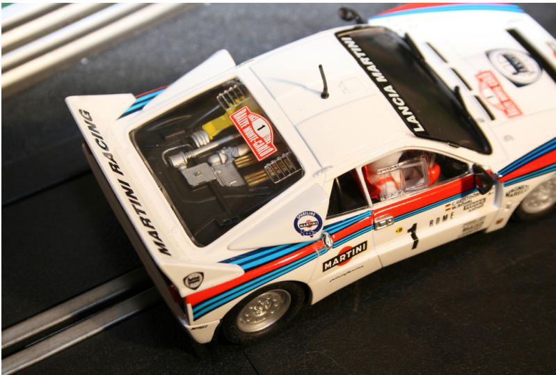
Lancia 037 von Ninco.