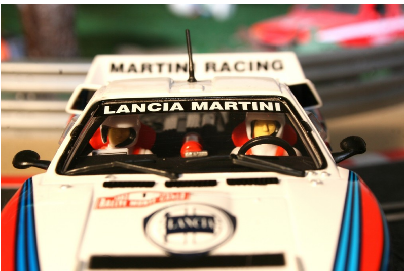
Lancia 037 von Ninco.