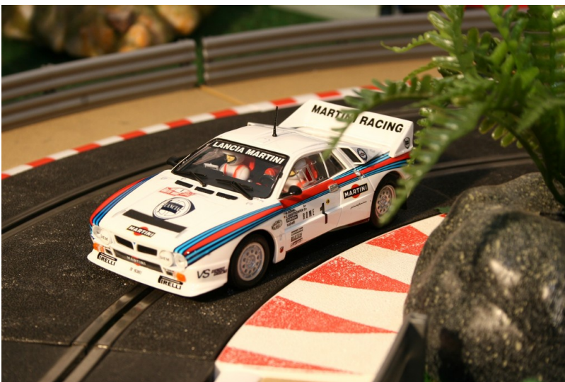
Lancia 037 von Ninco.