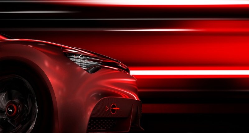
Kia Concept Car.