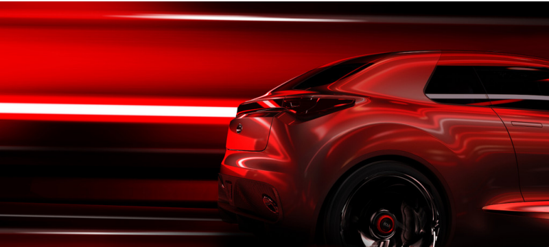
Kia Concept Car.