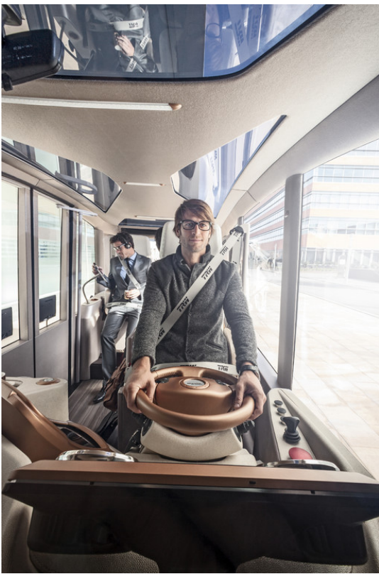
Rinspeed Micromax. Rinspeed Micromax.