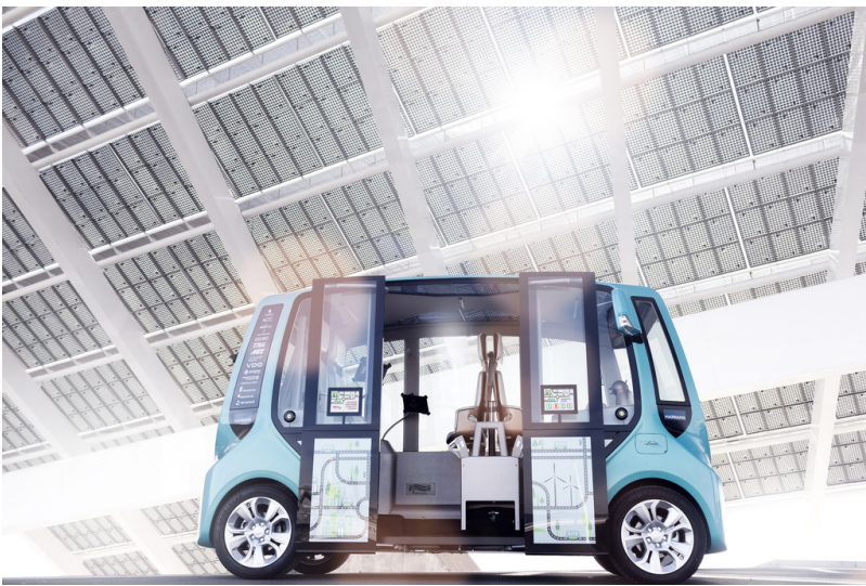
Rinspeed Micromax. Rinspeed Micromax.