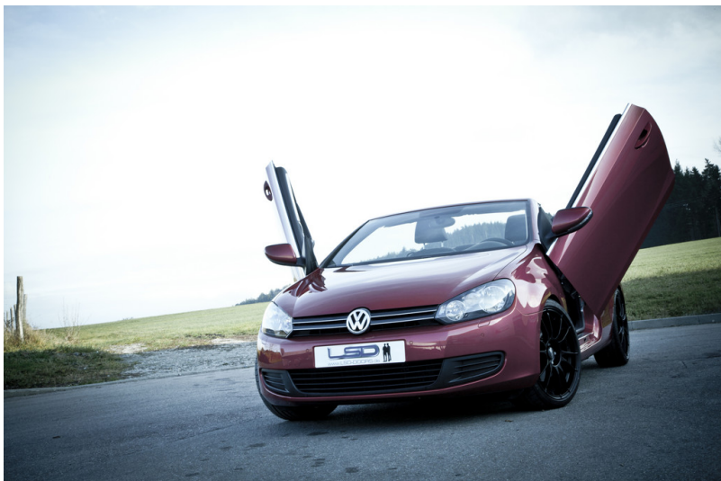
VW Golf VI Cabriolet mit LSD-Doors.