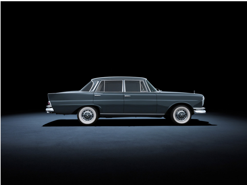
Techno Classica 2013: Mercedes-Benz 220 SE (W 111, 1959 bis 1965). Im Bild ein Fahrzeug aus dem Jahr 1964.