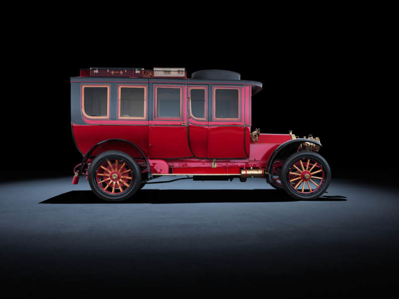
Techno Classica 2013: Mercedes-Simplex 60 PS aus dem Jahr 1904. Im Bild der elegante und luxuriöse Reisewagen aus dem persönlichen Besitz von Emil Jellinek.