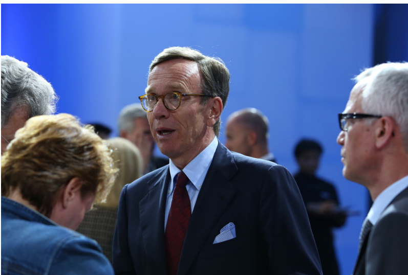
Shanghai 2013: Volkswagen Group Night: Matthias Wissmann. Shanghai 2013: Volkswagen Group Night: Matthias Wissmann.