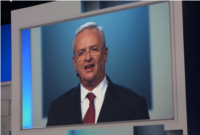
Shanghai 2013: Volkswagen Group Night: Prof. Dr. Martin Winterkorn.