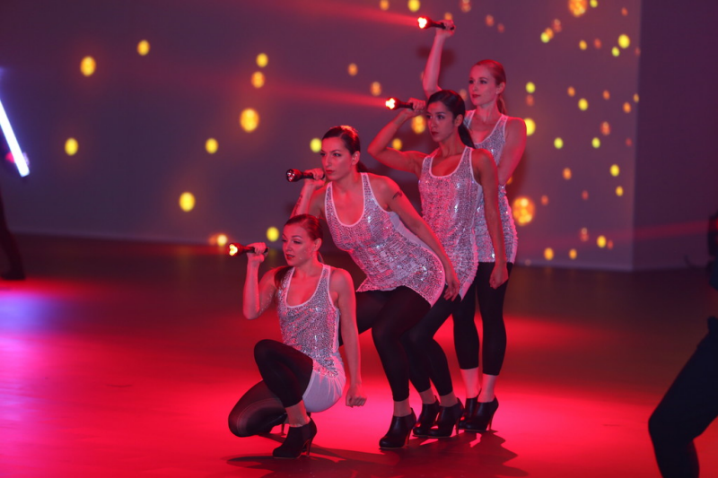
Shanghai 2013: Volkswagen Group Night.