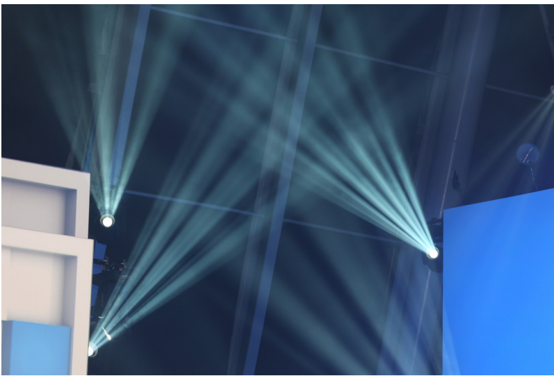
Shanghai 2013: Volkswagen Group Night.