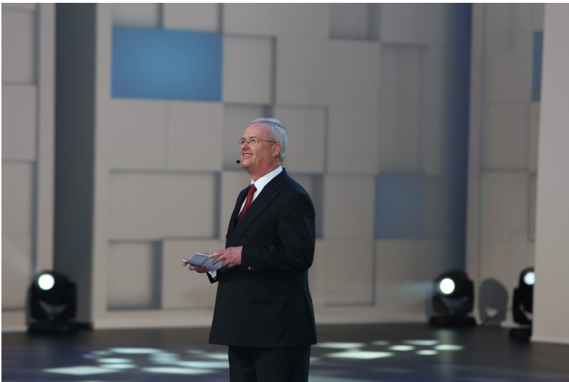
Shanghai 2013: Volkswagen Group Night: Prof. Dr. Martin Winterkorn.