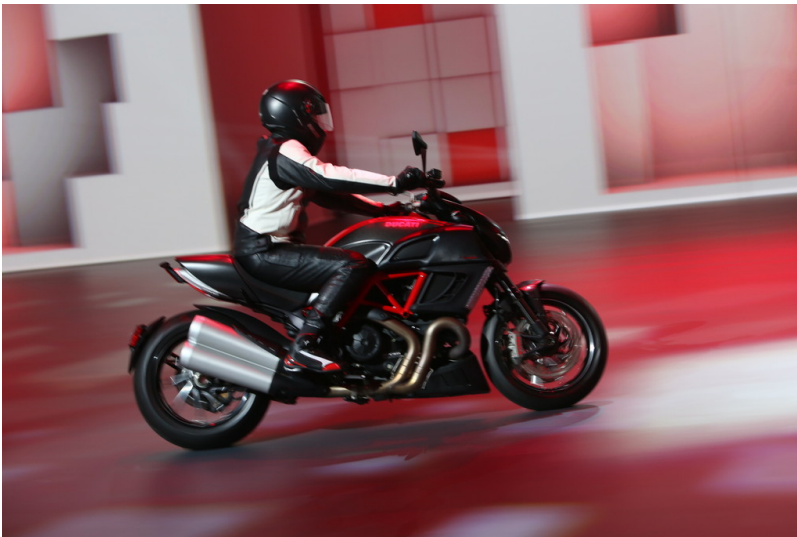
Shanghai 2013: Volkswagen Group Night: Ducati Diavel.