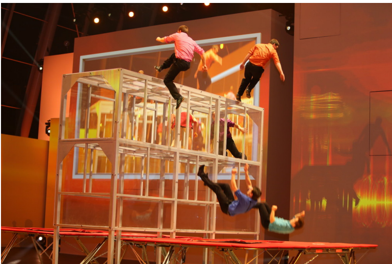
Shanghai 2013: Volkswagen Group Night. Shanghai 2013: Volkswagen Group Night.