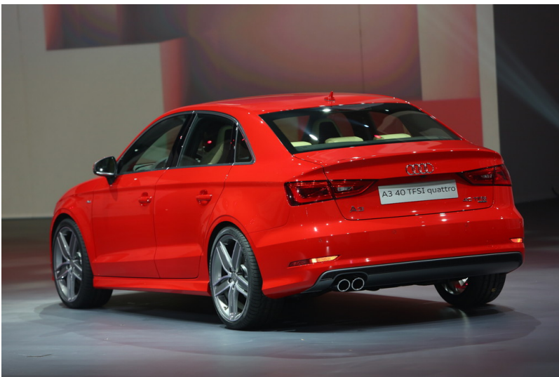
Shanghai 2013: Volkswagen Group Night: Audi A3 TFSI Quattro (Sedan). Shanghai 2013: Volkswagen Group Night: Seat Leon SC.