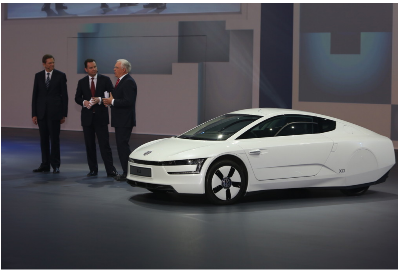
Shanghai 2013: Volkswagen Group Night: Volkswagen XL1.