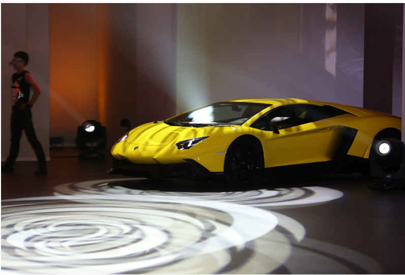
Shanghai 2013: Volkswagen Group Night: Lamborghini Aventador.