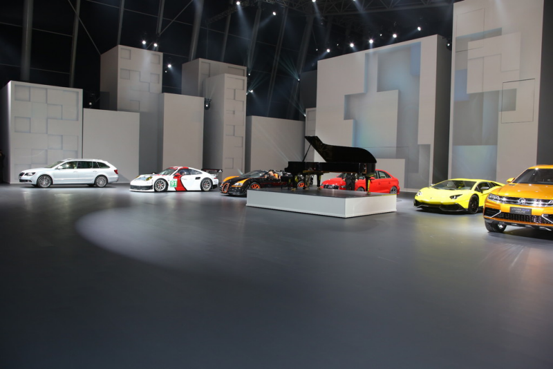
Shanghai 2013: Volkswagen Group Night.