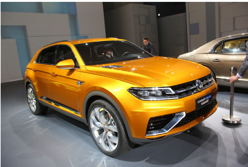
Shanghai 2013: Volkswagen Group Night: Volkswagen Concept Cross Blue Coupé. Shanghai 2013: Volkswagen Group Night: Volkswagen Concept Cross Blue Coupé.