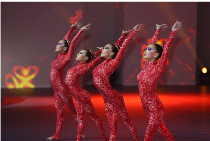
Shanghai 2013: Volkswagen Group Night. Shanghai 2013: Volkswagen Group Night.