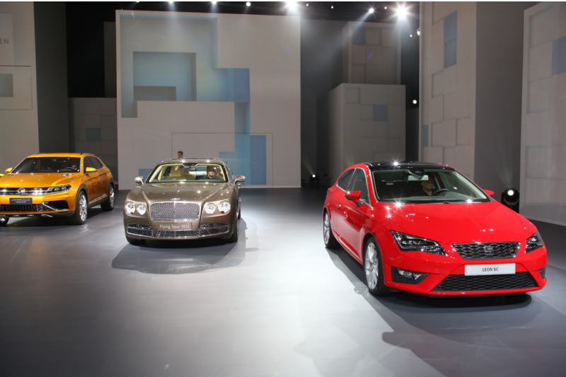
Shanghai 2013: Volkswagen Group Night.