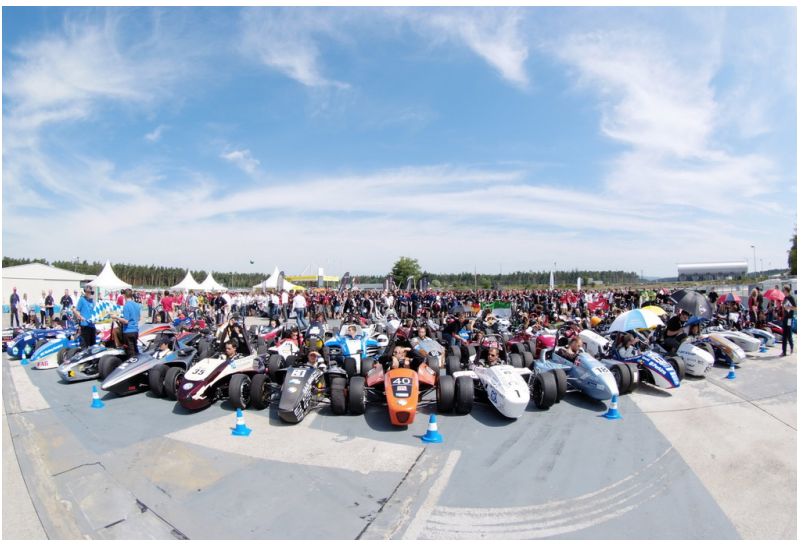
Formula Student Germany 2013.