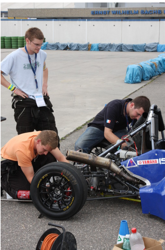
Formula Student Germany 2013. Formula Student Germany 2013.