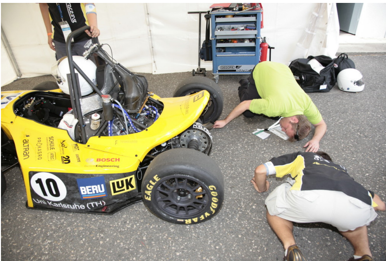
Formula Student Germany 2013. Formula Student Germany 2013.