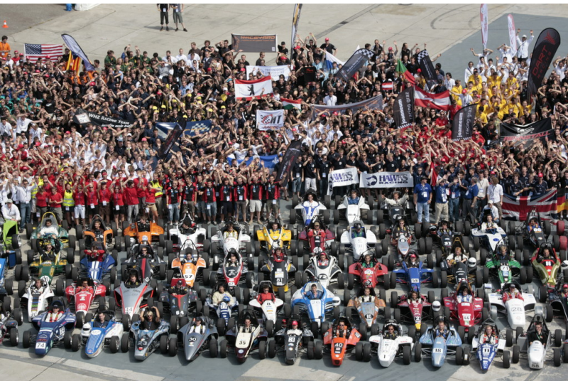
Formula Student Germany 2013.