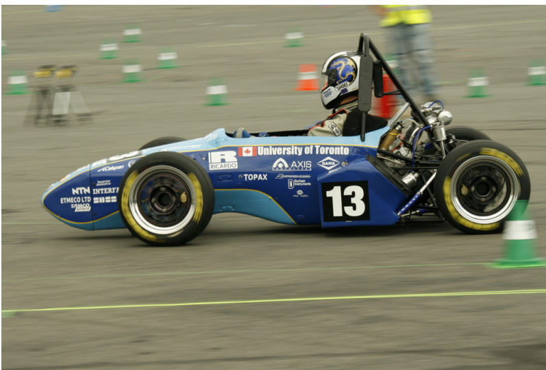
Formula Student Germany 2013.