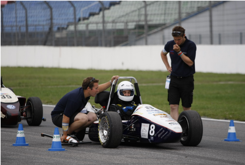
Formula Student Germany 2013.