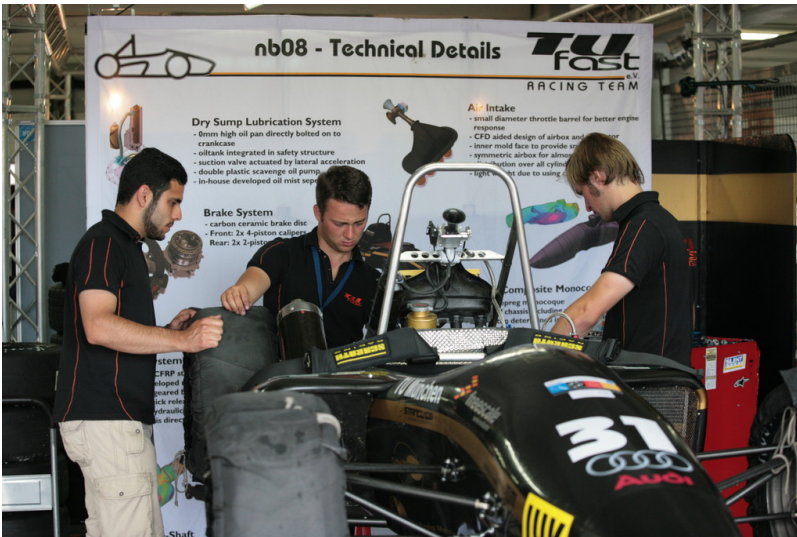
Formula Student Germany 2013. Formula Student Germany 2013.