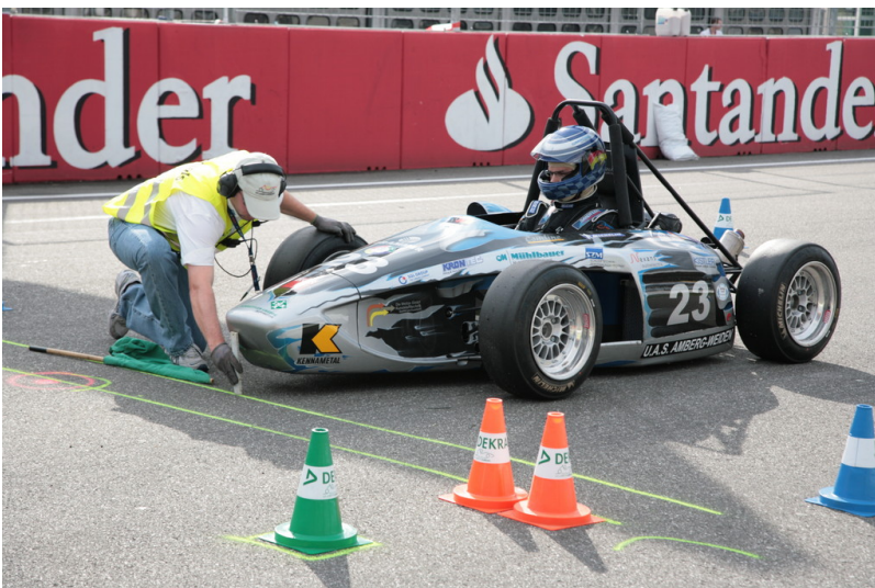
Formula Student Germany 2013.