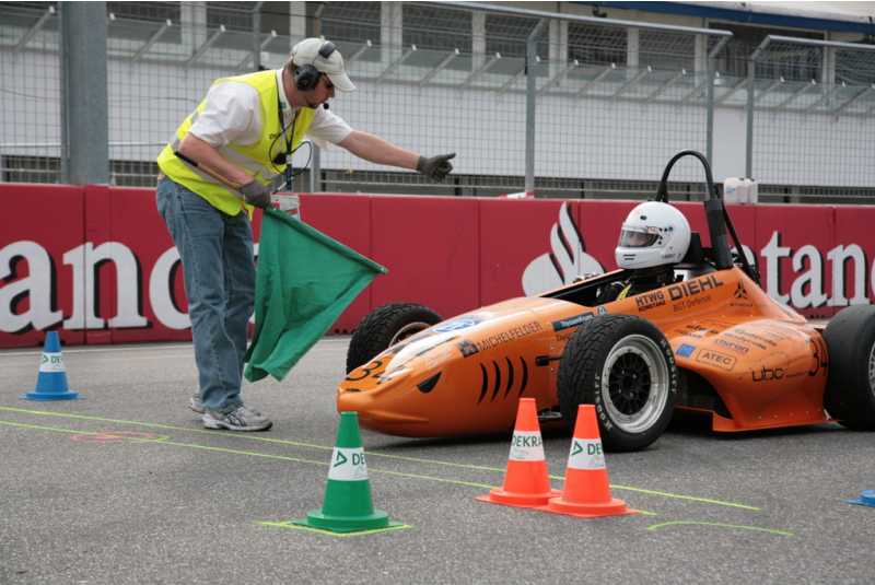
Formula Student Germany 2013.