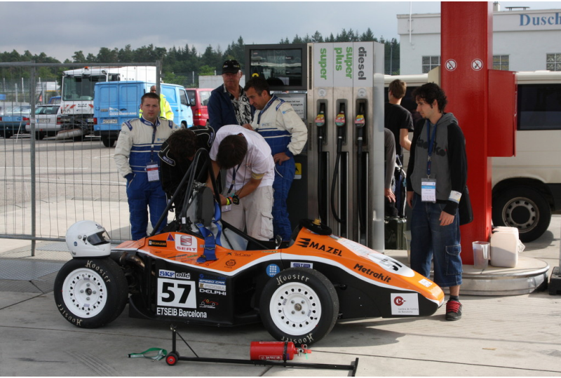
Formula Student Germany 2013.