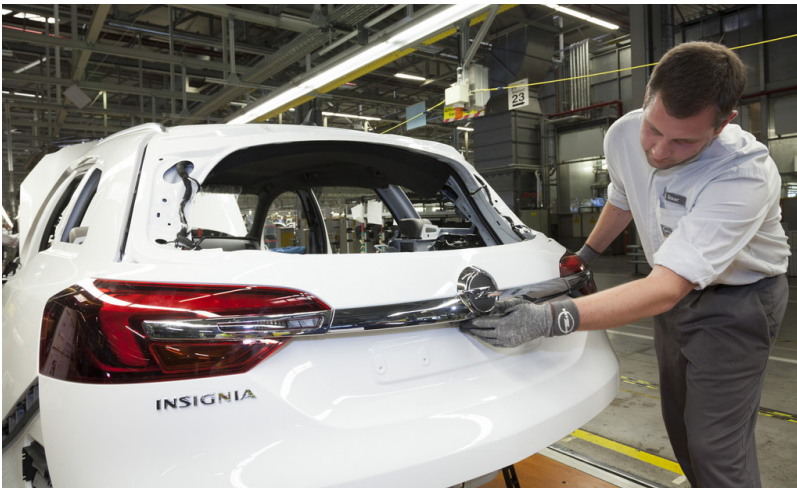
Produktionsstart Opel Insignia in Rüsselsheim.