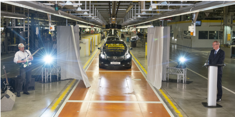
Produktionsstart Opel Insignia in Rüsselsheim. Produktionsstart Opel Insignia in Rüsselsheim.