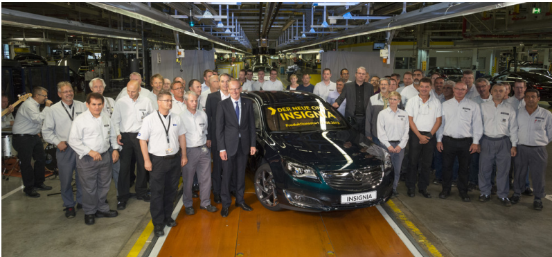
Produktionsstart Opel Insignia in Rüsselsheim.