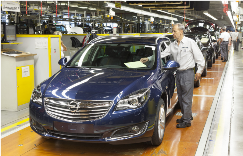
Produktionsstart Opel Insignia in Rüsselsheim.