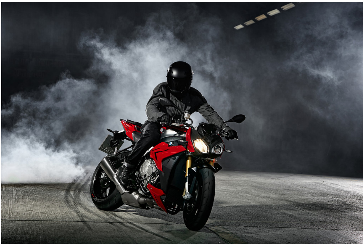
BMW S 1000 R.