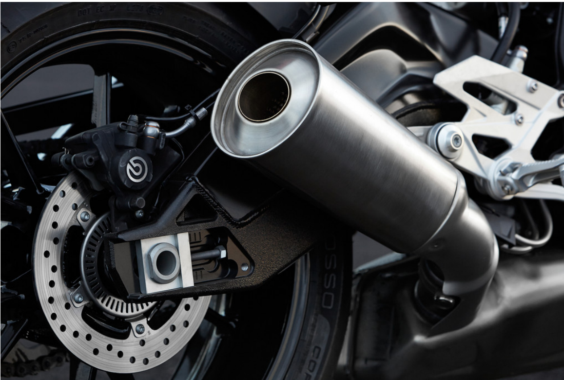
BMW S 1000 R.