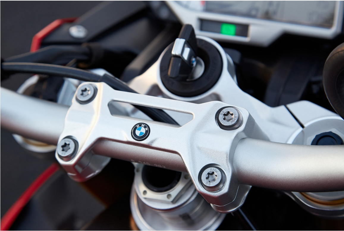
BMW S 1000 R.