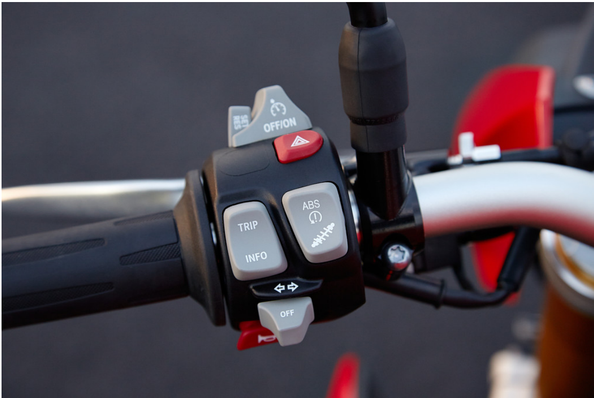
BMW S 1000 R.