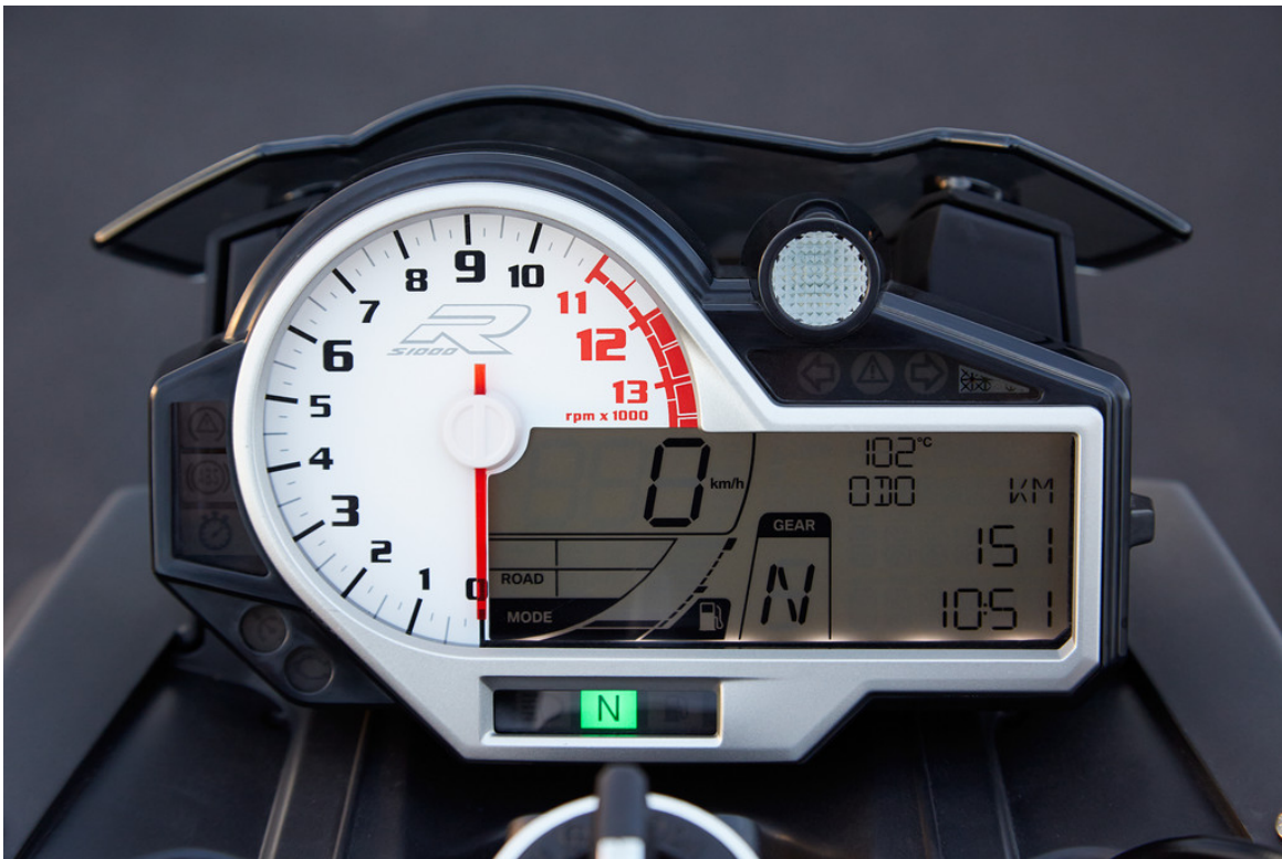
BMW S 1000 R.