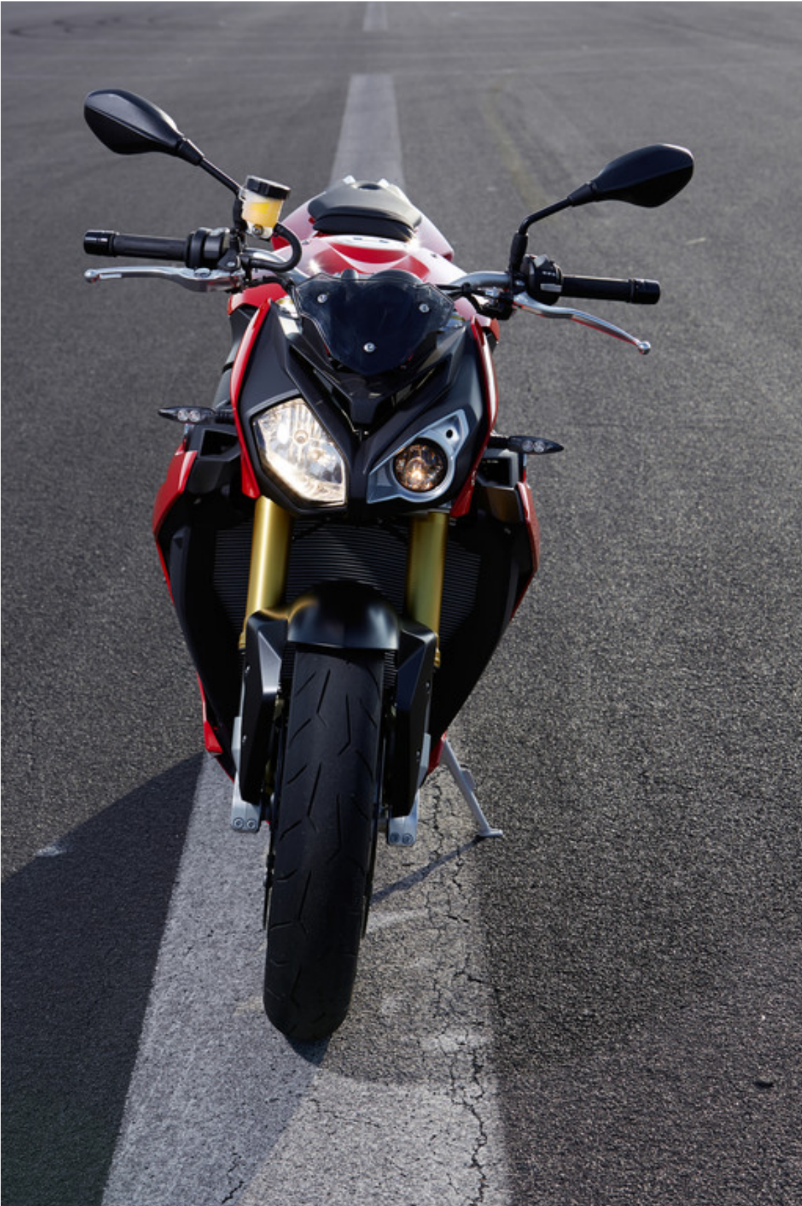
BMW S 1000 R.