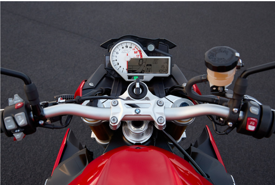
BMW S 1000 R.