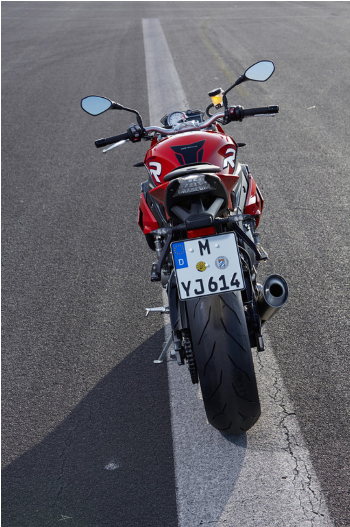
BMW S 1000 R.