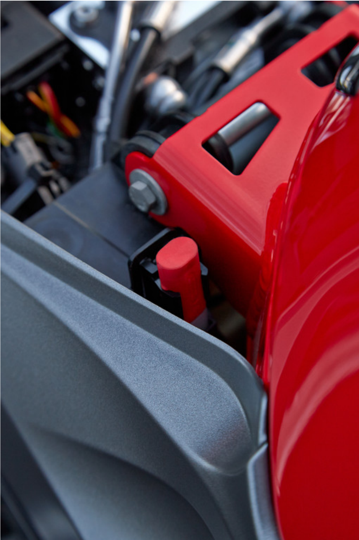
BMW S 1000 R.