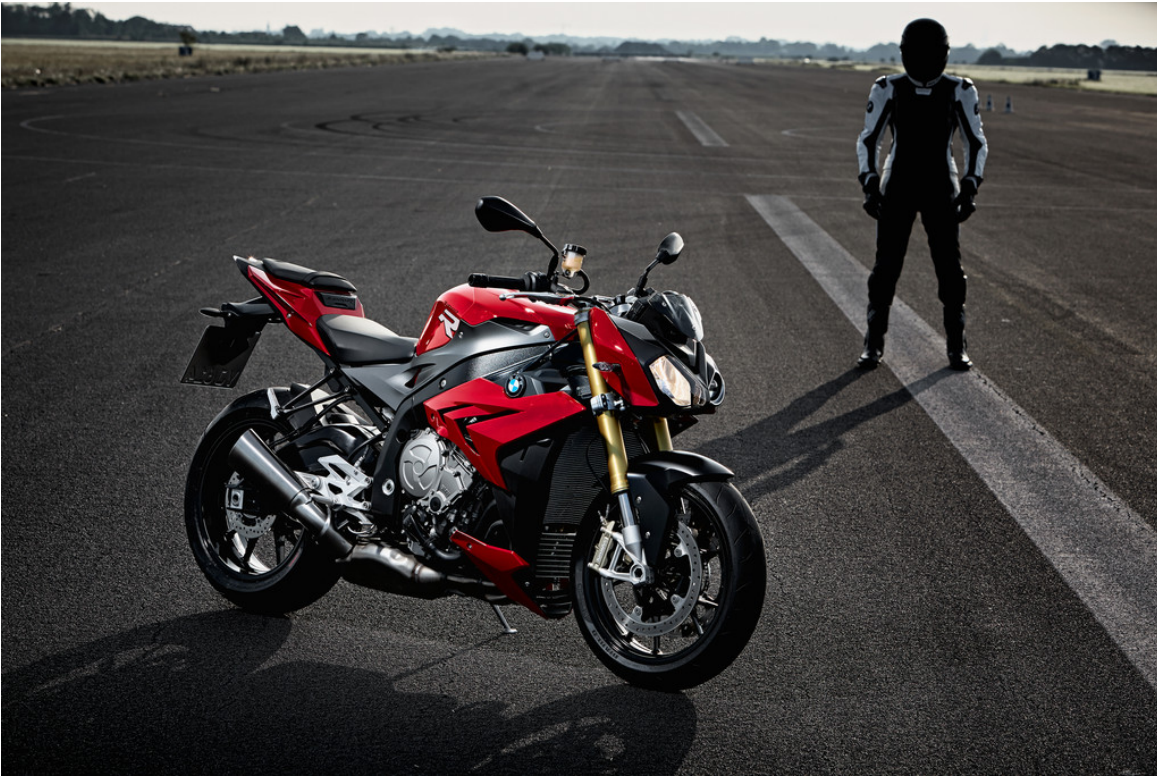
BMW S 1000 R.