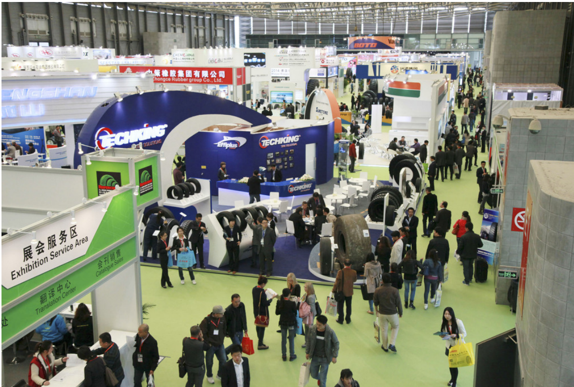
Reifen China 2013.