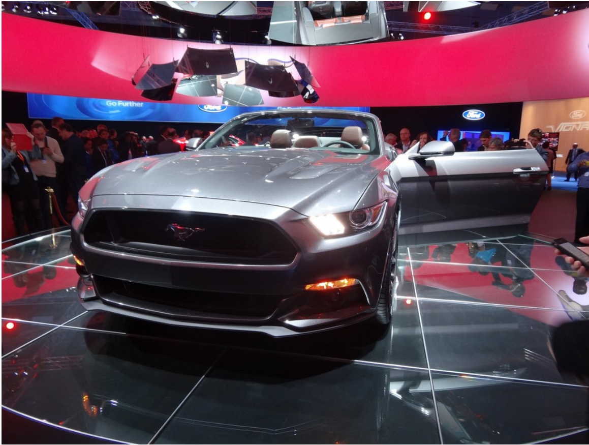
Ford Mustang Cabrio.