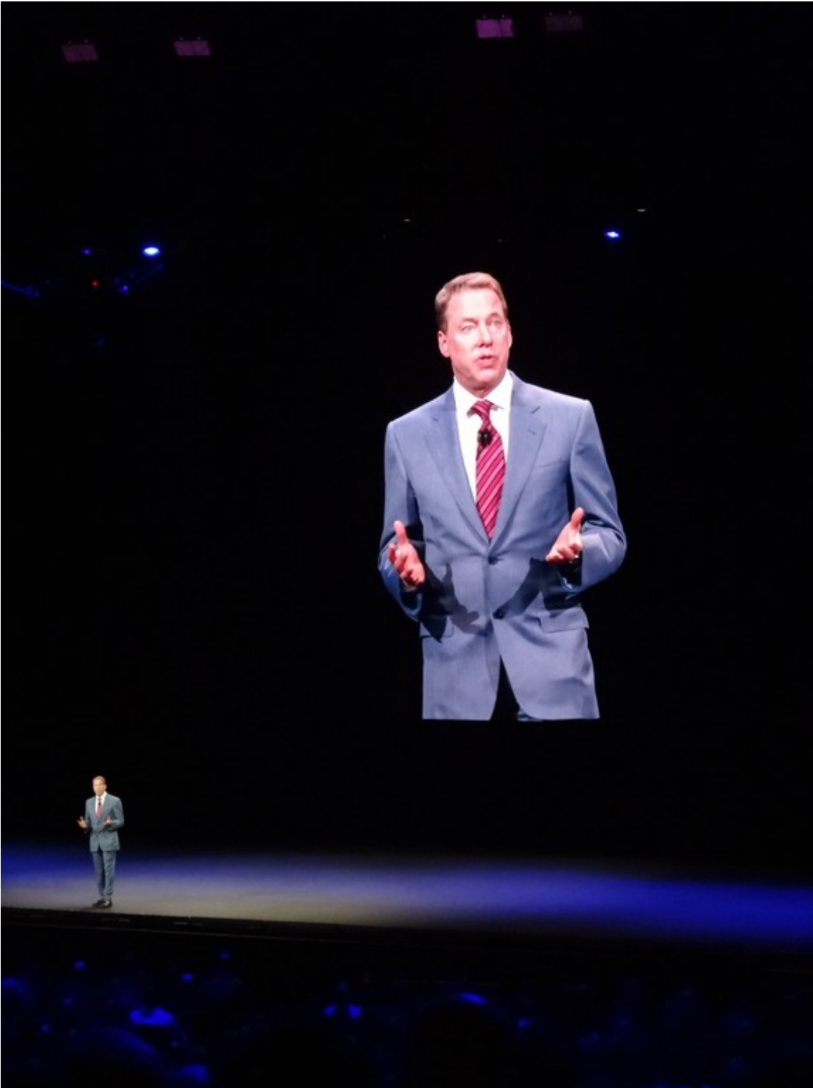
Ford blickt in die Zukunft: Bill Ford als David und Goliath.