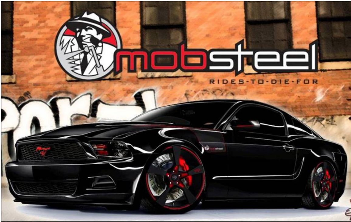
Ford Mustang von Raceskinz bei der SEMA in Las Vegas: