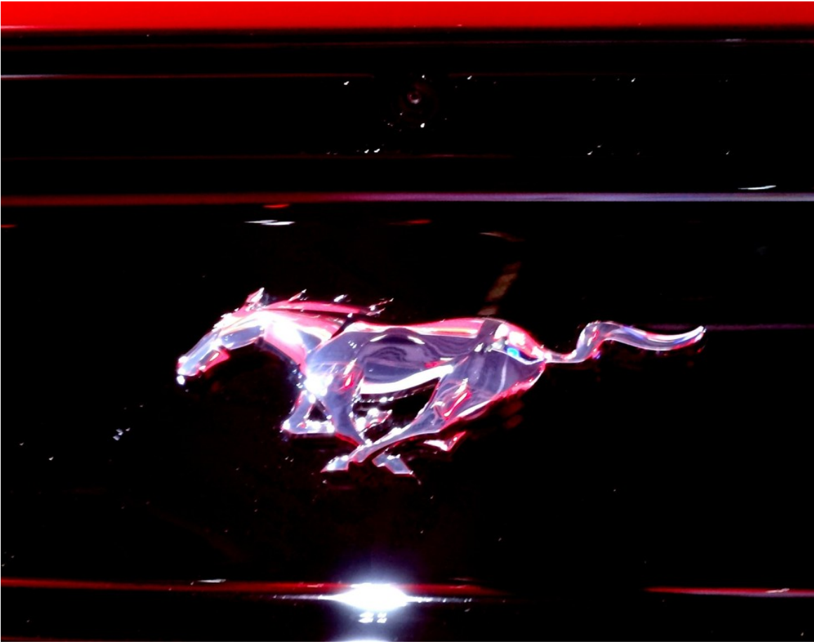
Ford Mustang CoupÃ©.