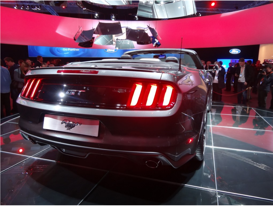
Ford Mustang Cabrio.