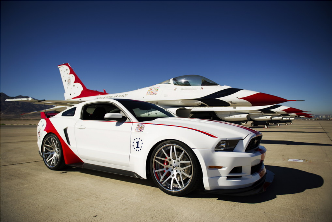
Ford Mustang GT "U.S. Air Force Thunderbirds Edition 2014".