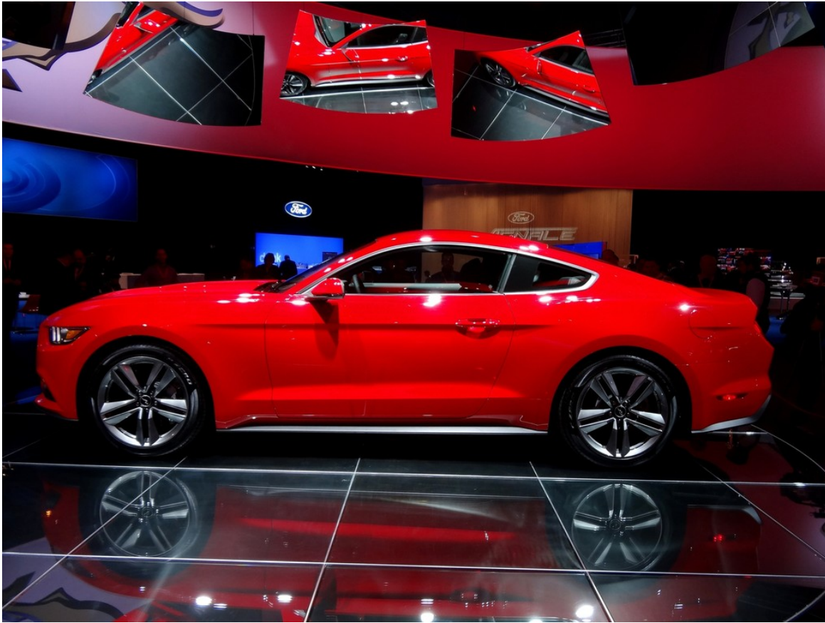
Ford Mustang Coupé©.