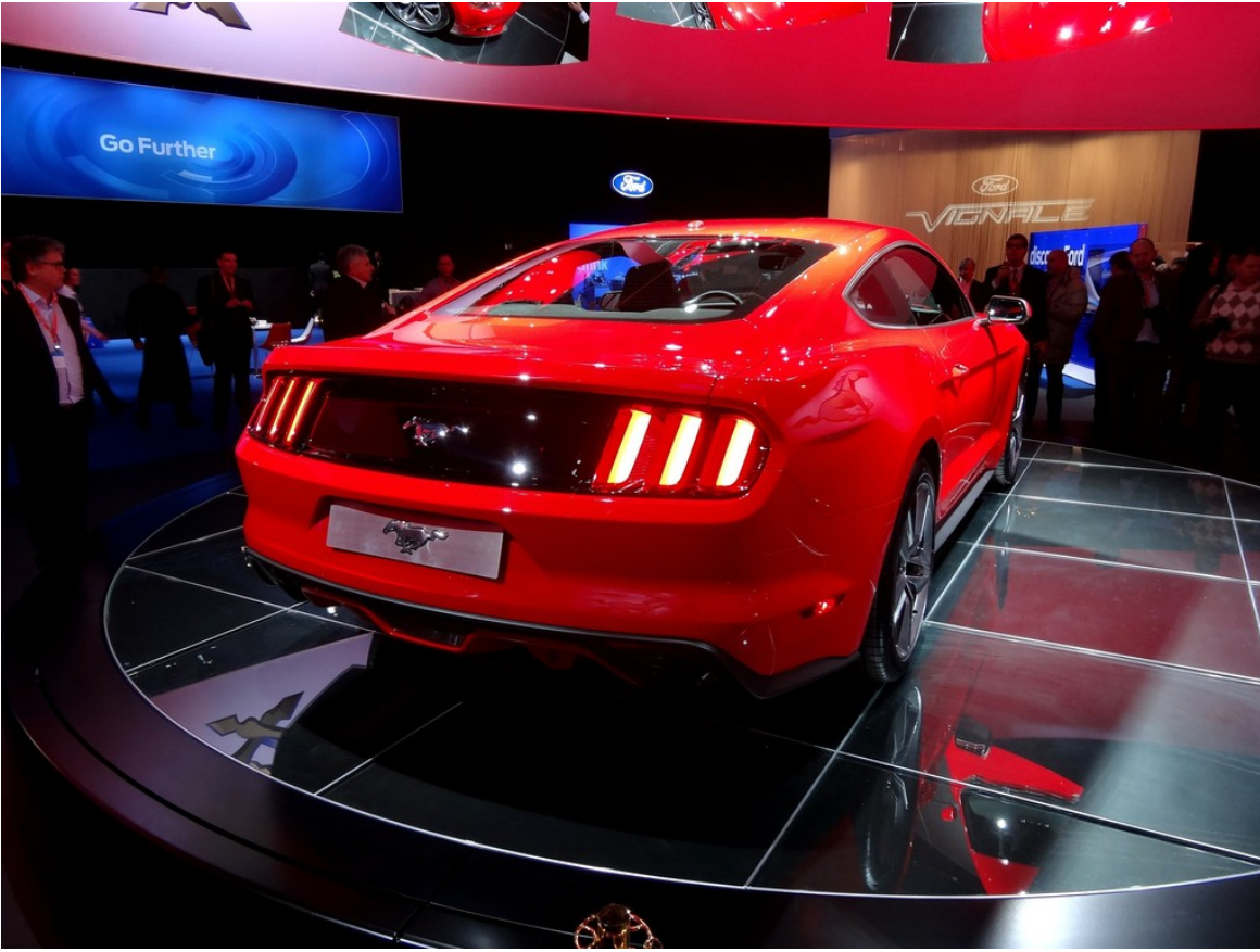
Ford Mustang Coupé©.