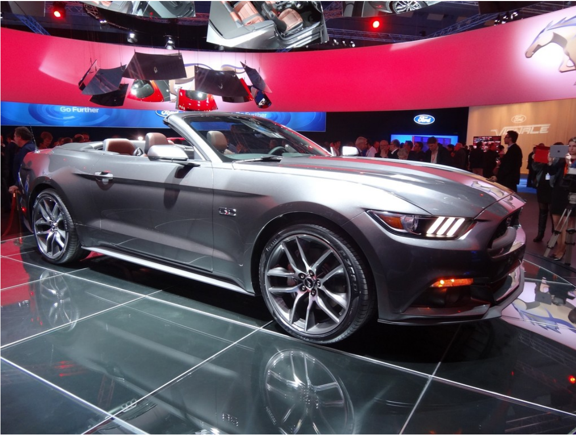
Ford Mustang Cabrio.