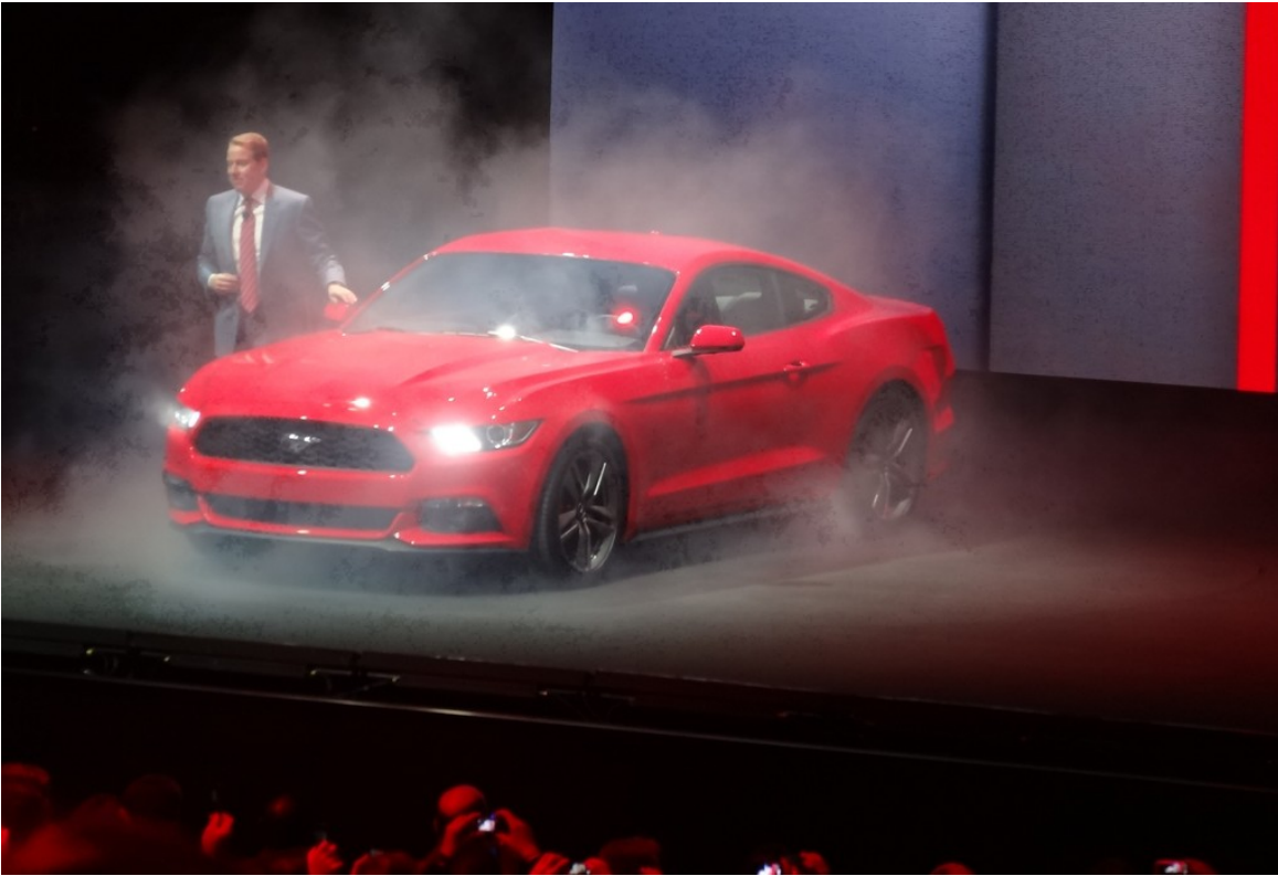
Ford blickt in die Zukunft: Bill Ford und der Ford Mustang im Ã¼blichen BÃ¼hnennebel.