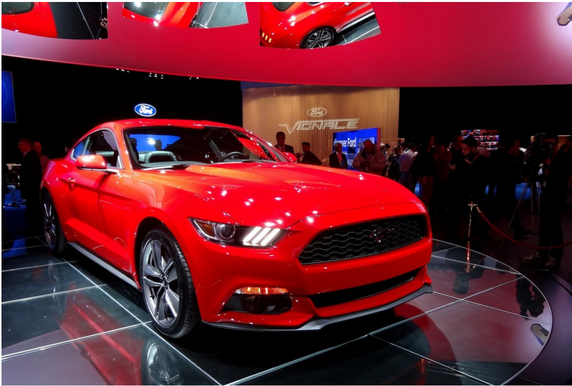
Ford Mustang Coup ©.