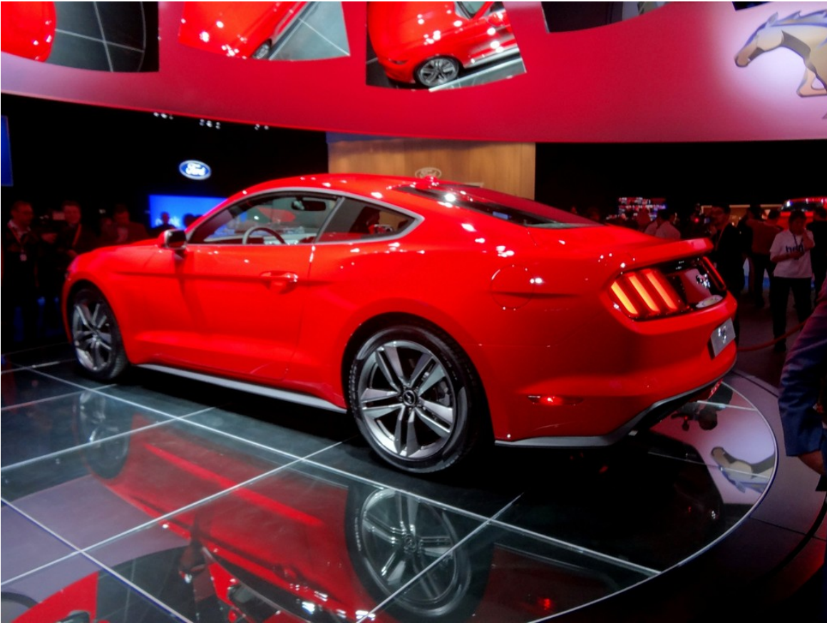
Ford Mustang Coup ©.