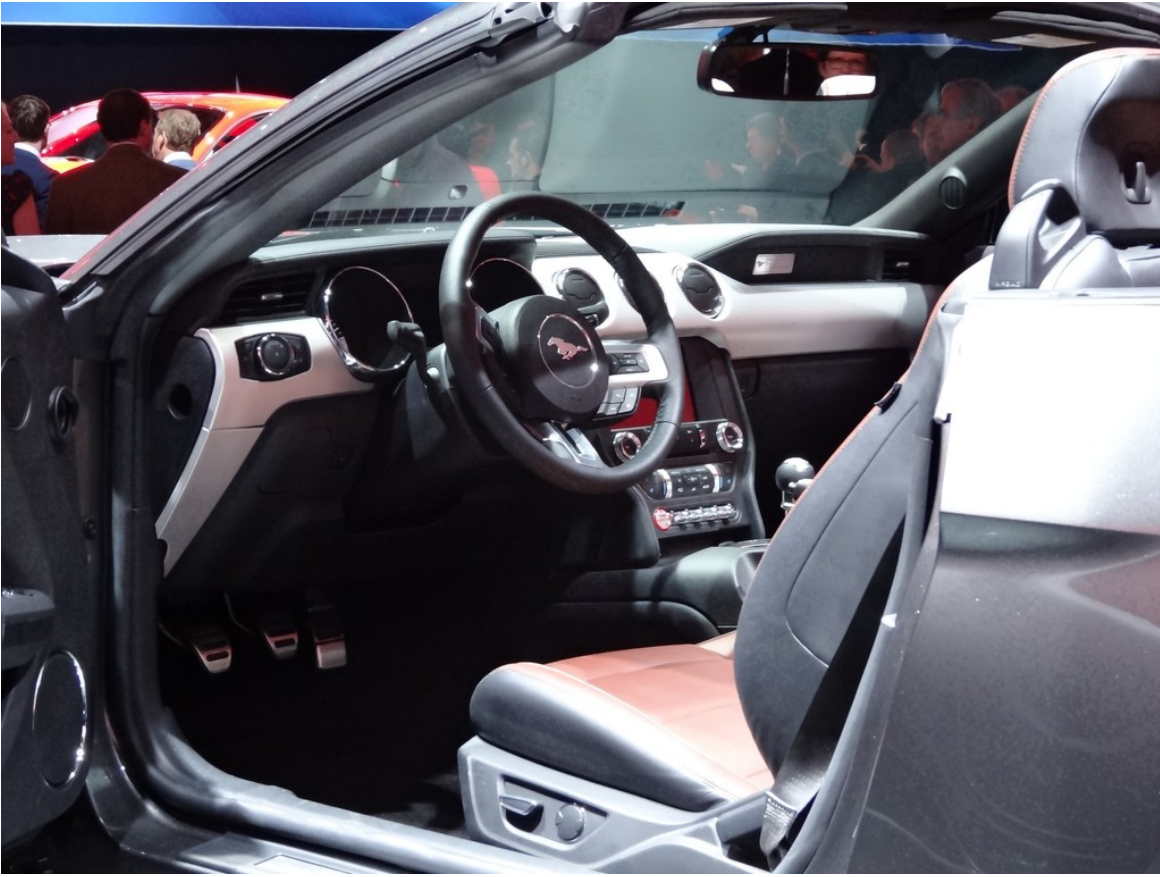
Ford Mustang Cabrio.