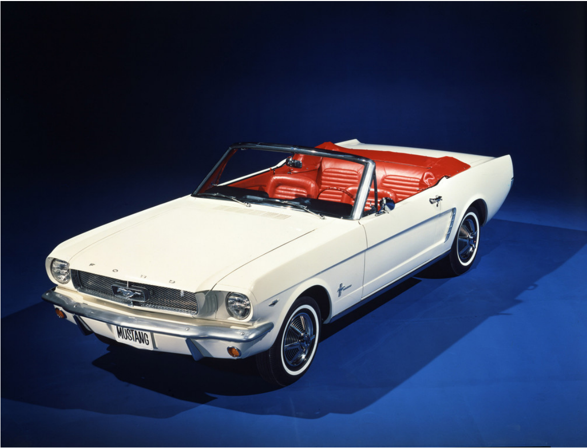
Ford Mustang Cabrio (1964).