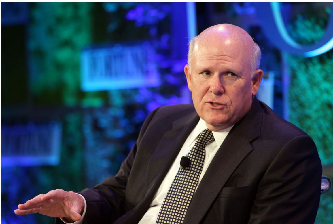
Daniel (Dan) Akerson.