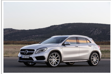
Mercedes-Benz GLA 45 AMG.