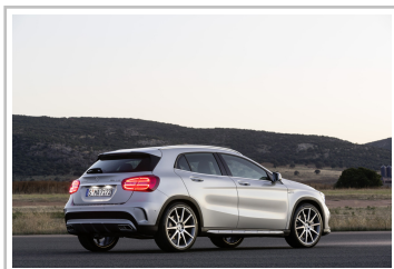
Mercedes-Benz GLA 45 AMG.