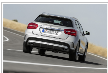
Mercedes-Benz GLA 45 AMG.