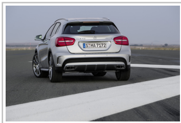
Mercedes-Benz GLA 45 AMG.