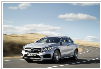
Mercedes-Benz GLA 45 AMG.