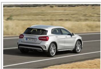
Mercedes-Benz GLA 45 AMG.