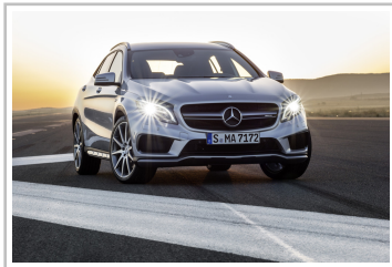
Mercedes-Benz GLA 45 AMG.