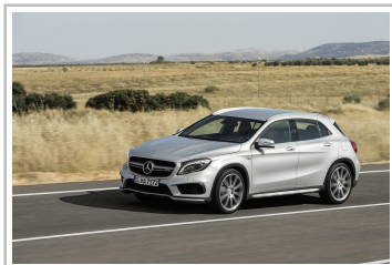
Mercedes-Benz GLA 45 AMG.