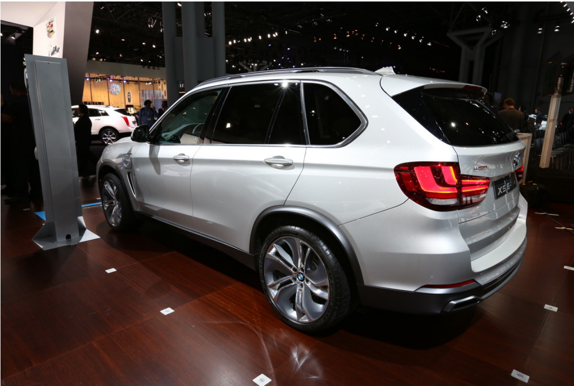
BMW, Concept, X5; eDrive