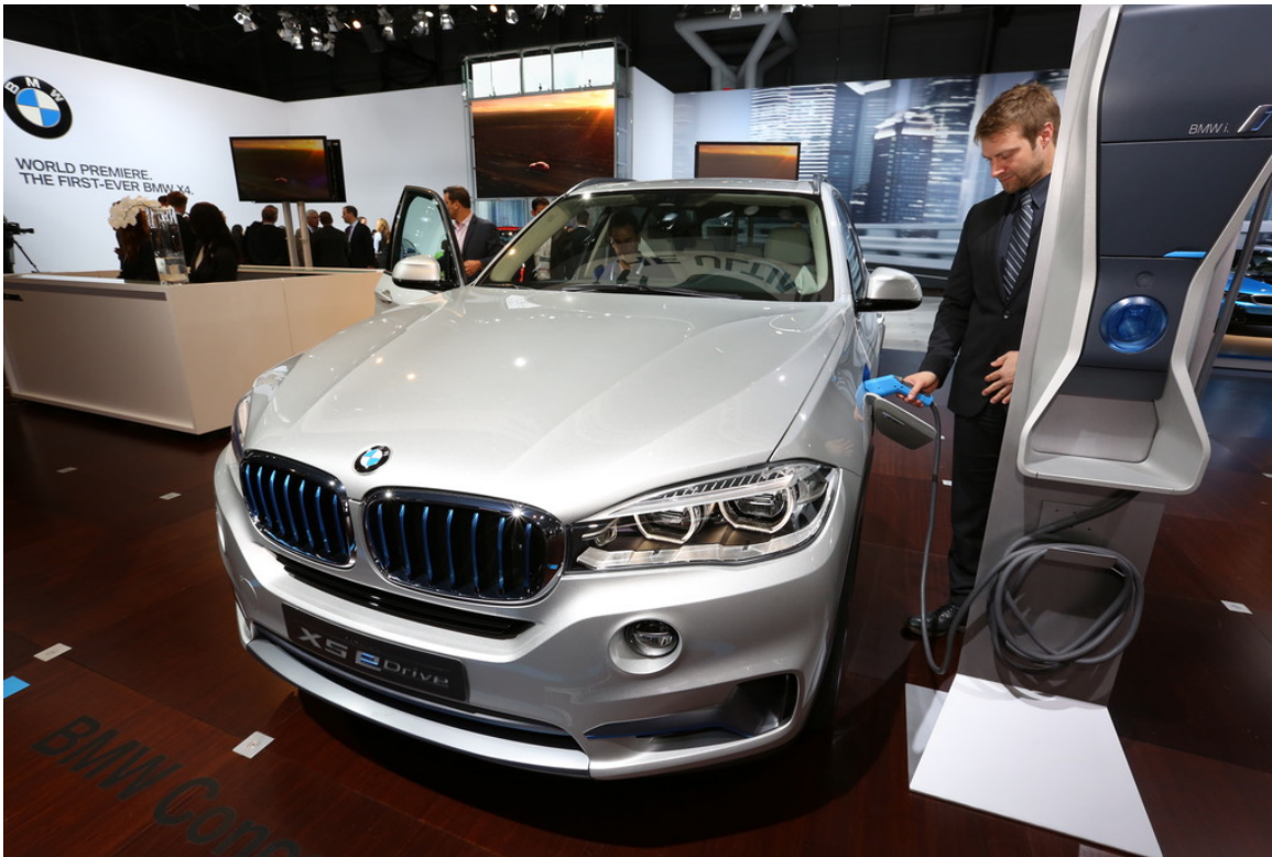
BMW, Concept, X5; eDrive