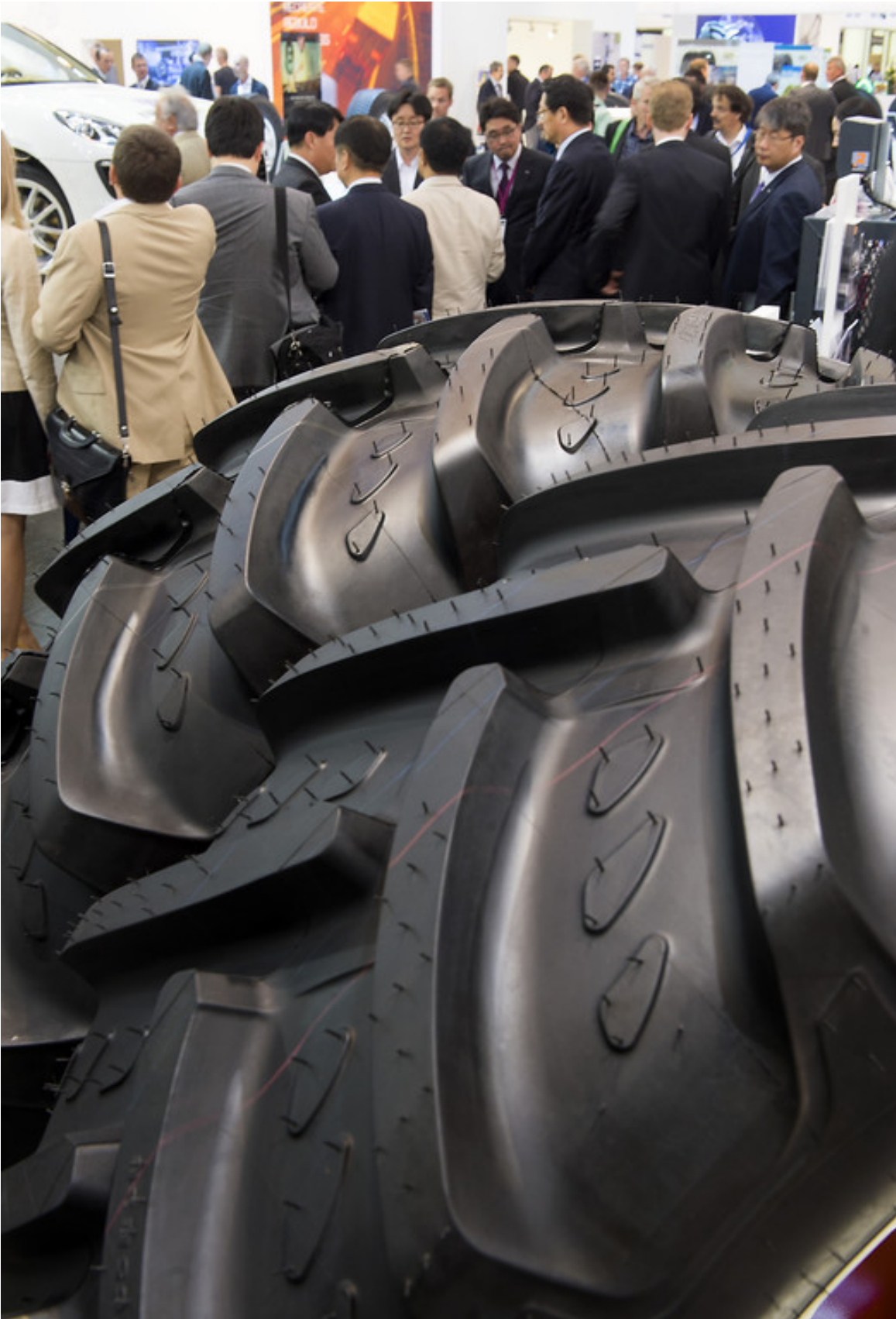
Messe „Reifen 2014“.