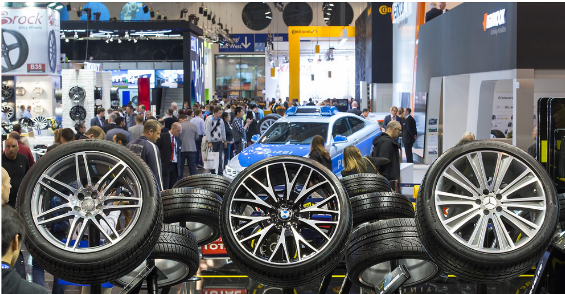
Messe „Reifen 2014“.