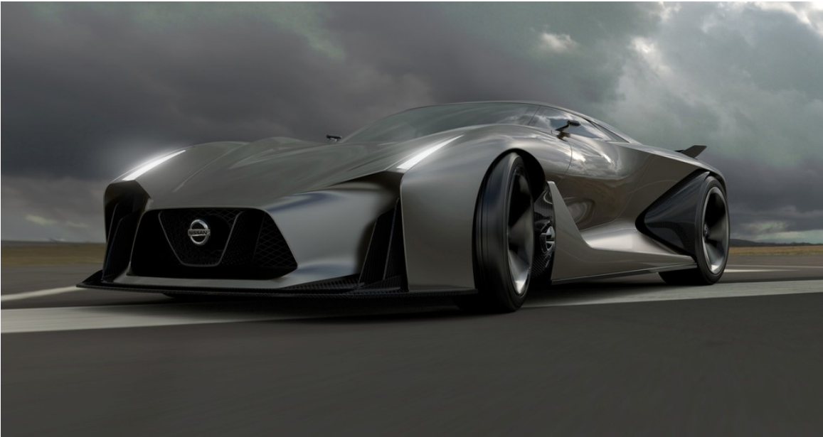
Nissan Concept 2020 Vision Gran Turismo.