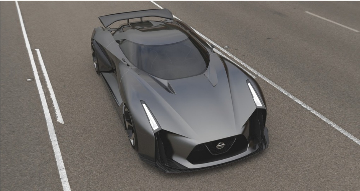
Nissan Concept 2020 Vision Gran Turismo.