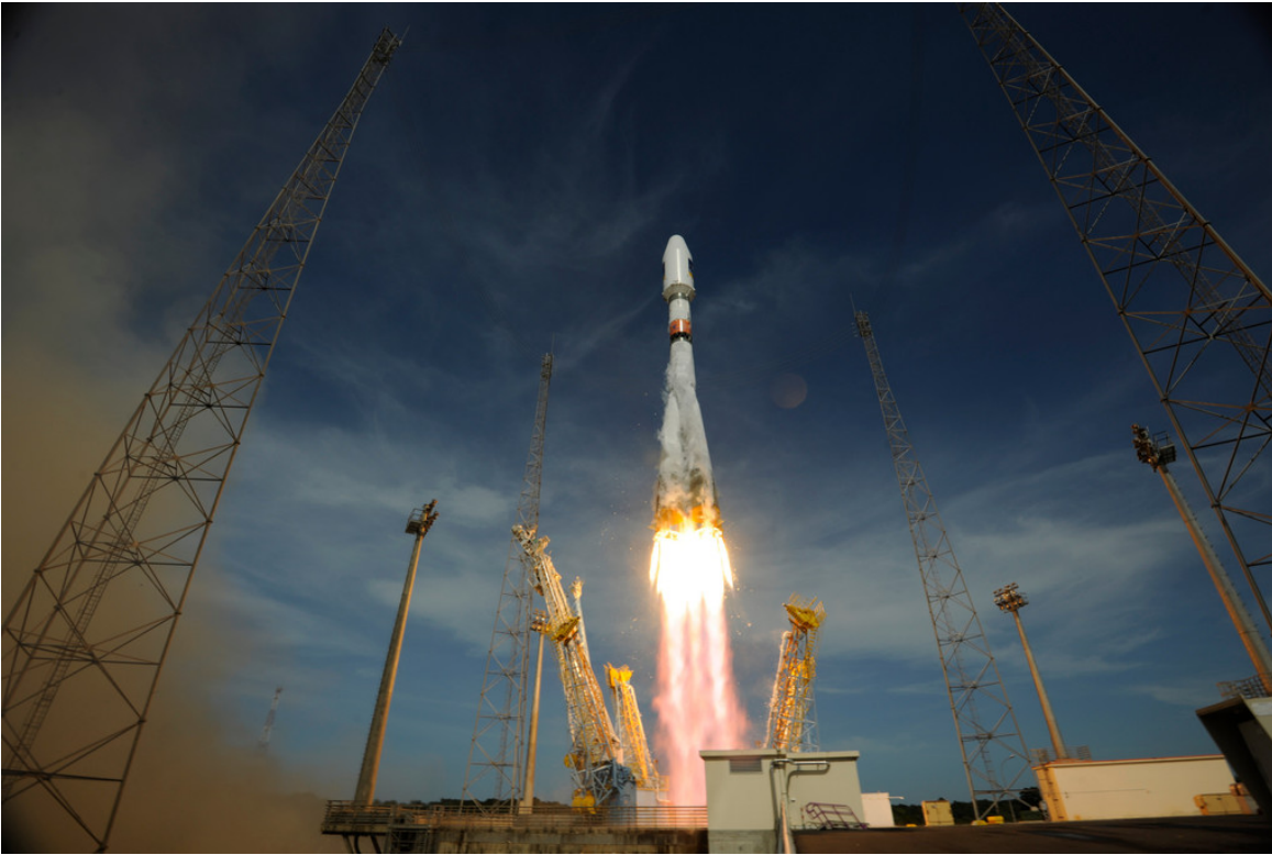
Der zweite Galileo-Start.