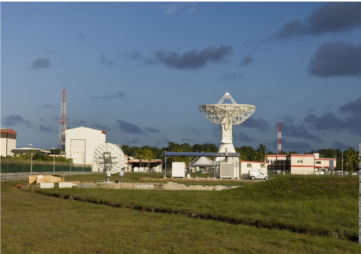
Die Station in Kourou.