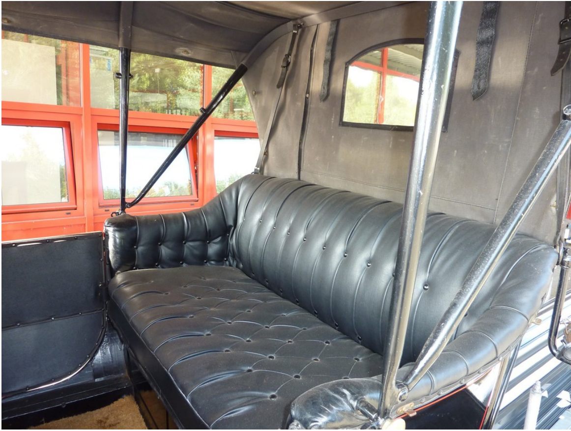
Ford Modell T Touring (1914).