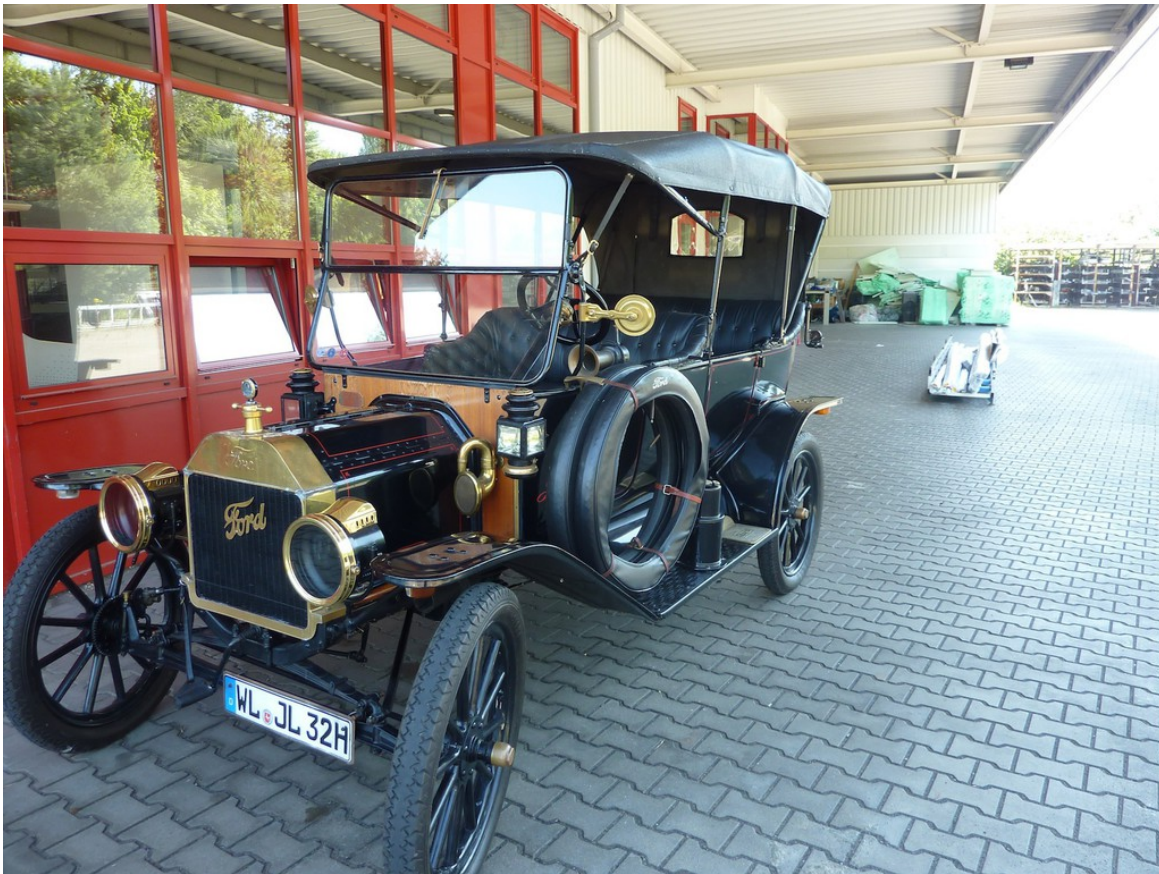
Ford Modell T Touring (1914).