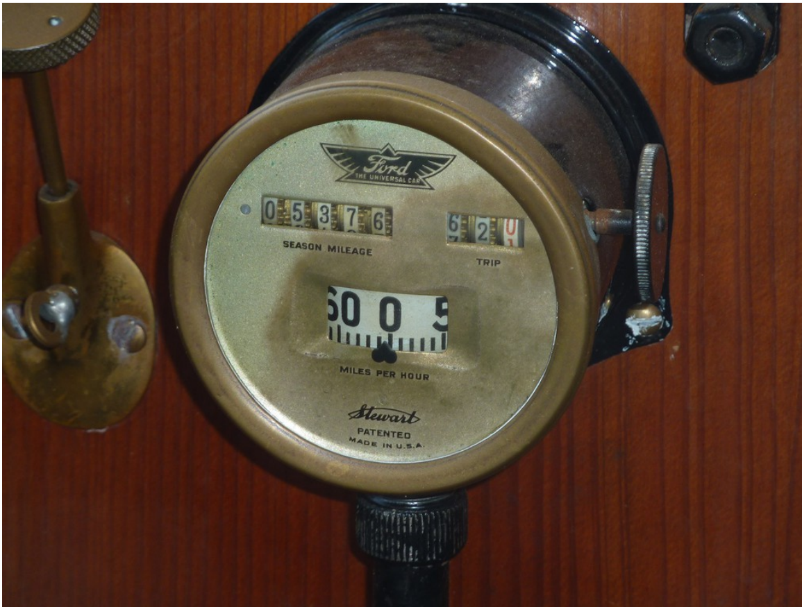
Ford Modell T Touring (1914).