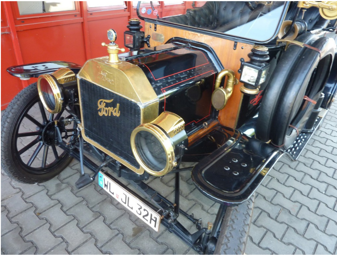
Ford Modell T Touring (1914).