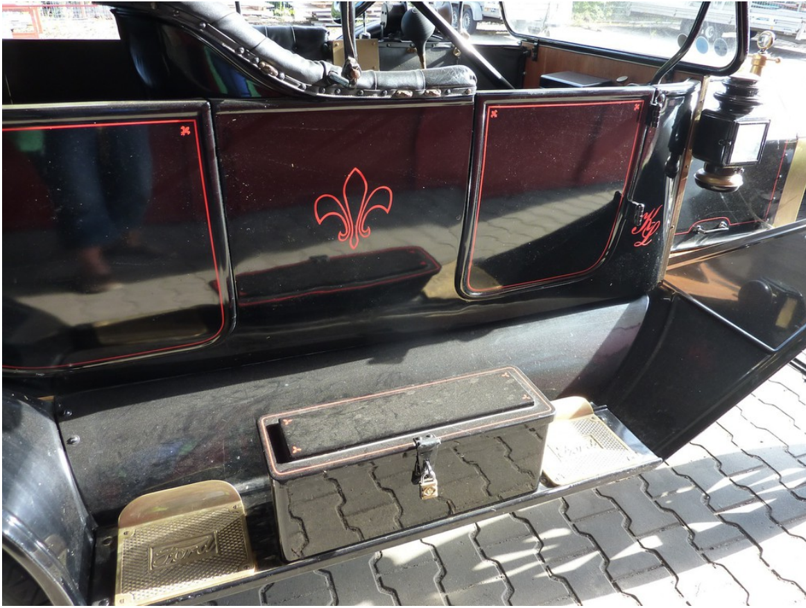
Ford Modell T Touring (1914).