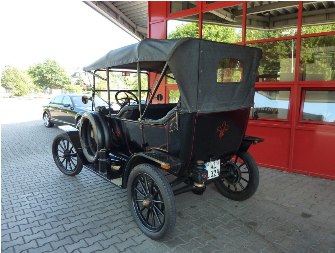
Ford Modell T Touring (1914).