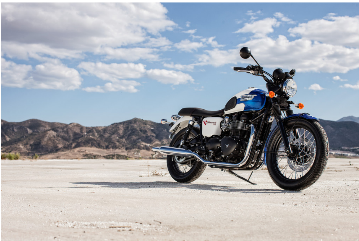
Triumph Bonneville T214.