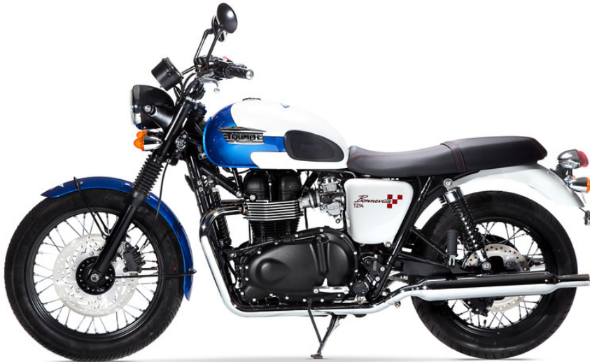
Triumph Bonneville T214.