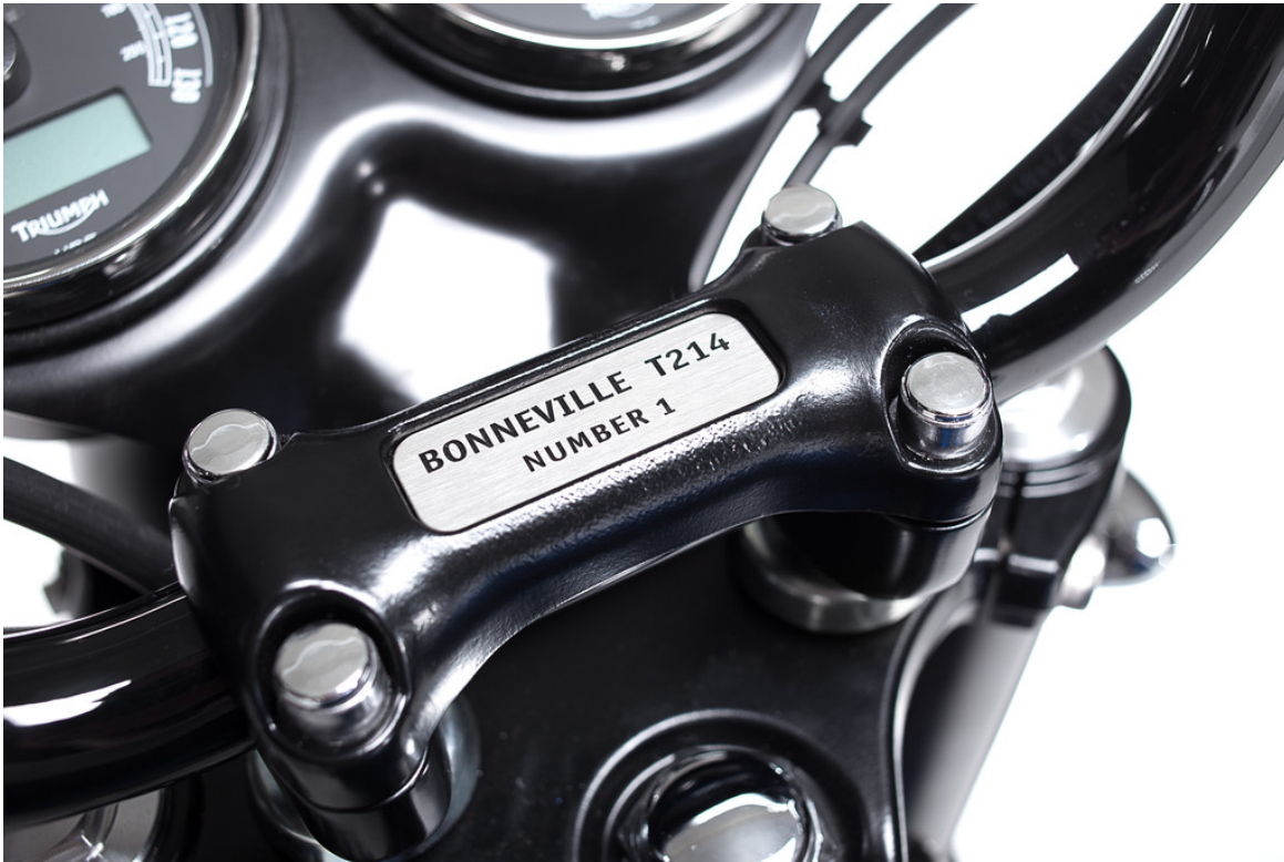
Triumph Bonneville T214.