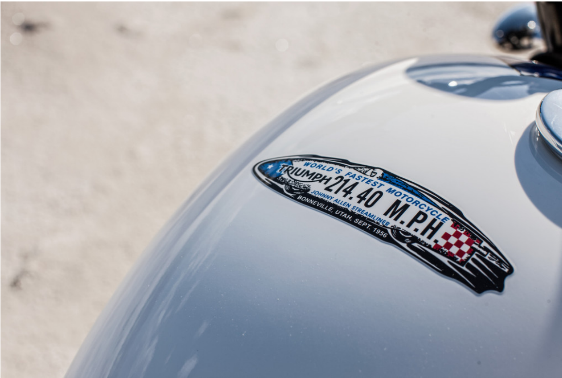
Triumph Bonneville T214.