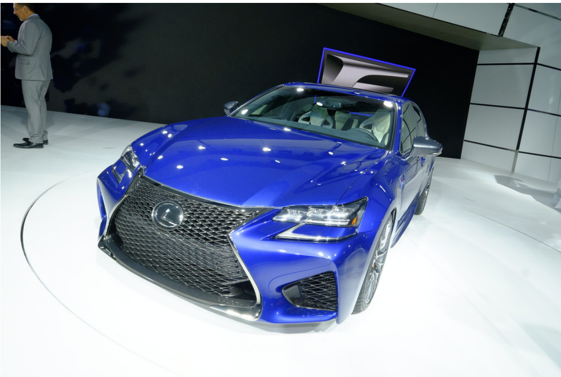
Lexus GS F.