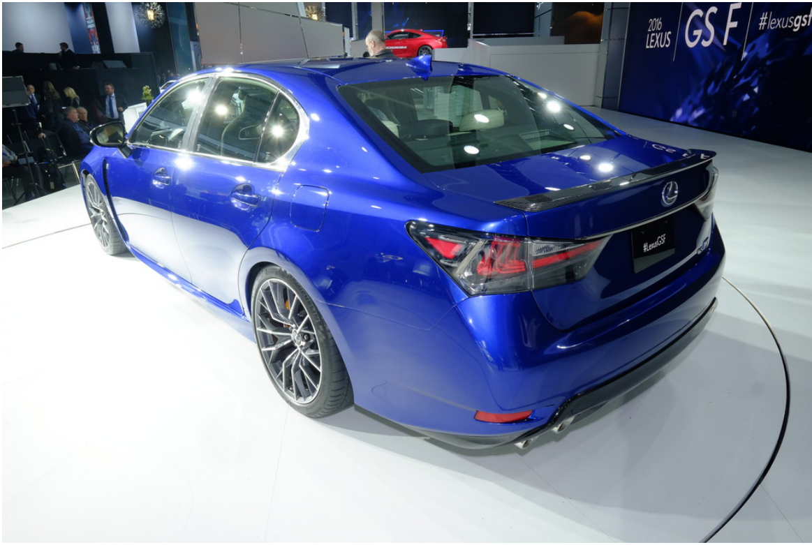
Lexus GS F.