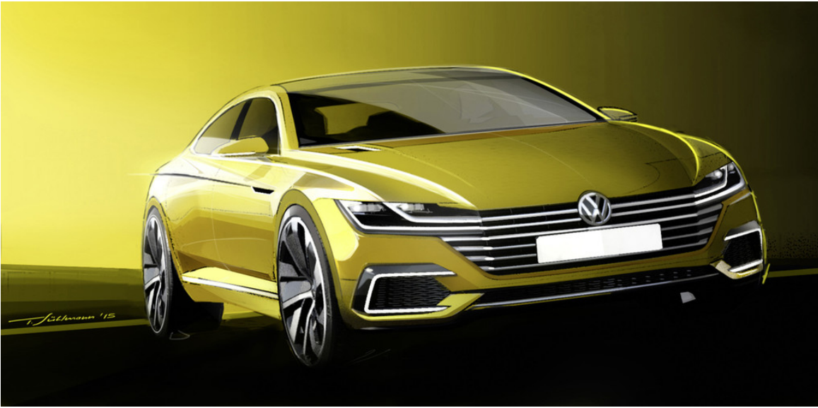
Volkswagen Sport Coupé Concept GTE.