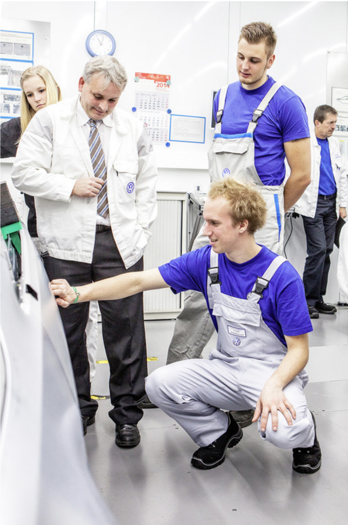
Auszubildenden des Projektteams „Wörthersee-GTI 2015“ im Werk Wolfsburg.