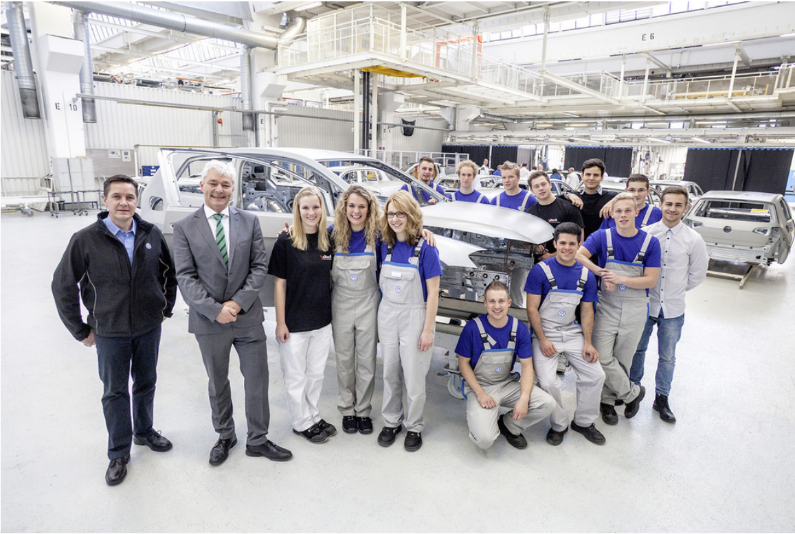
Auszubildenden des Projektteams „Wörthersee-GTI 2015“ im Werk Wolfsburg.