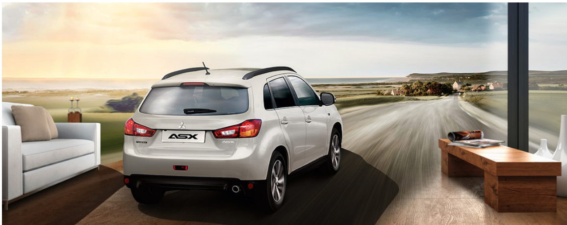
Virtuelle Probefahrt im Mitsubishi ASX.