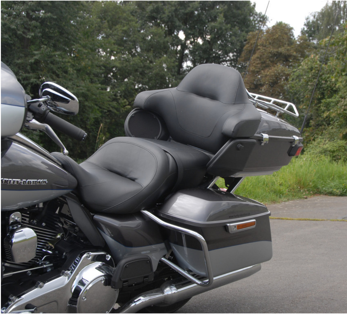
Harley-Davidson Electra Gilde Ultra Limited.