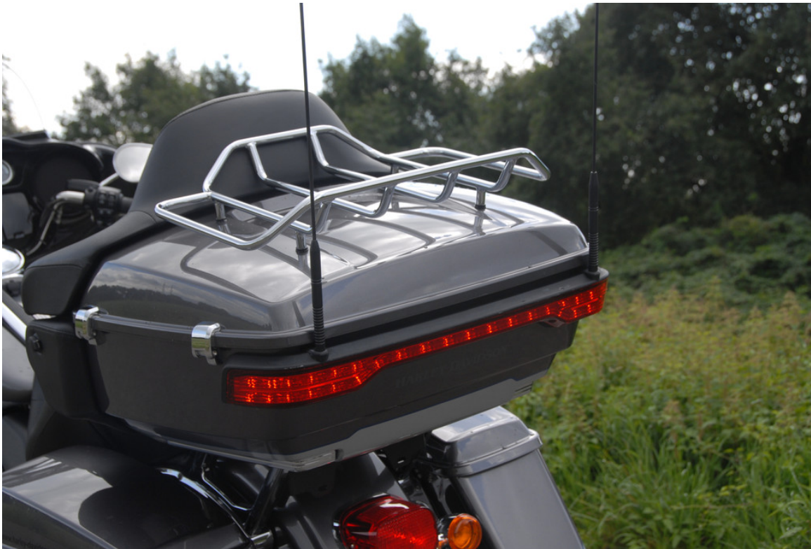
Harley-Davidson Electra Gilde Ultra Limited.