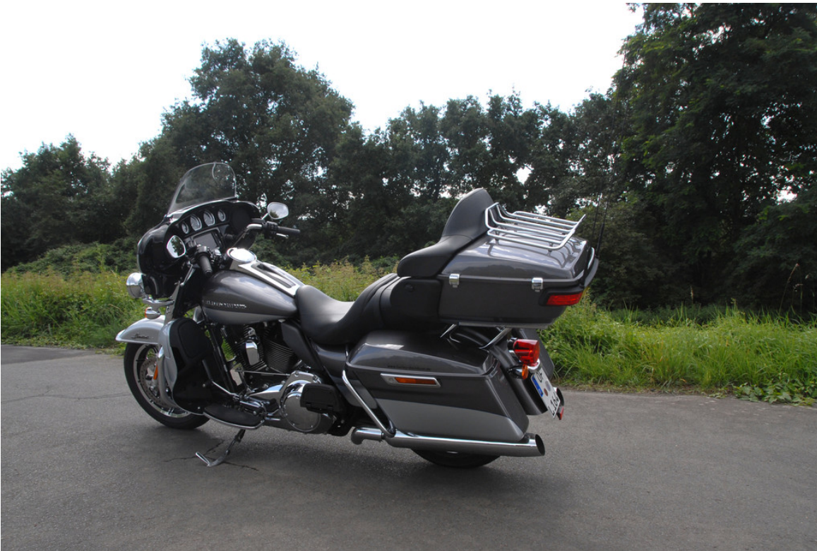
Harley-Davidson Electra Glide Ultra Limited.