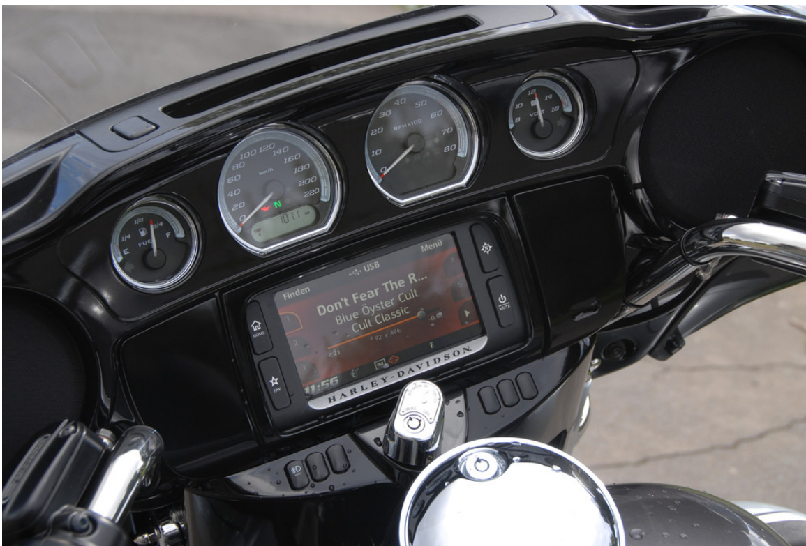
Harley-Davidson Electra Gilde Ultra Limited.