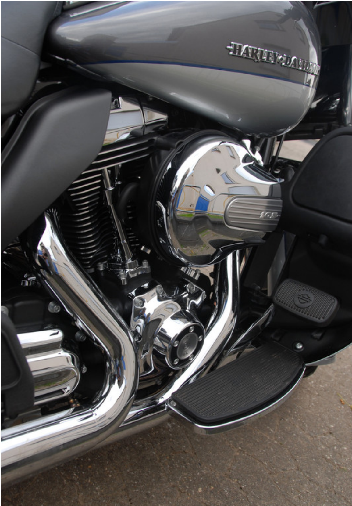
Harley-Davidson Electra Glide Ultra Limited.