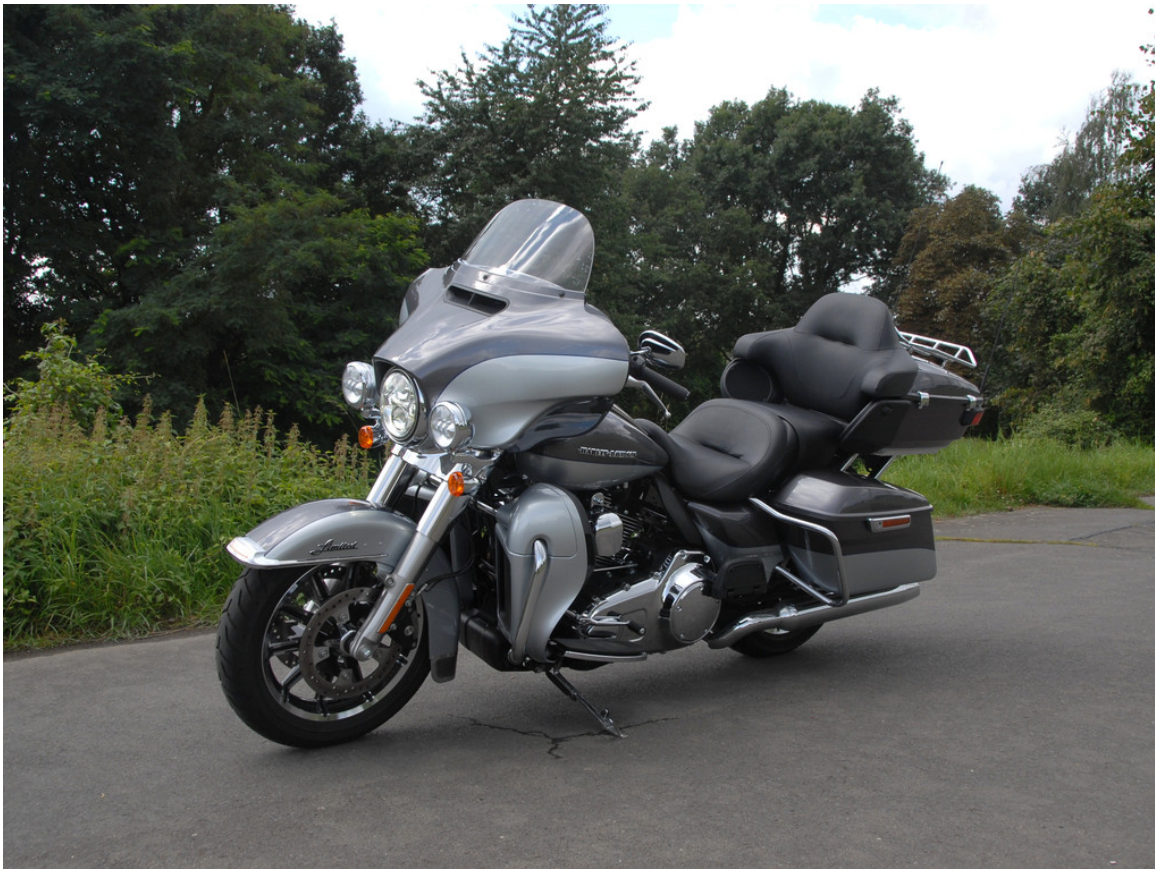
Harley-Davidson Electra Gilde Ultra Limited.