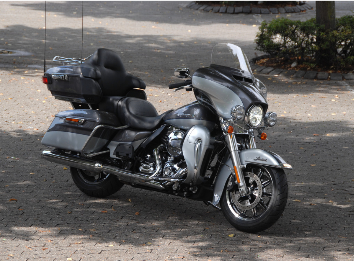
Harley-Davidson Electra Gilde Ultra Limited.