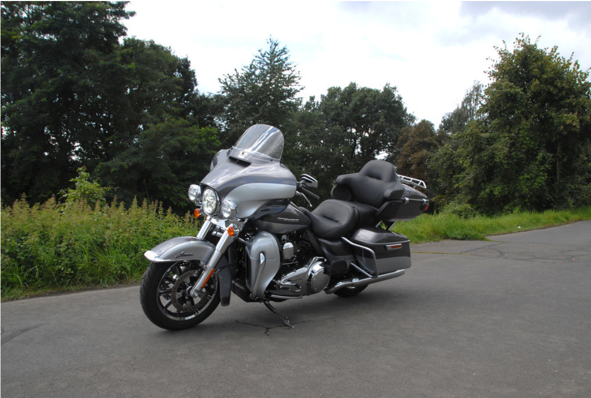
Harley-Davidson Electra Glide Ultra Limited.