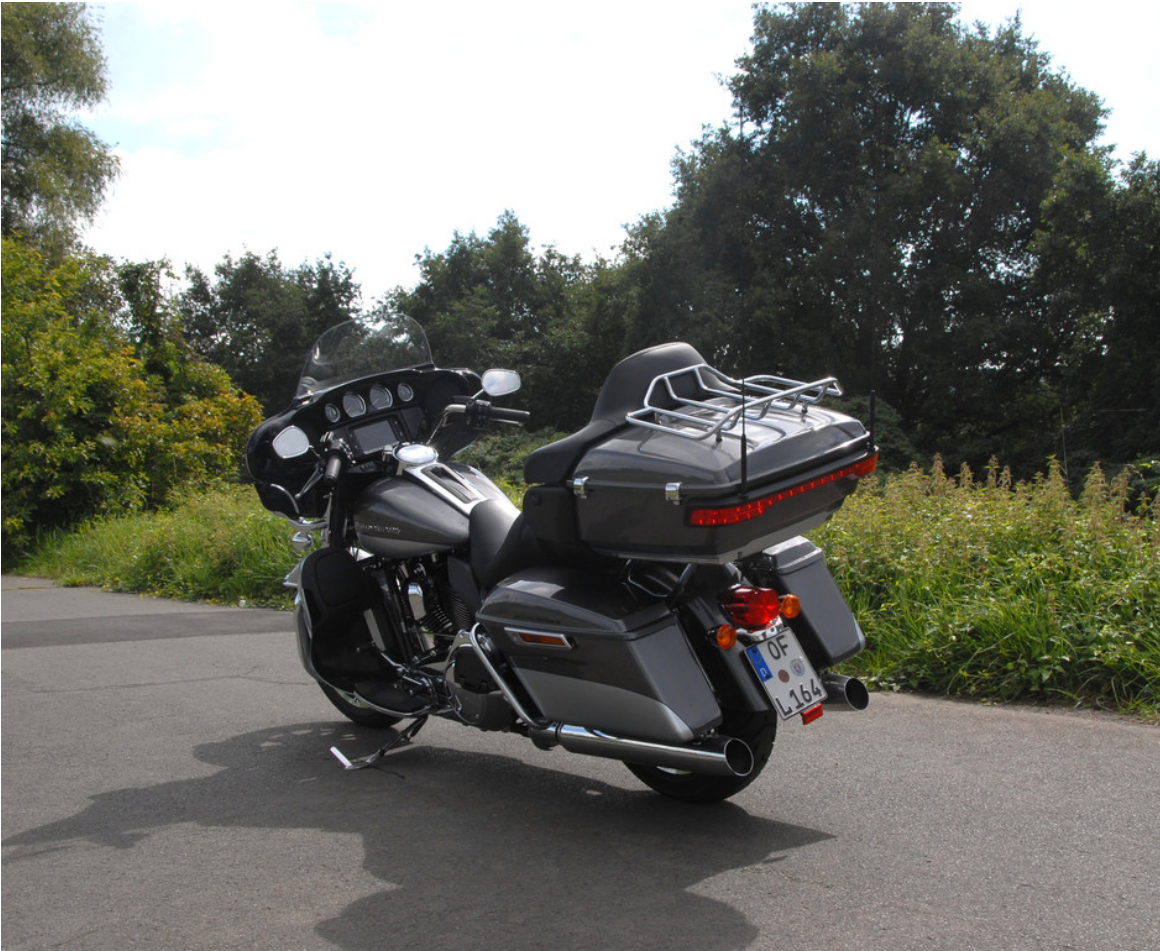
Harley-Davidson Electra Gilde Ultra Limited.