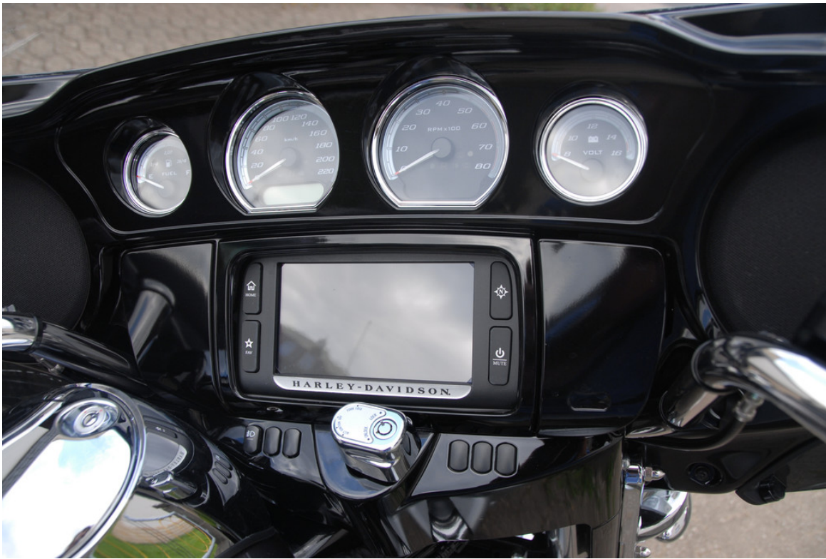
Harley-Davidson Electra Gilde Ultra Limited.