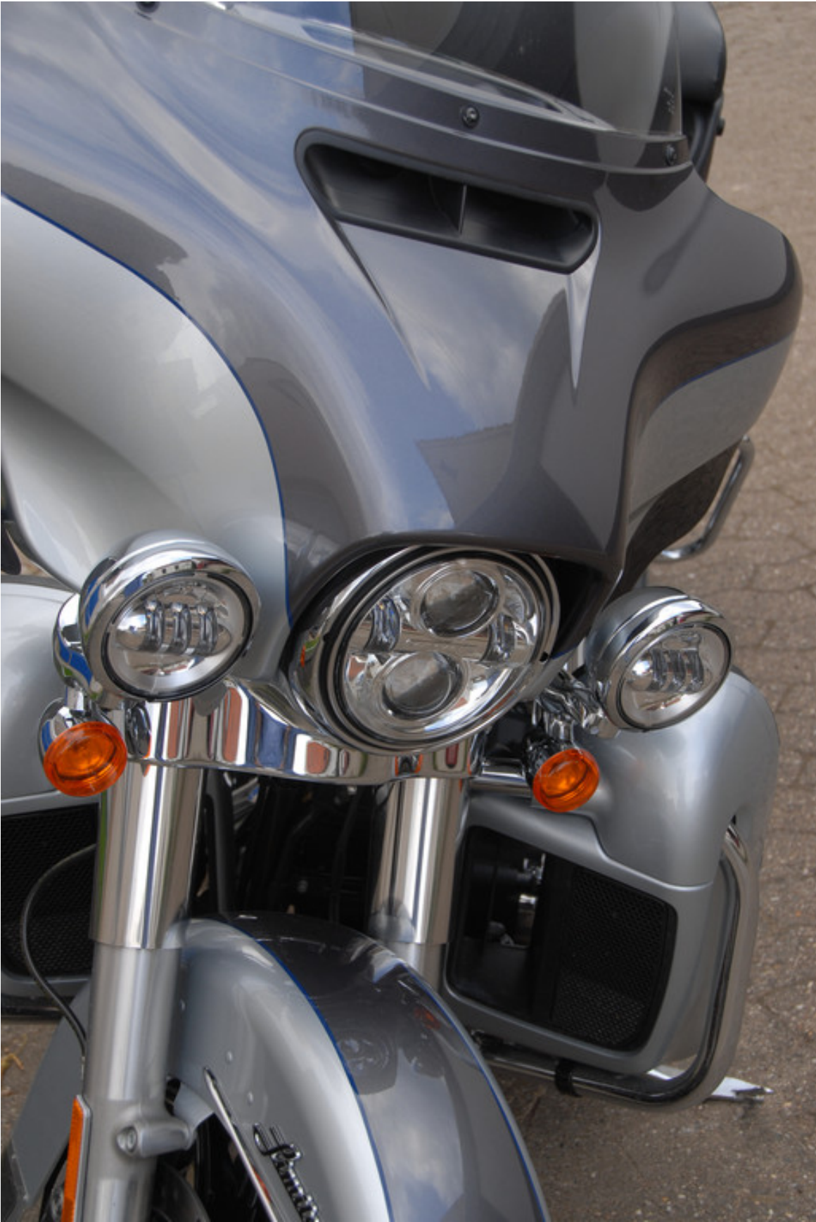
Harley-Davidson Electra Gilde Ultra Limited.