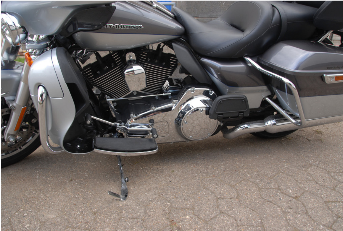
Harley-Davidson Electra Gilde Ultra Limited.