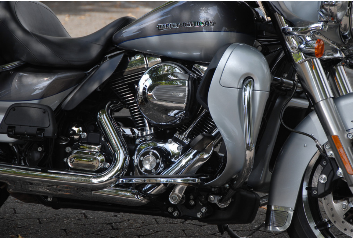
Harley-Davidson Electra Gilde Ultra Limited.