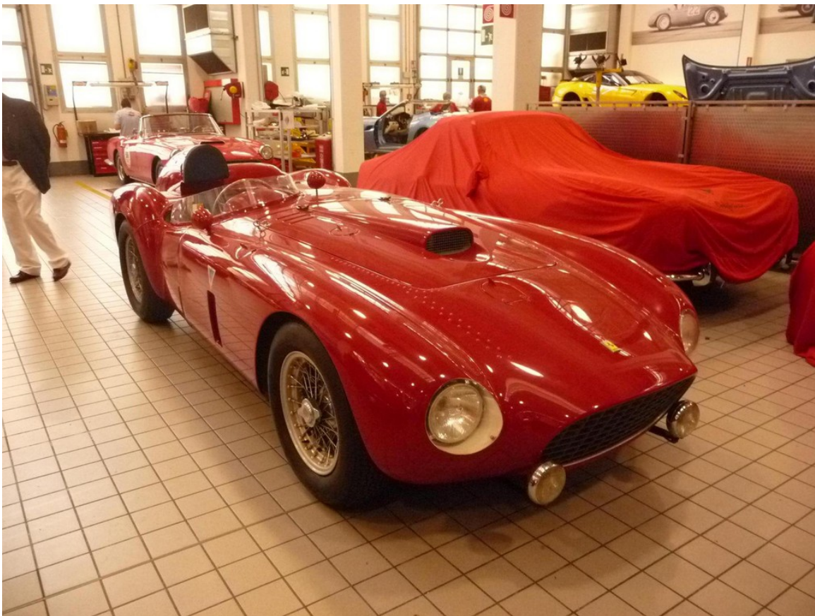
Ferrari 375 Plus (1954).