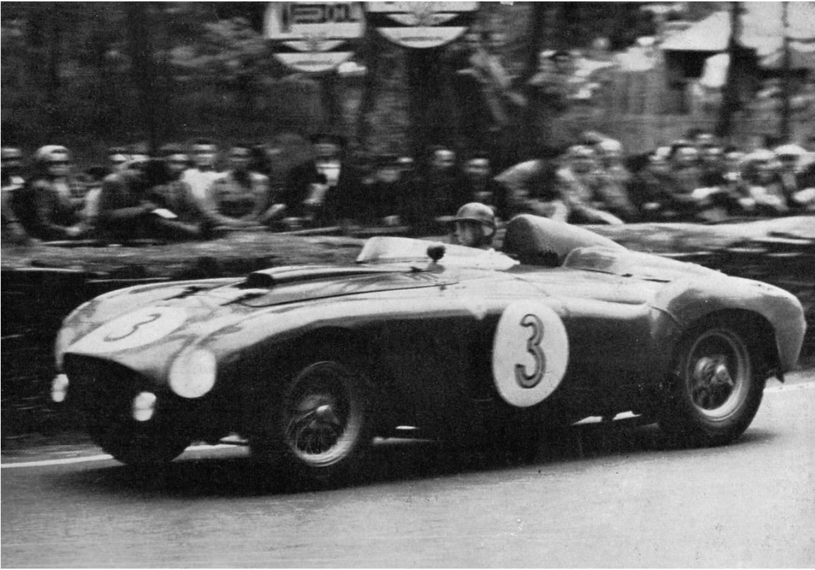
Ferrari 375 Plus (1954).