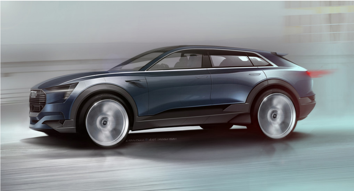
Audi E-Tron Quattro Concept.