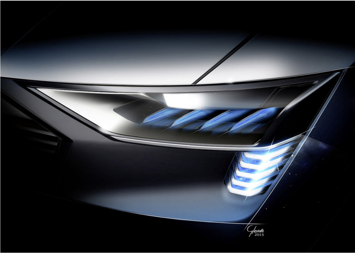
Audi E-Tron Quattro Concept.