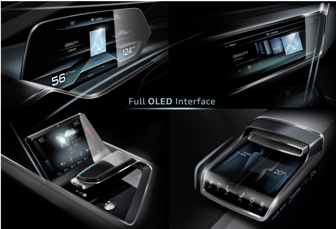
Audi E-Tron Quattro Concept.