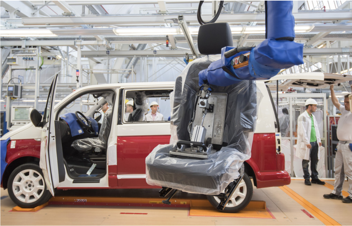
T6-Produktion im Volkswagen-Nutzfahrzeugwerk Hannover.