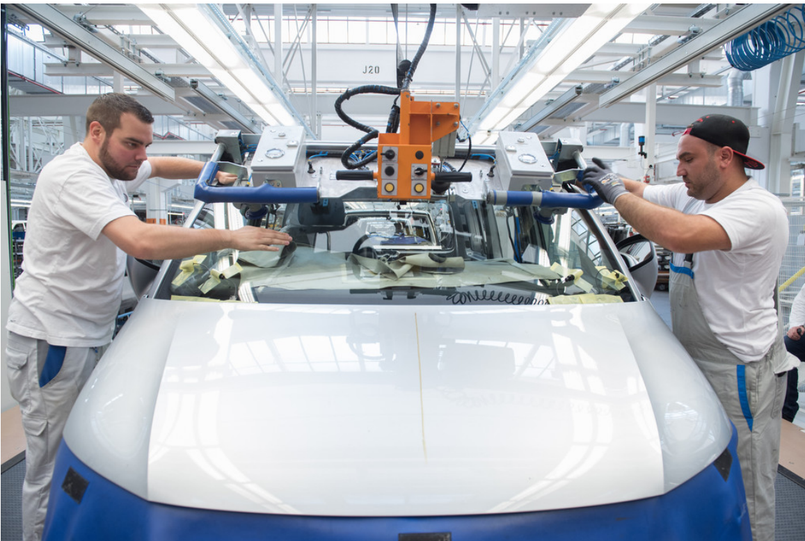
T6-Produktion im Volkswagen-Nutzfahrzeugwerk Hannover.