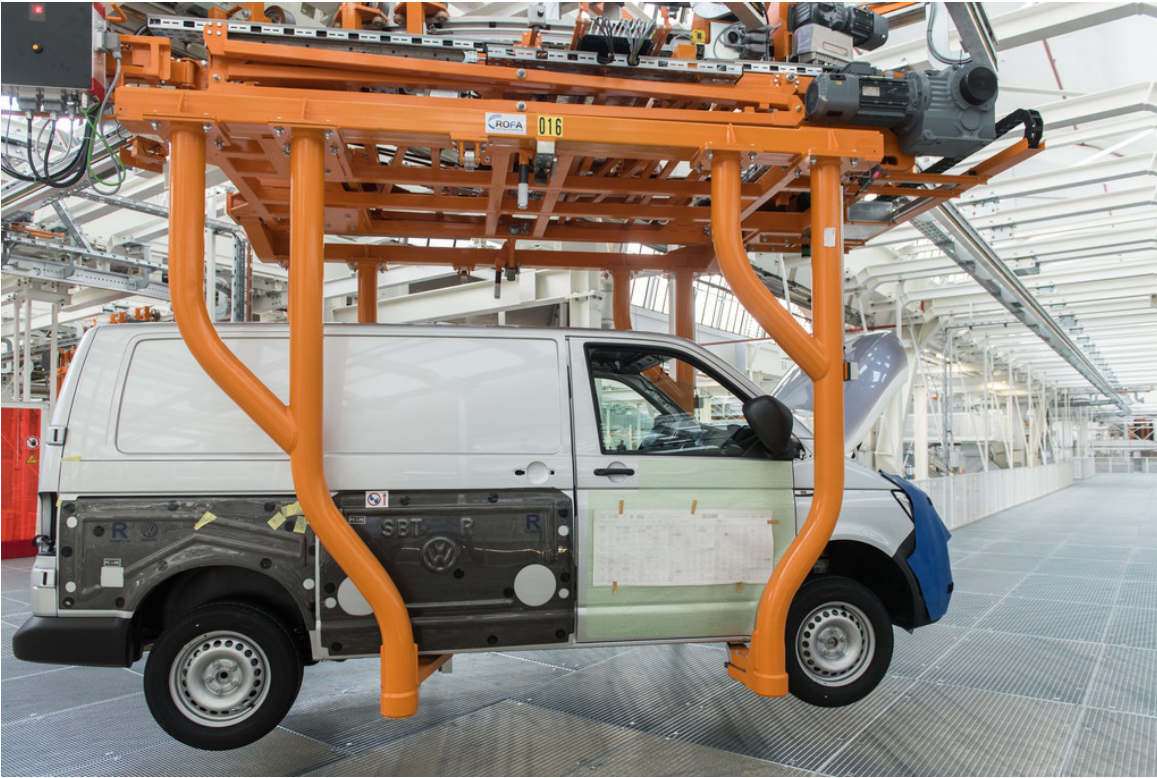
T6-Produktion im Volkswagen-Nutzfahrzeugwerk Hannover.