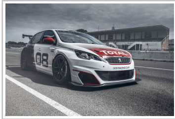
Peugeot 308 Racing Cup.