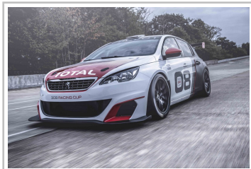
Peugeot 308 Racing Cup.