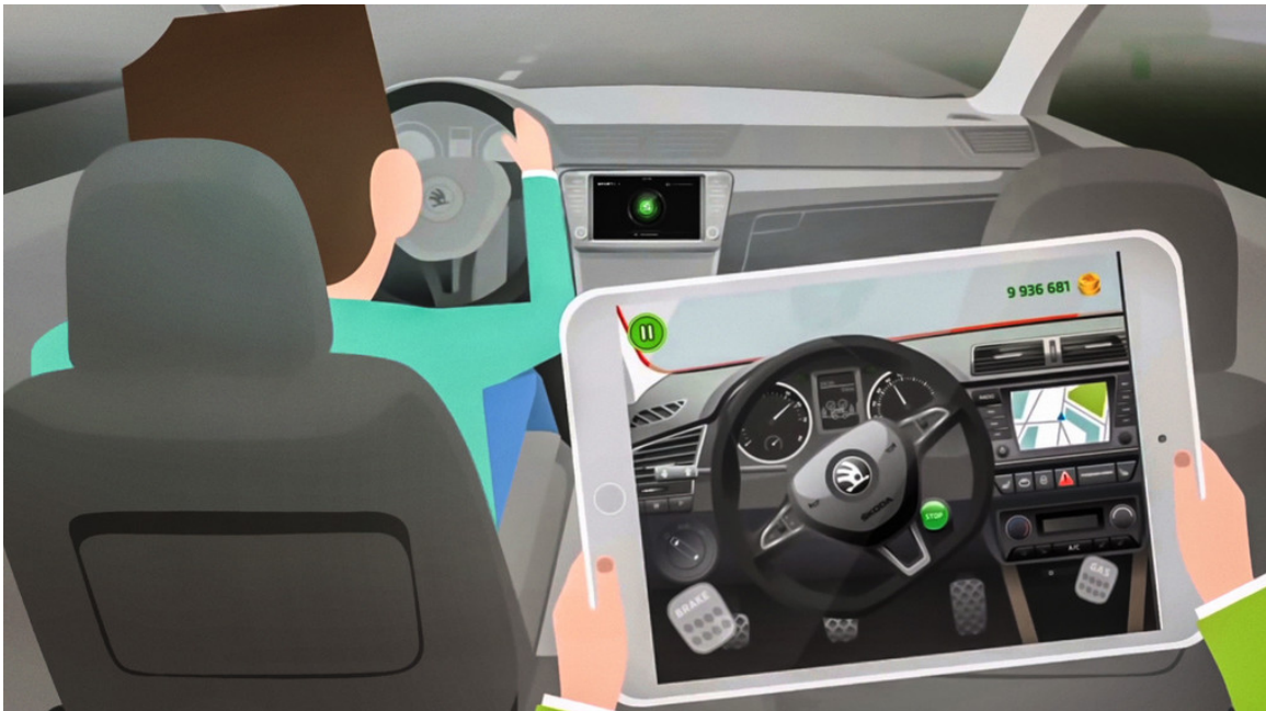
Skoda Little Driver App.