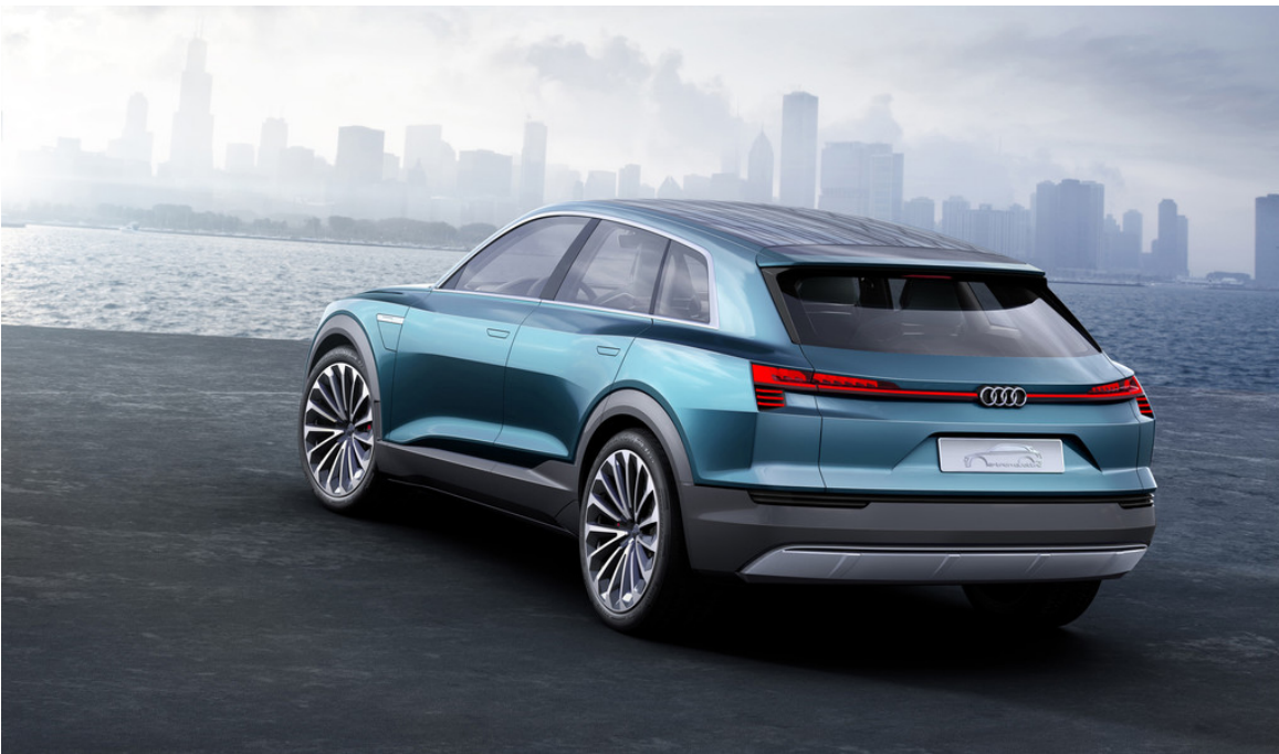
Audi E-Tron Quattro Concept.