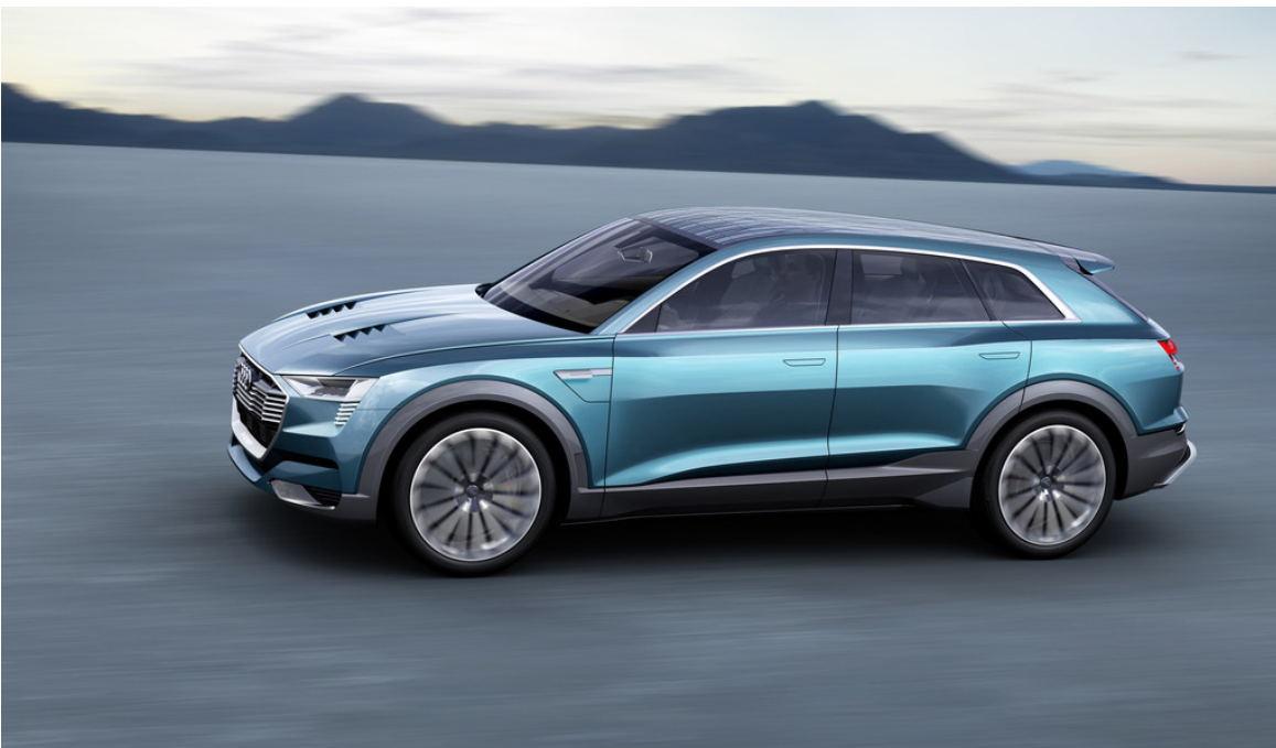
Audi E-Tron Quattro Concept.