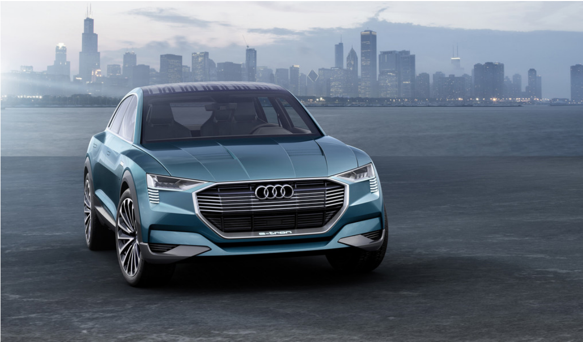
Audi E-Tron Quattro Concept.