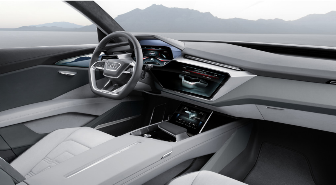
Audi E-Tron Quattro Concept.