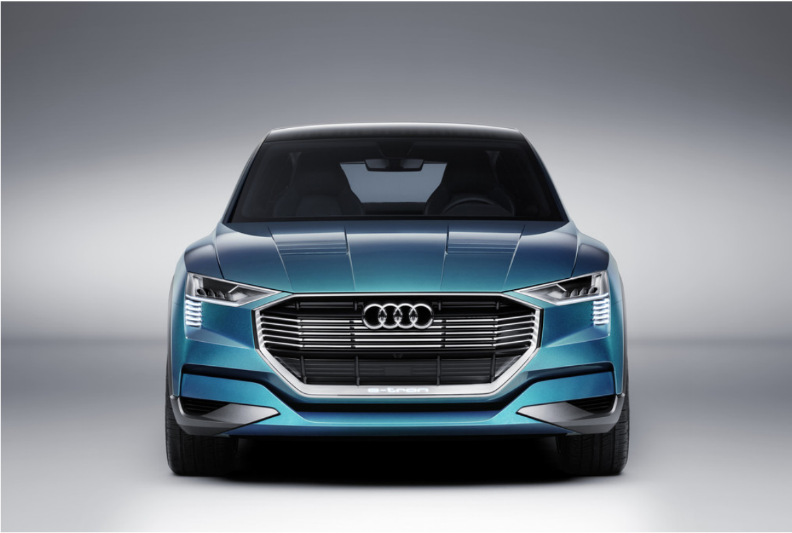
Audi E-Tron Quattro Concept.