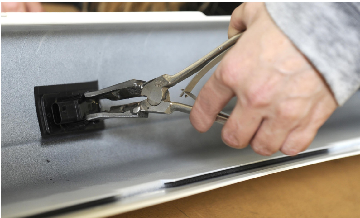
Mitarbeiteridee bei Volkswagen: Der neue „Spreizer“ in Einsatz.