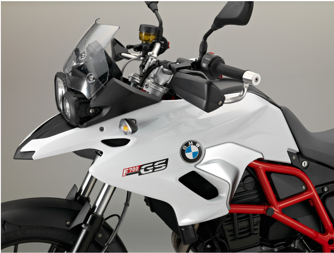
BMW 700 GS.