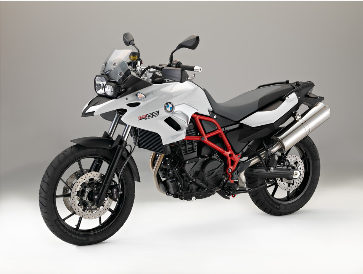
BMW F 700 GS.