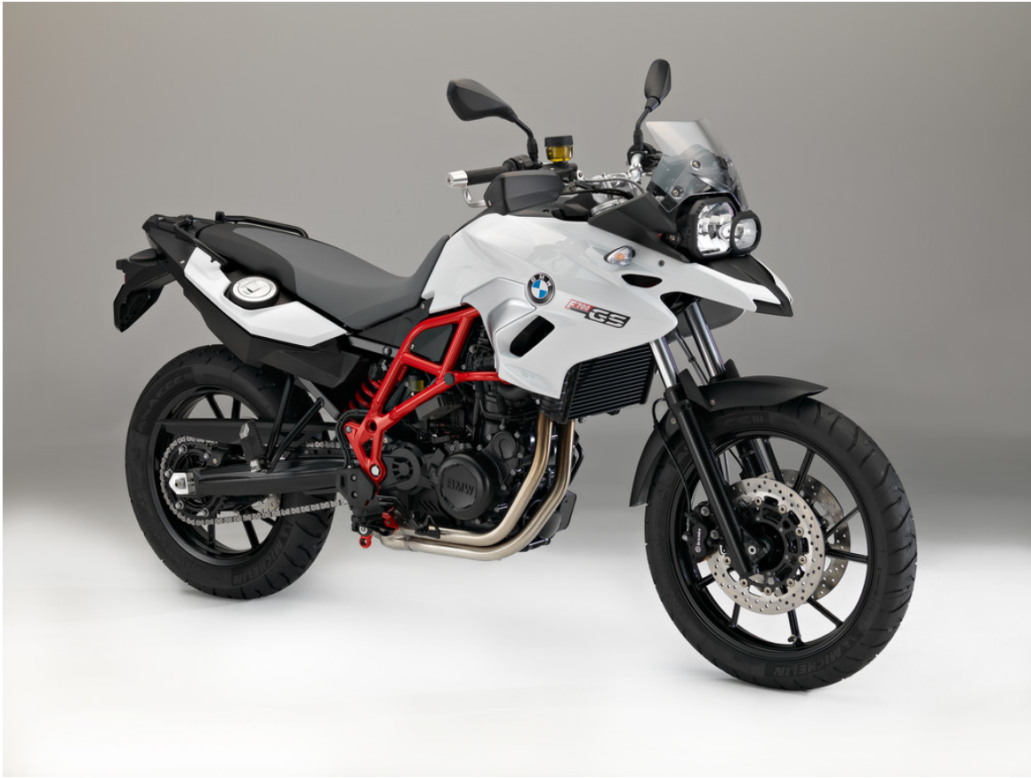
BMW F 700 GS.