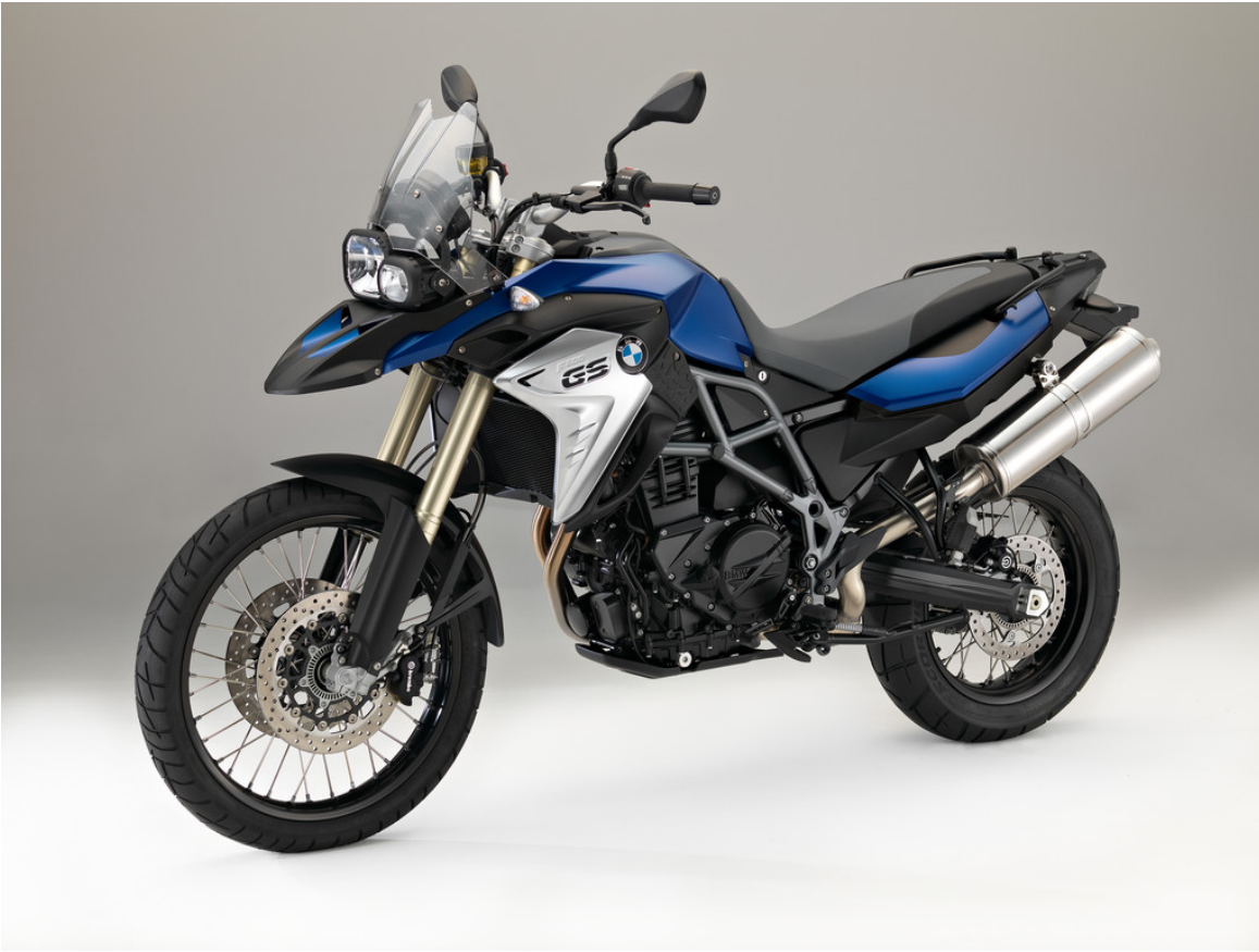
BMW F 800 GS.