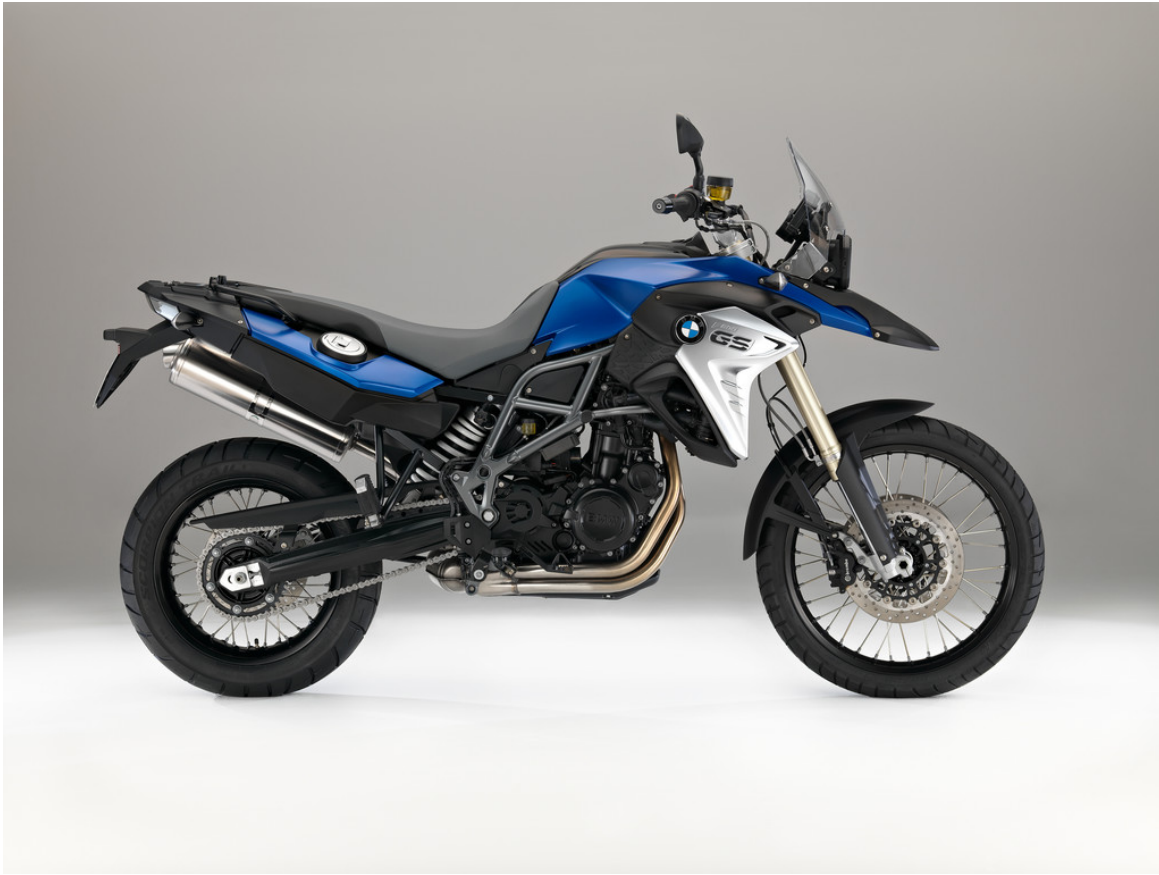
BMW F 800 GS.