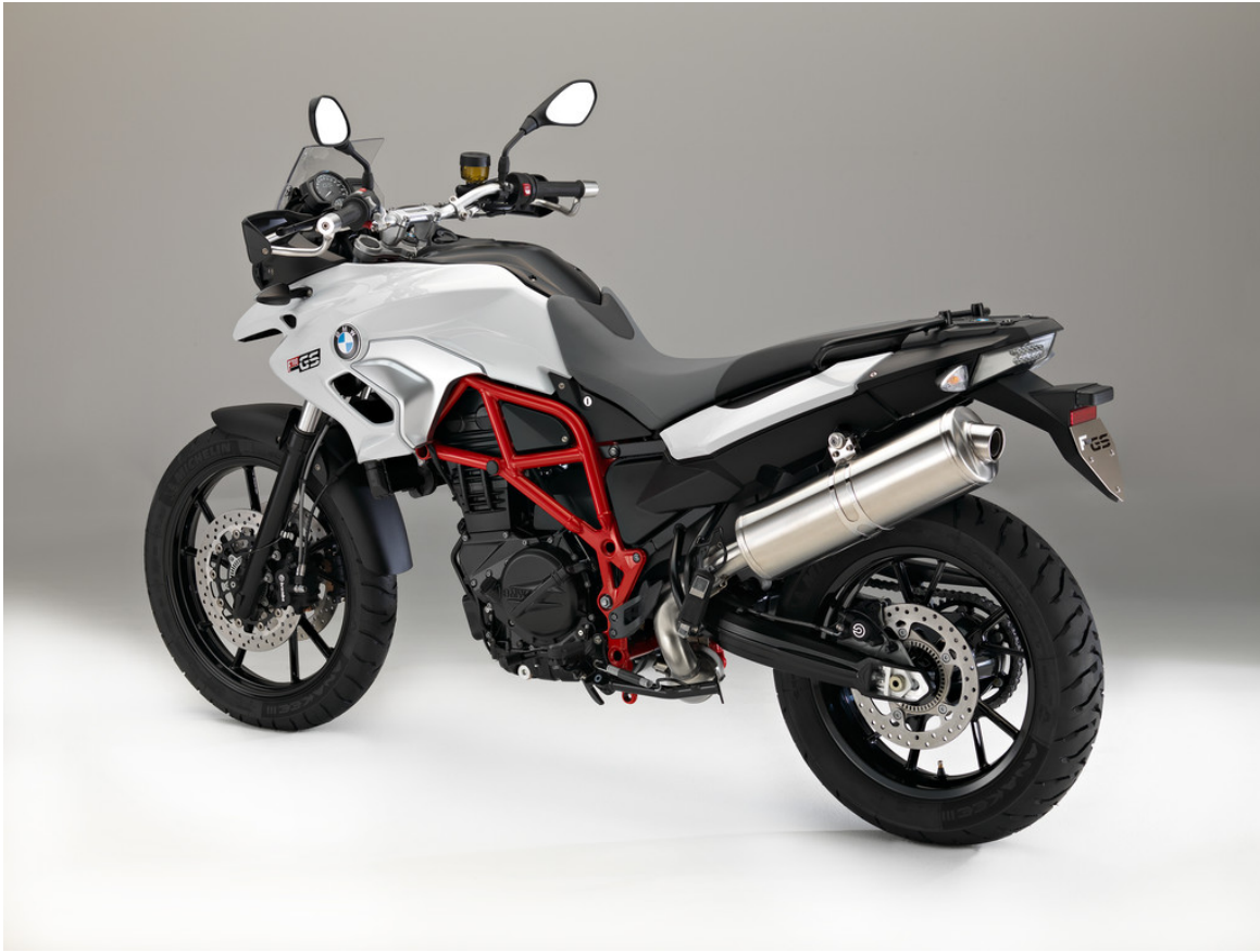
BMW F 700 GS.