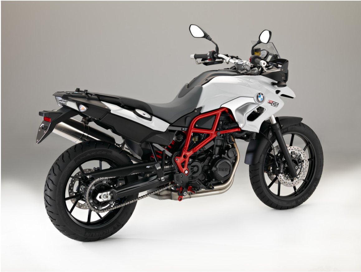
BMW F 700 GS.