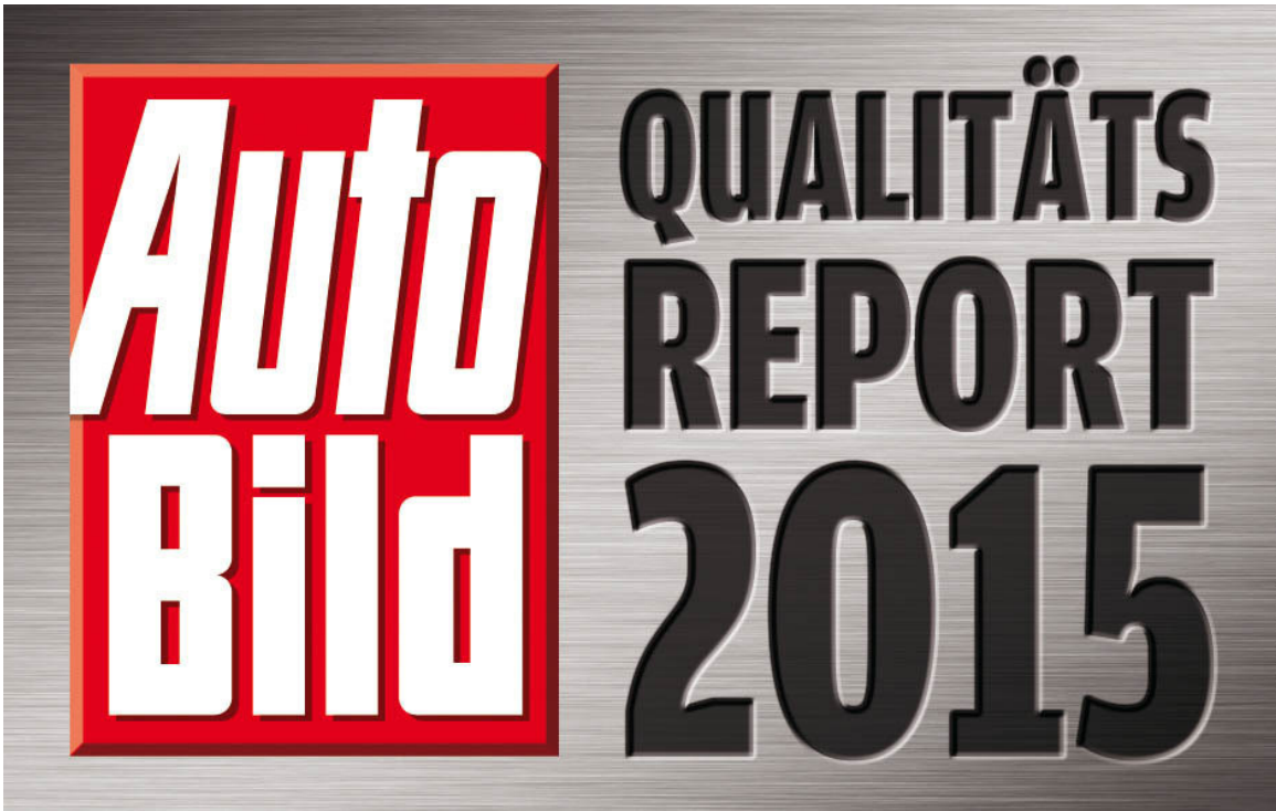
„Auto Bild“-Qualitätsreport 2015..