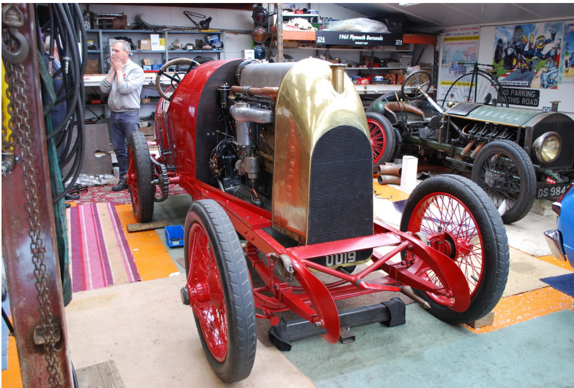
Fiat S 76 (1911).