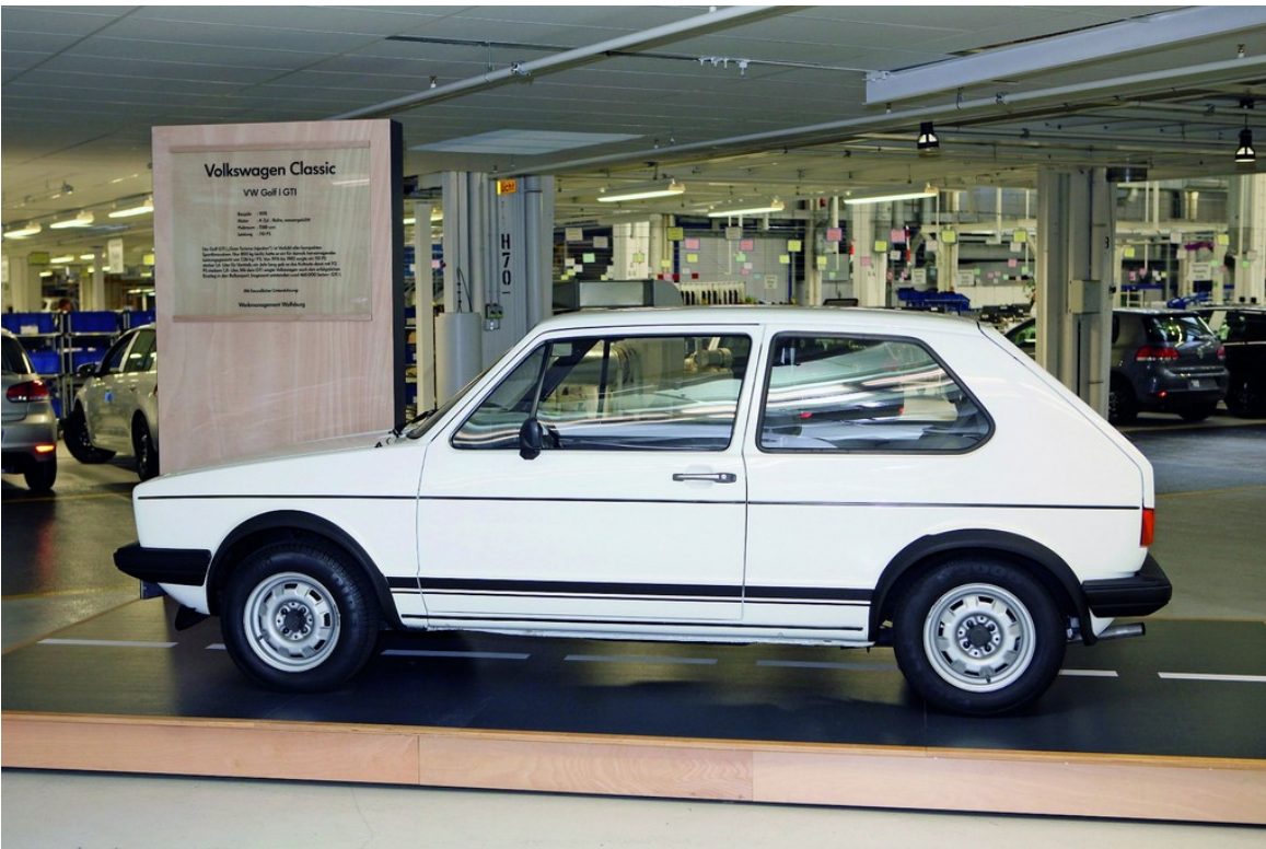
Volkswagen Golf GTI (1978).