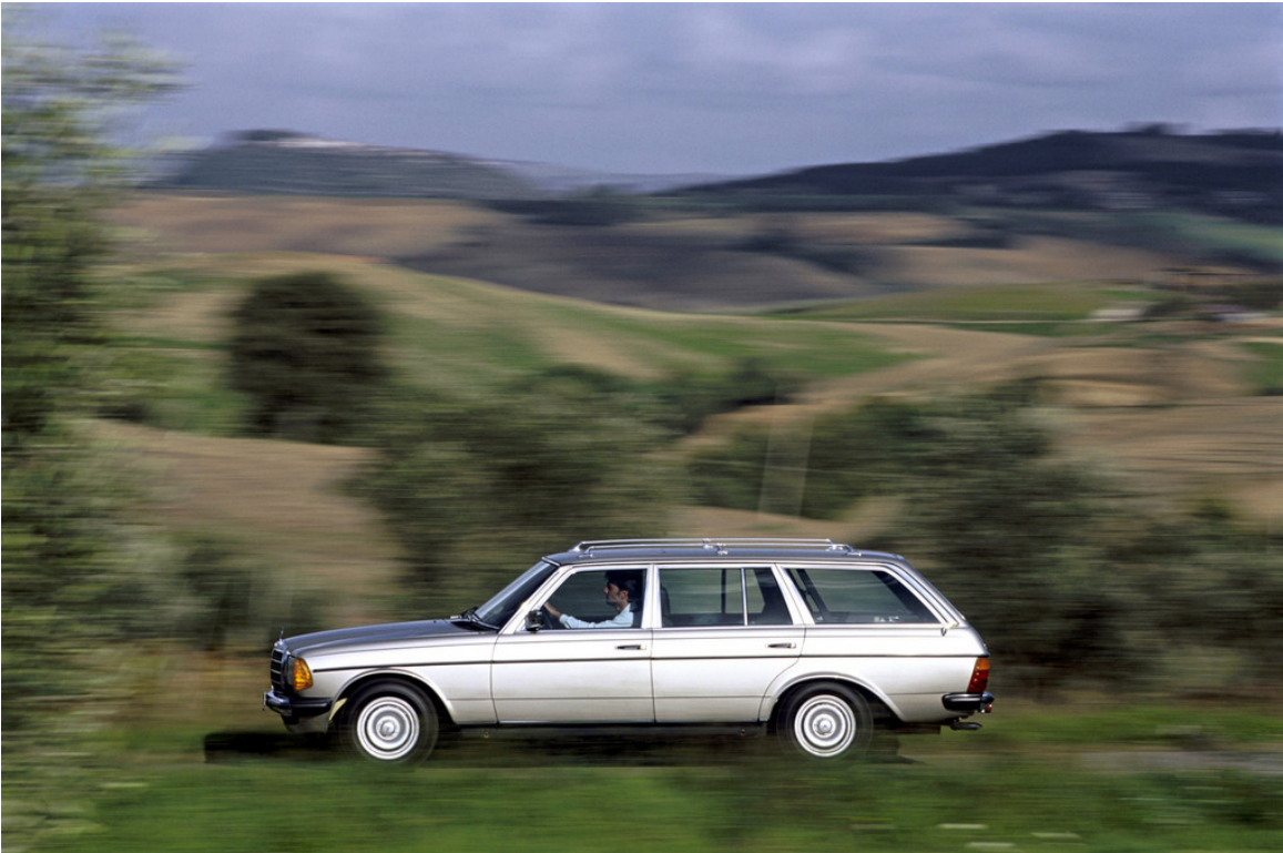
Mercedes-Benz T-Modell der Baureihe W 123.