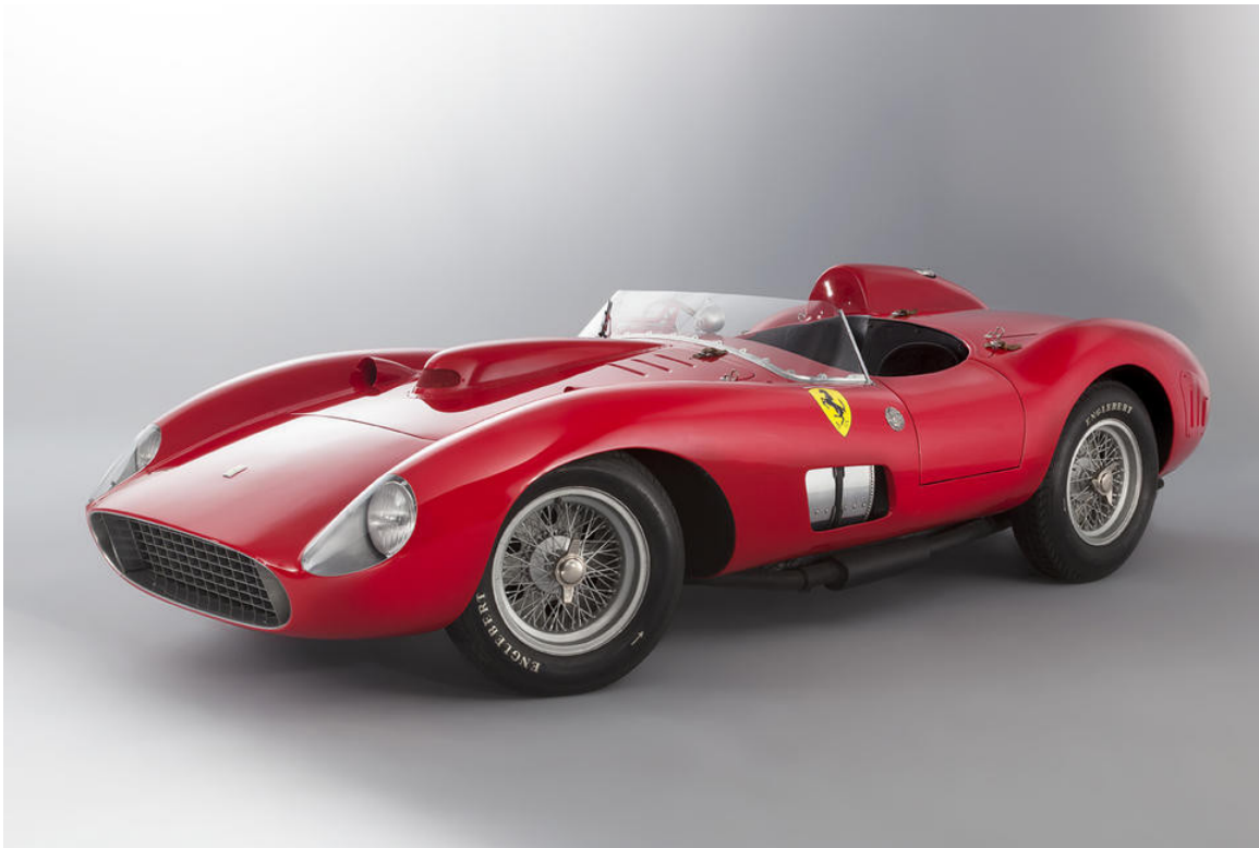
Ferrari 335 S Scaglietti.