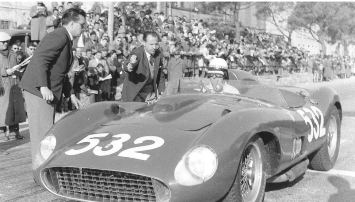
Wolfgang Berge von Trips fuhr das Chassis No. 0674 des Ferrari 335 S Scaglietti 1957 bei der Mille Miglia auf Platz 2.