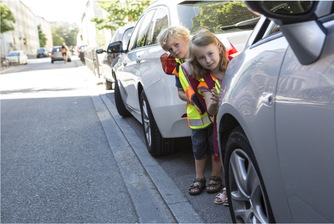
Kinder im Straßenverkehr.