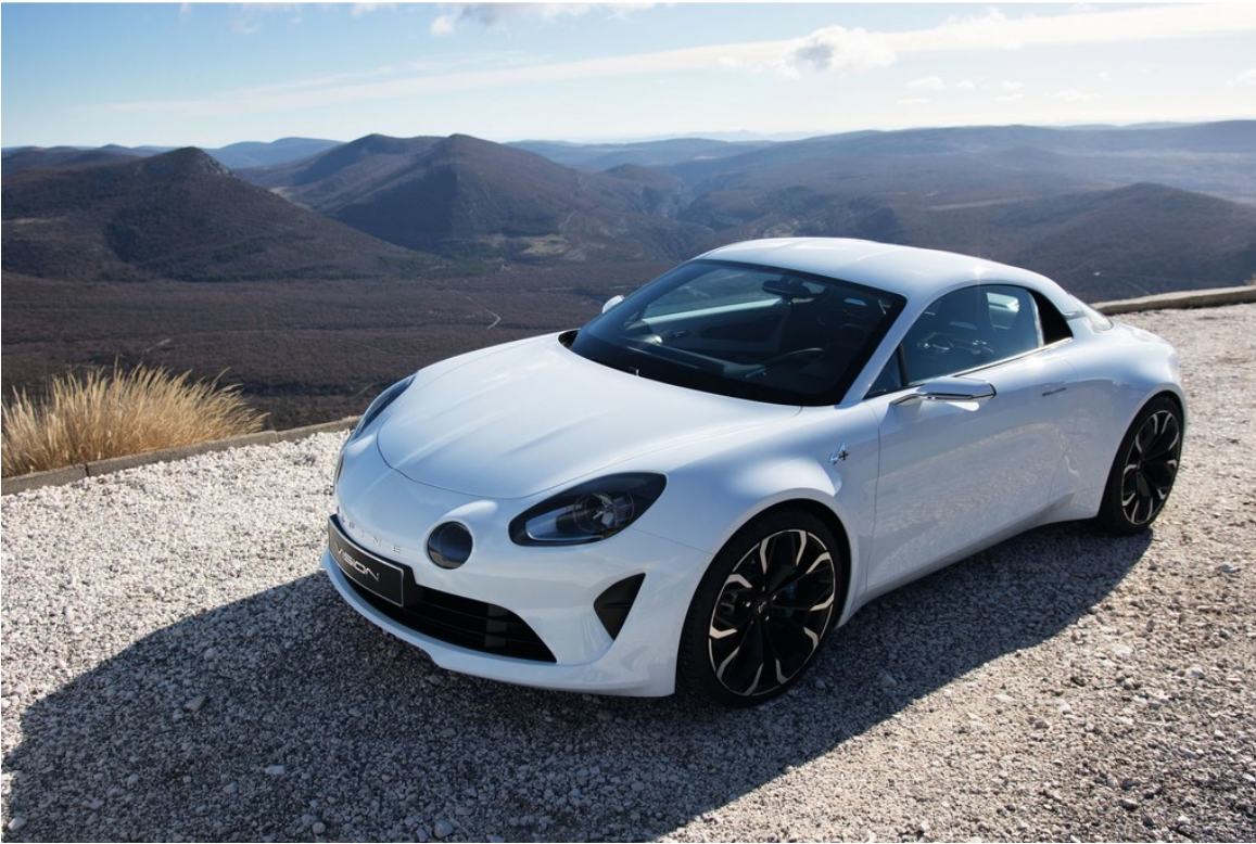
Renault Alpine Vision.