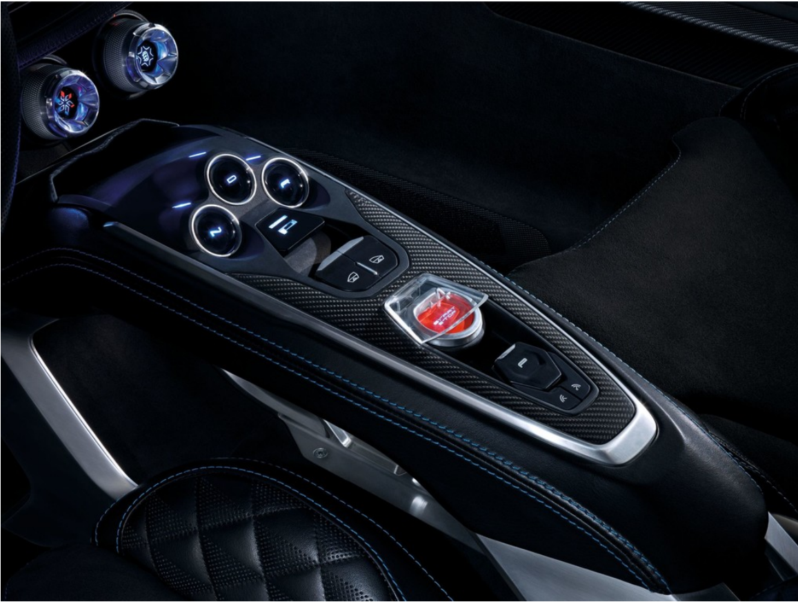
Renault Alpine Vision.