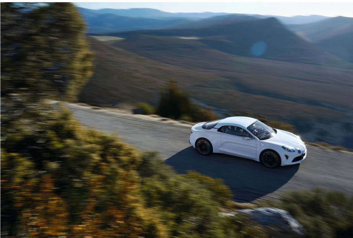
Renault Alpine Vision.