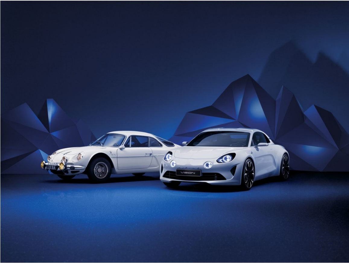
Renault Alpine Vision (r.) und das Vorbild A 110.