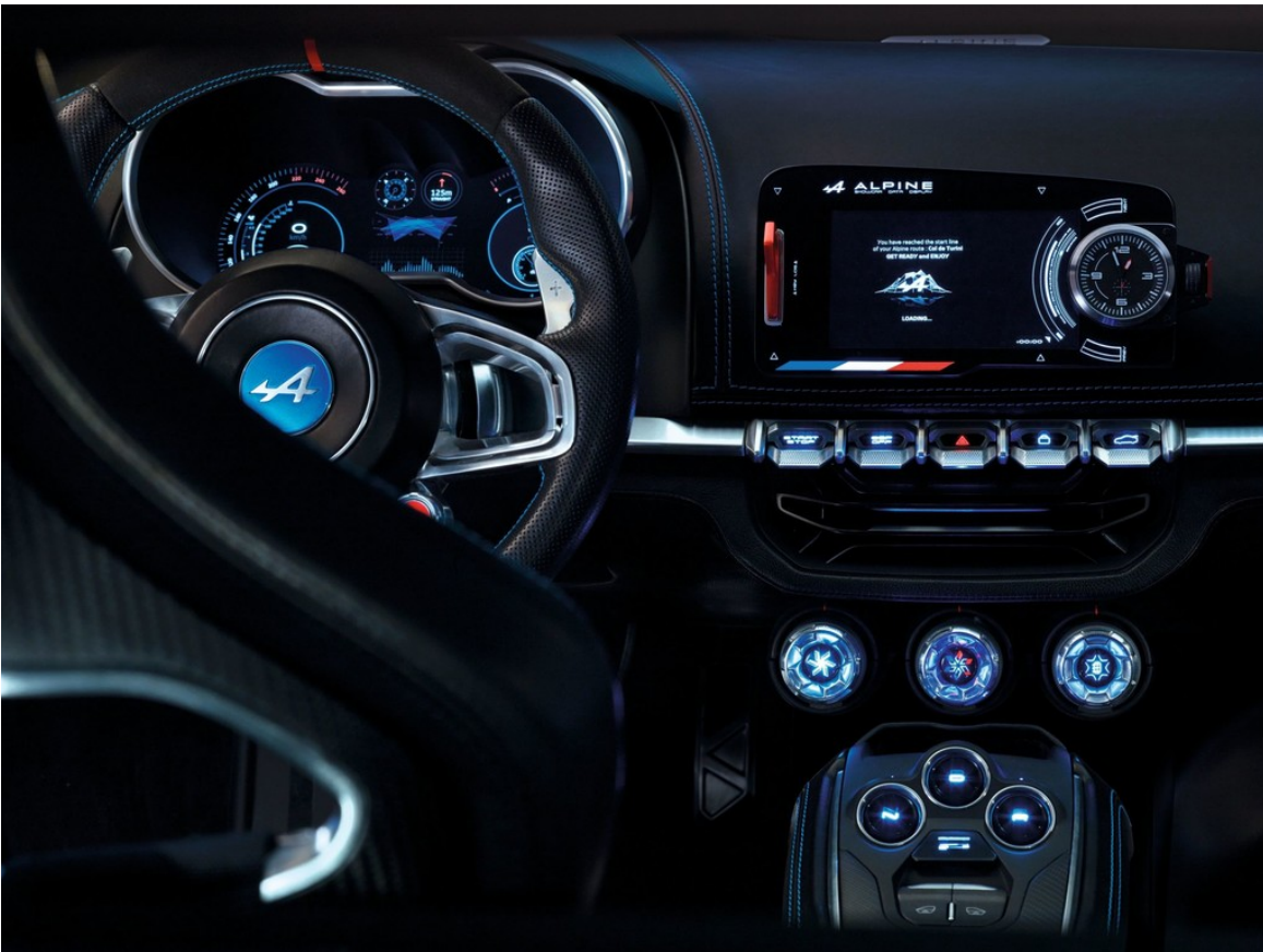
Renault Alpine Vision.