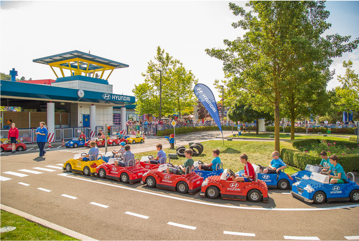
Hyundai-Familiientage im Legoland Günzburg.