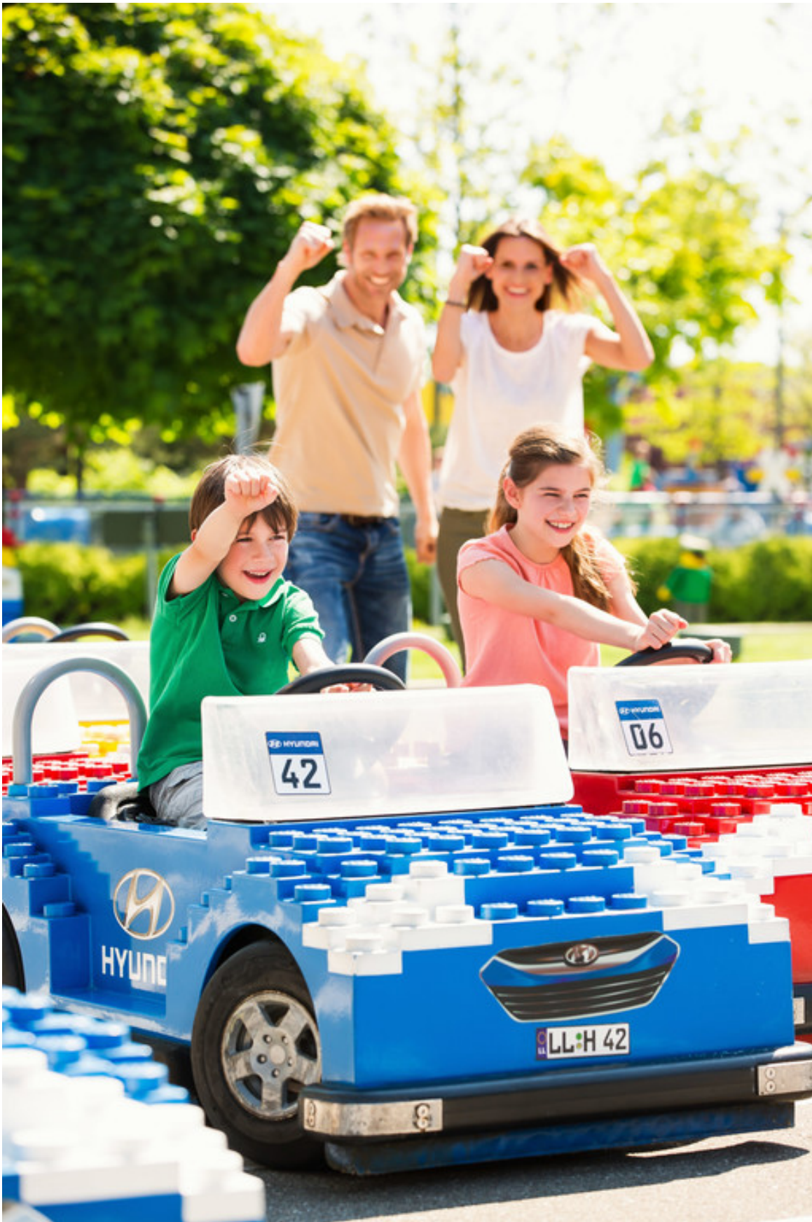
Hyundai-Familientage im Legoland Günzburg.