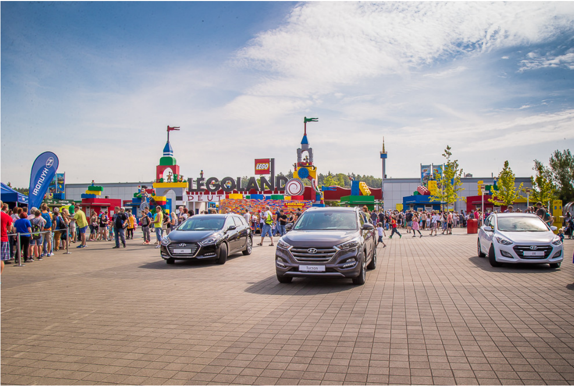
Hyundai-Familiientage im Legoland Günzburg.