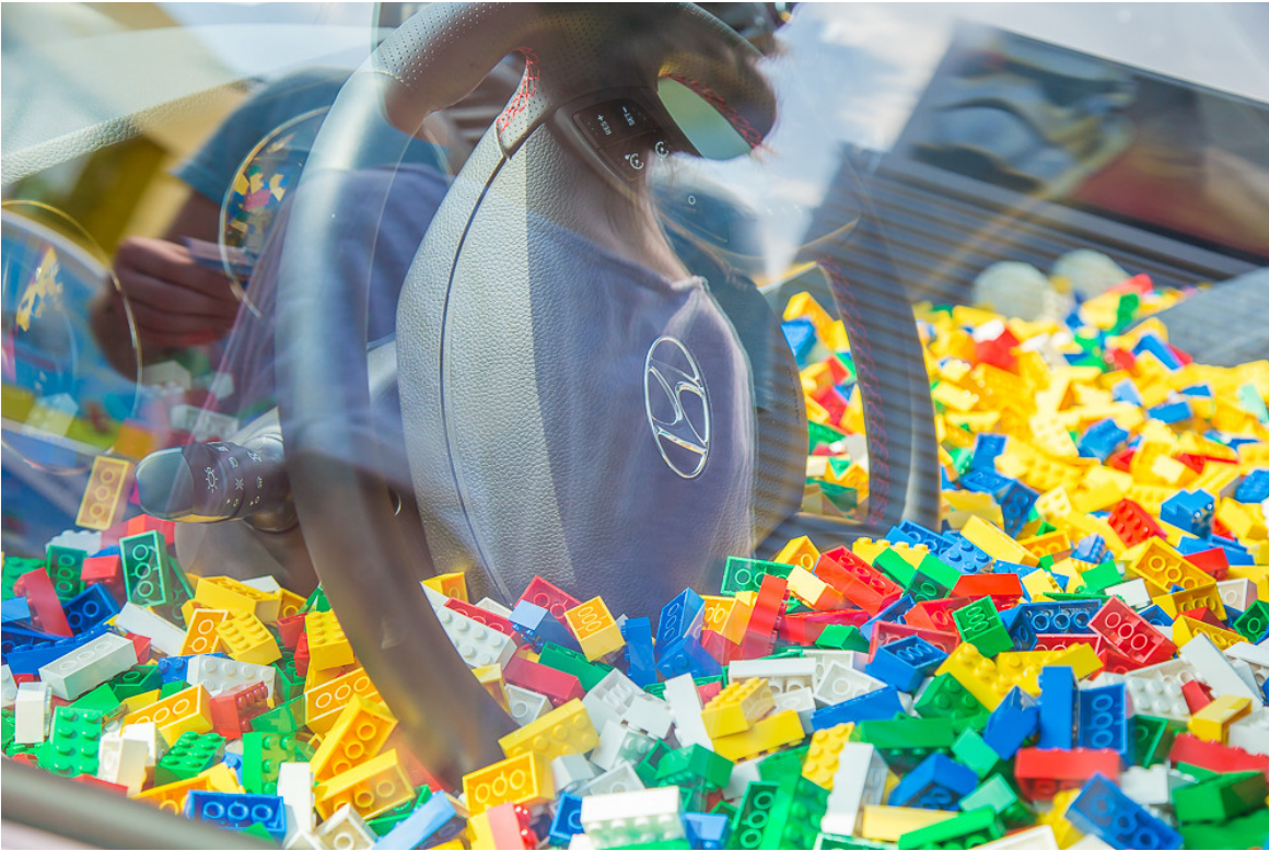
Hyundai-Familientage im Legoland Günzburg.