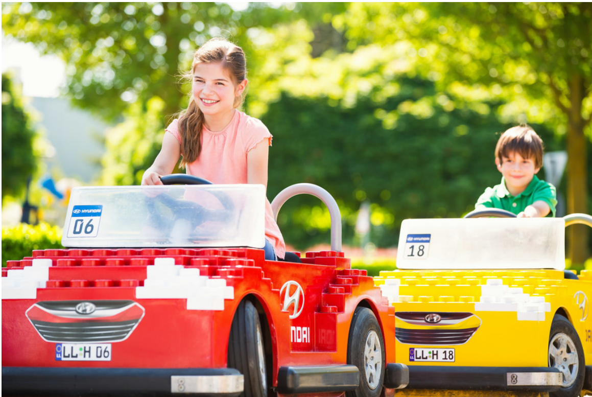
Hyundai-Familientage im Legoland Günzburg.