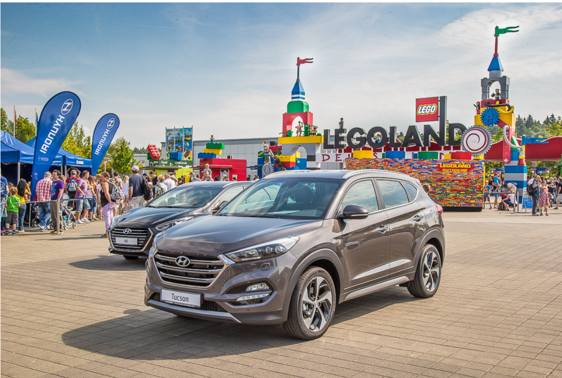
Hyundai-Familiientage im Legoland Günzburg.