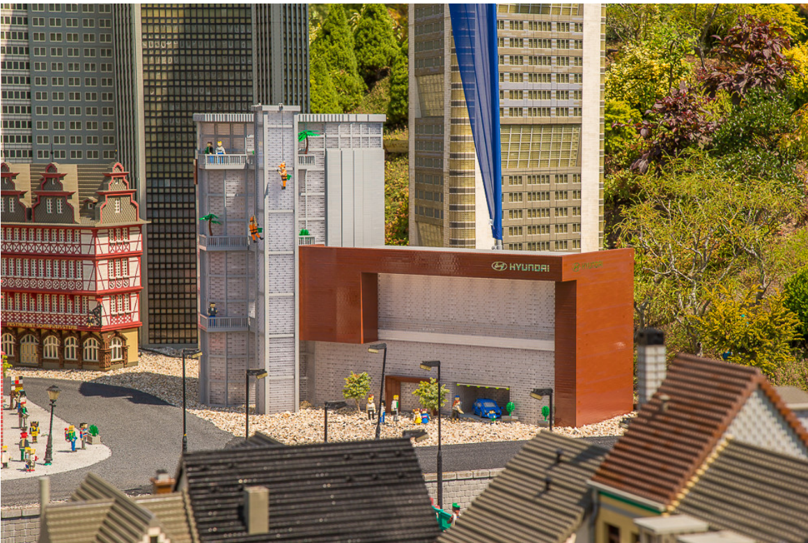
Hyundai-Familientage im Legoland Günzburg.