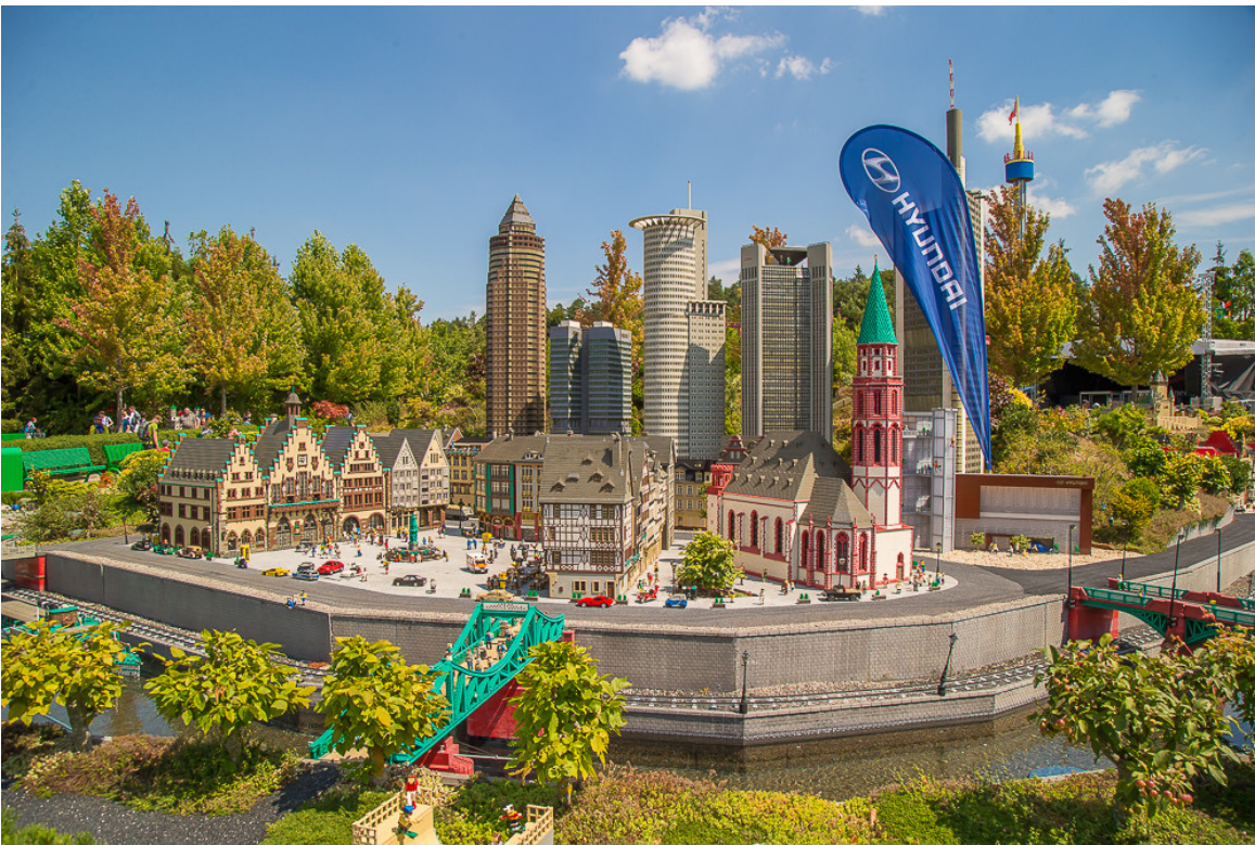
Hyundai-Familiientage im Legoland Günzburg.