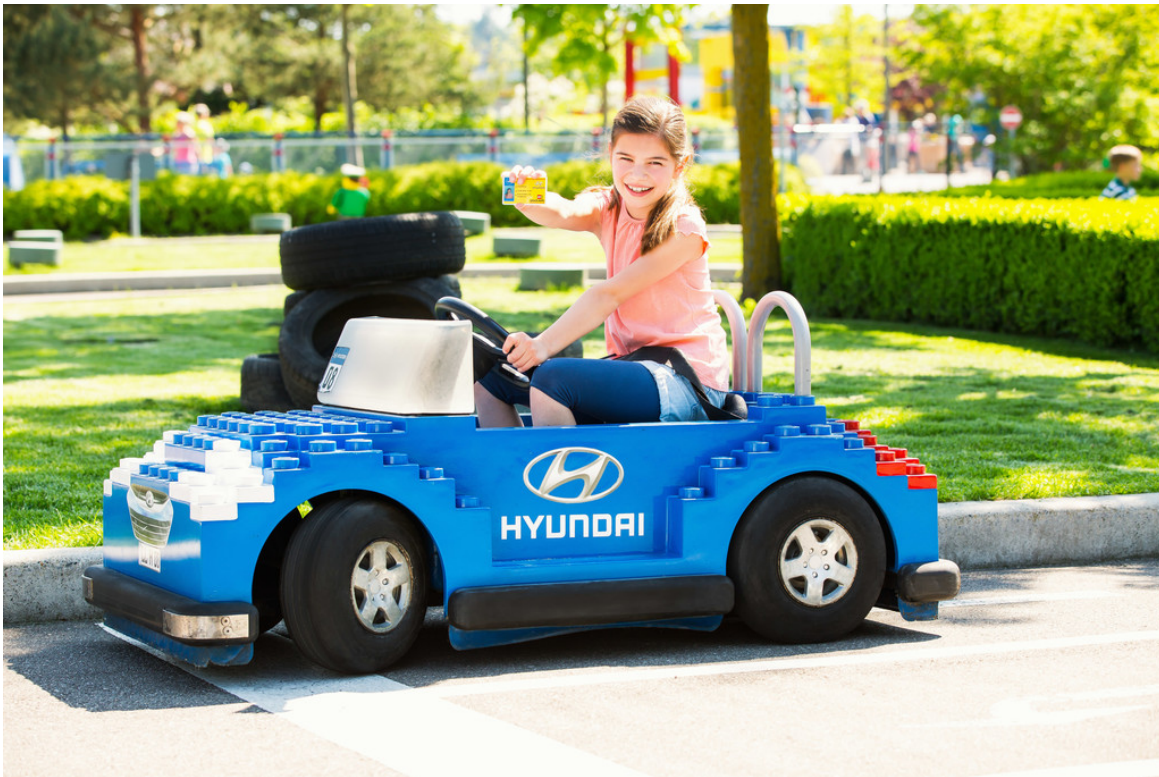
Hyundai-Familiientage im Legoland Günzburg.