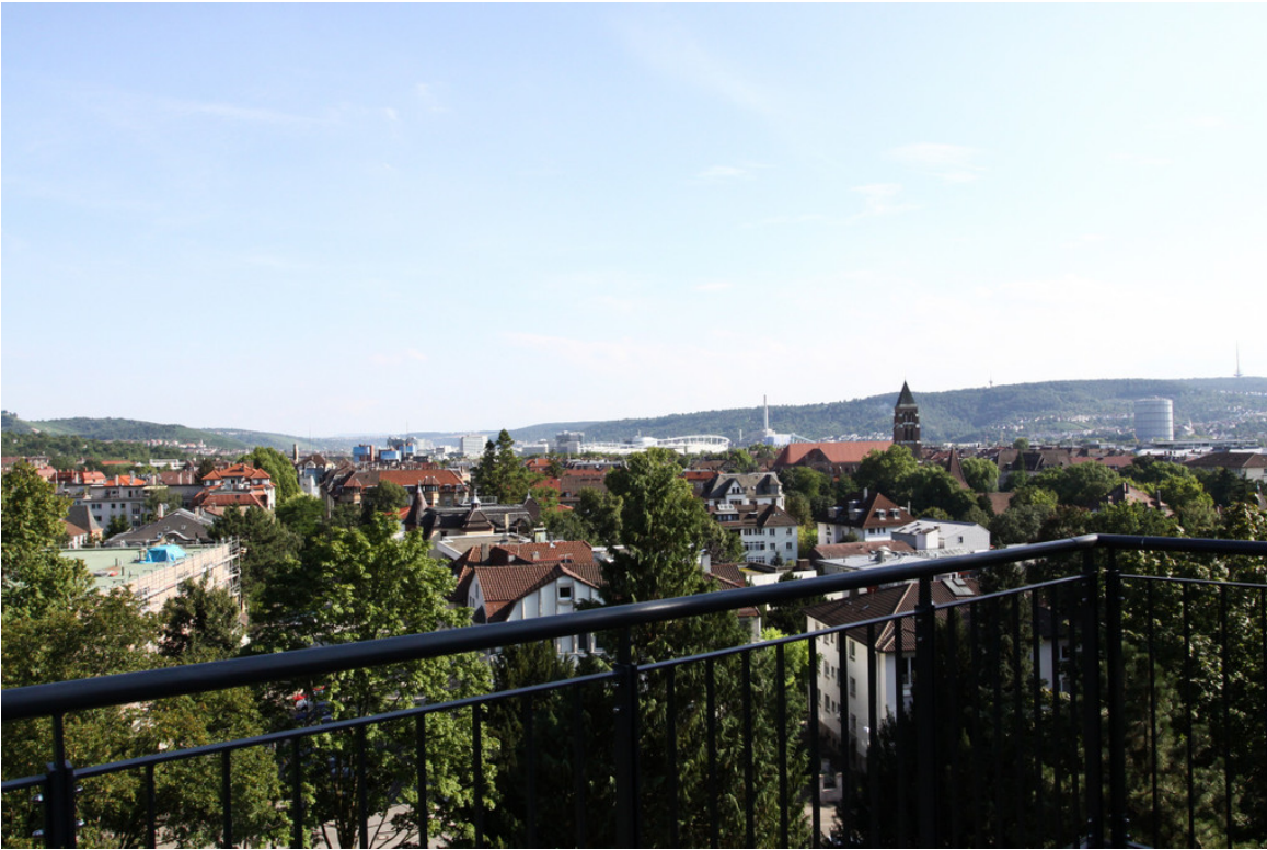
Aussicht vom Daimlerturm.