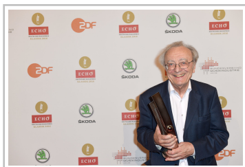
Echo Klassik 2016: Alfred Brendel.