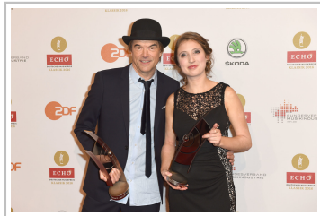
Echo Klassik 2016: Campino und Lida Winkler.