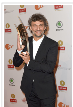
Echo Klassik 2016: Jonas Kaufmann.