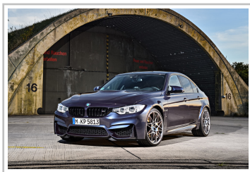
BMW M3 „30 Jahre M3“.