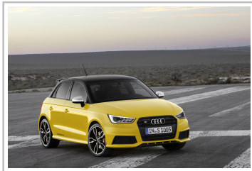
Audi S1 Sportback.