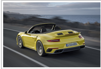
Porsche 911 Turbo S Cabriolet.