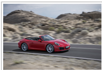
Porsche 911 Carrera S Cabrio.