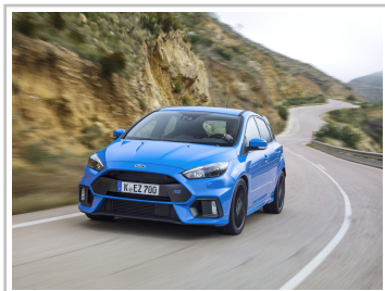
Ford Focus RS.