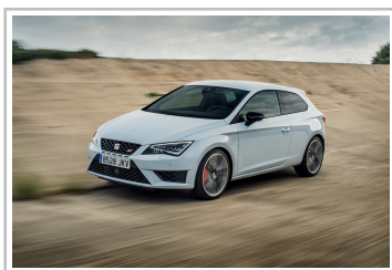
Seat Leon Cupra 290.