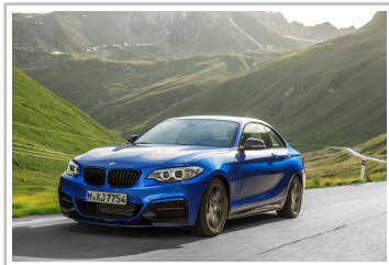
BMW M235i Coupé.