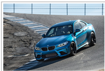
BMW M2 Coupé.