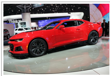
Chevrolet Camaro ZL 1.