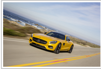
Mercedes-AMG GT S.