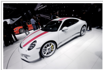
Porsche 911 R.