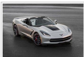
Chevrolet Camaro Corvette Convertible.