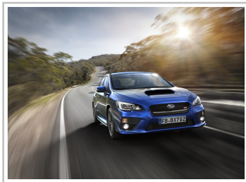
Subaru WRX STI.