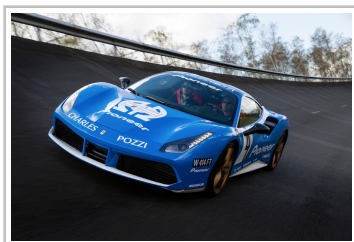
Ferrari 488 GTB.