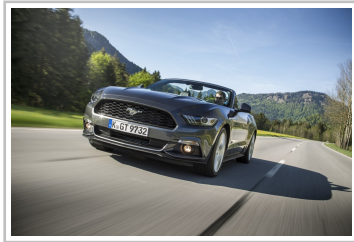
Ford Mustang Convertible.