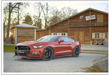
Geiger Mustang GT..