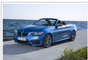
BMW M235i Cabrio.