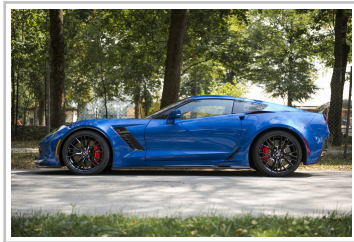
Geiger Corvette Z06.