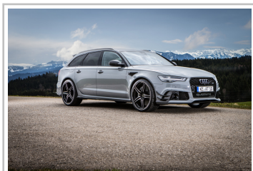
Abt Audi RS 6 RS 6 „1 of 12“.