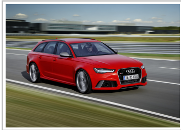
Audi RS 6 Avant Performance.