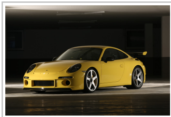
Ruf RtR Narrow.