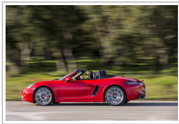
Porsche 718 Boxster S.