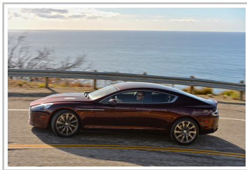
Aston Martin Rapide S.