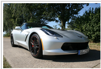
Chevrolet Corvette Stingray.