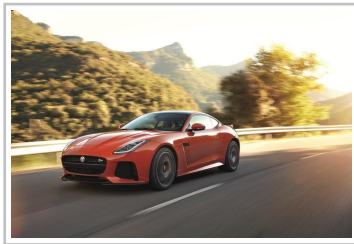
Jaguar F-Type SVR.