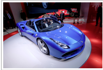
Ferrari 488 Spider.