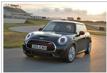
Mini John Cooper Works.