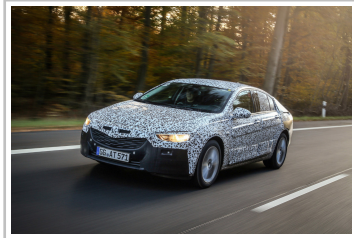
Noch getarnt: Opel Insignia Grand Sport.