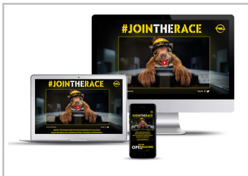
Opel-Video „Racing Faces“.