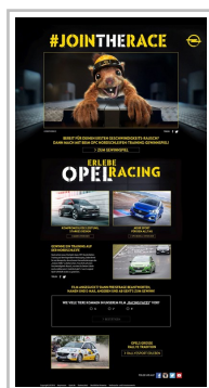
Opel-Video „Racing Faces“.